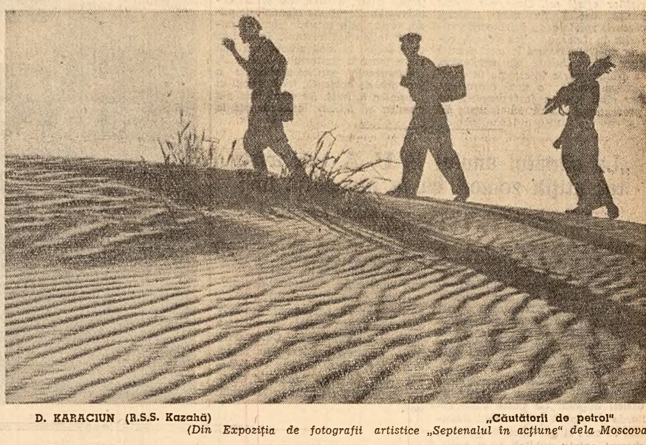
D. KARACIUN (R.S.S. Kazahă) „Căutătorii de petrol” (Din Expoziția de fotografii artistice „Septenul în acțiune” dela Moscova).