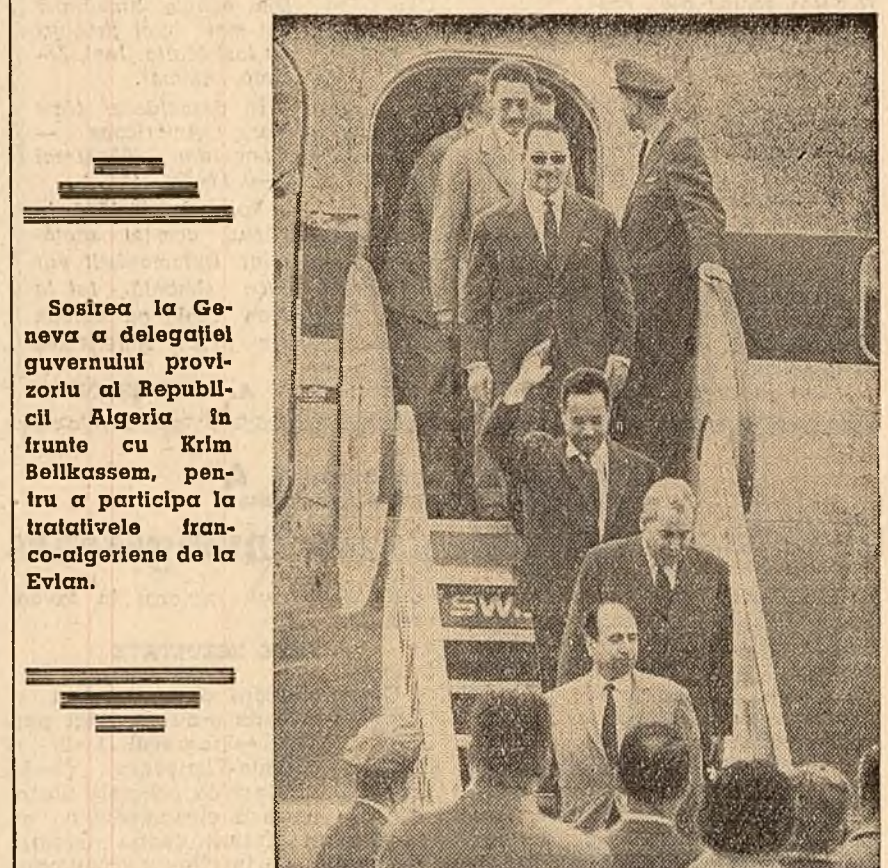
Sosirea la Geneva a delegației guvernului provizoriu al Republicii Algeria în frunte cu Krim Belkassam, pentru a participa la tratativele franco-algeriene de la Evian.