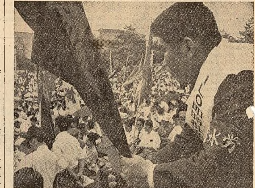
În ultimele zile, în Japonia au avut loc numeroase acțiuni de protest împotriva tratatului militar japoano-american. În fotografie: Aspect de la un miting al muncitorilor și funcționarilor publici din Tokio.