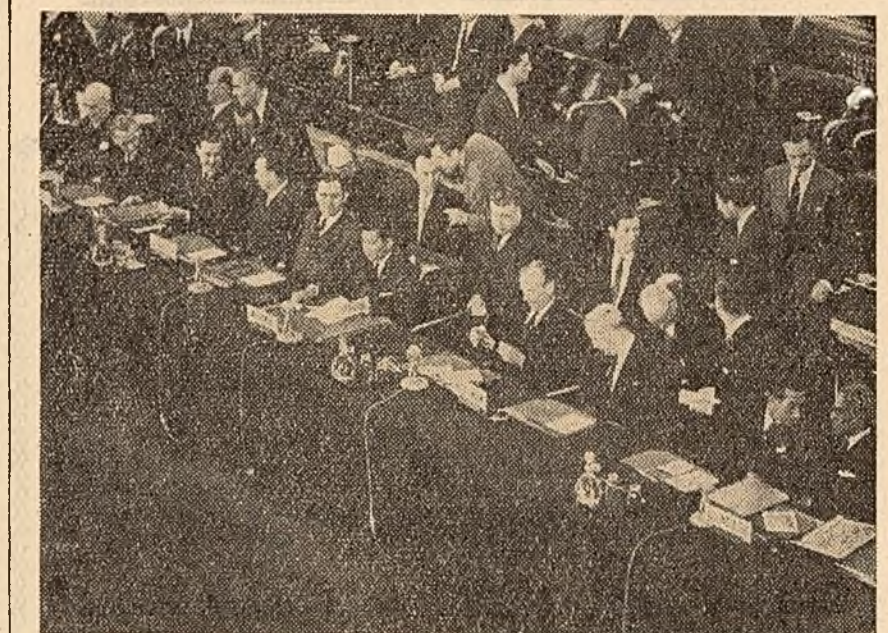
Zilele trecute, la Geneva, s-a deschis conferința internațională pentru reglementarea problemei laotiene. În fotografie: un aspect de la conferință.