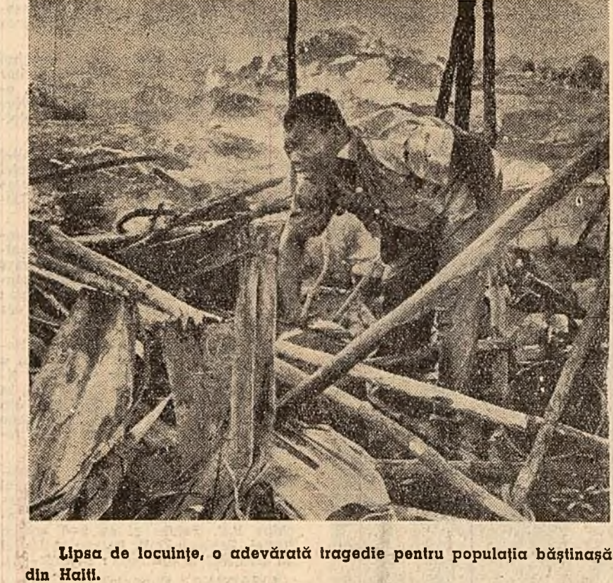
Lipsa de locuințe, o adevărată tragedie pentru populația băștinasă din Haiti.

BONN. În toate regiunile din R.F.G. se desfășoară, cu sprijinul larg al populației, crearea organizațiilor locale ale Uniunii germane a păcii. Acest partid politic intruneste oameni care, independent de concepțiile și de ideologia lor, sînt ferm hotărîți să se opună actualei orientări militariste a Bonnului.