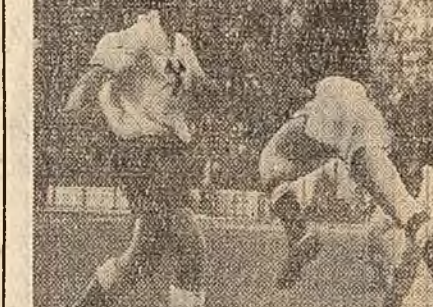
Faze din meciurile de fotbal disputate în Capitală (stînga): Rapid-Minezul; (dreapta): C.C.A.-U.T.A.