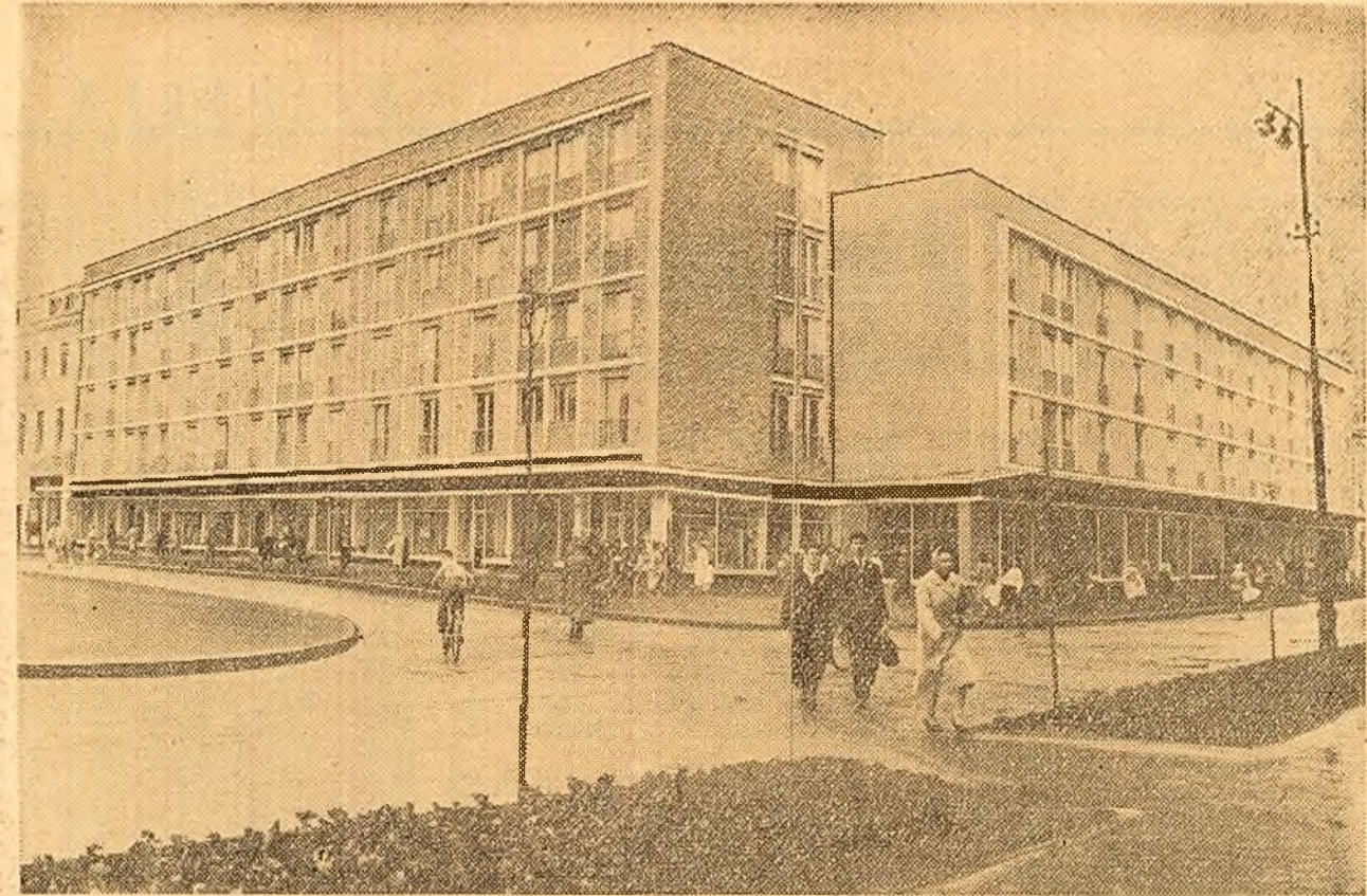
Din noul peisaj ploieștean: blocuri de locuințe construite în centrul orașului.