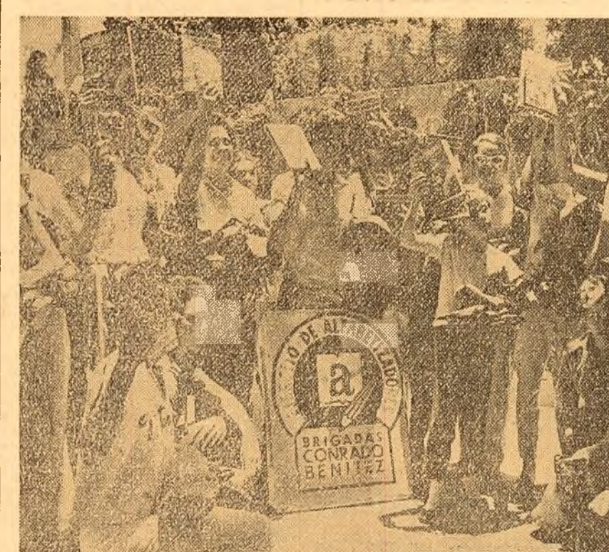
Mii de tineri din întreaga Cuba au răspuns la chemarea guvernului revoluționar încadrîndu-se în brigăzile de albatelizare. În clișeu cițiva membri ai vestitei brigăzi „CONRADO BENITZ” (nume al unui învîțător erou ucis de mercenarii imperialiști)

Corespondentul ziarului „NEW YORK TIMES” relatează că autoritățile din Alabama îi încurajează pe rasisti. La Washington, autoritățile americane nu ascund încurajarea în care se află ca urmare a răbufnirii noiului val de rasism. După cum transmite agenția U.P.I., secretarul de stat adjunct pentru problemele africane, Mennen Williams, a declarat la 23 mai că „violentele împotriva drepturilor egale nu pot decît să ne dăuneze în fața lumii întregi” subliniind că este îngrijorată de „efectele violențelor din Alabama în rîndurile popoarelor africane”. Senatorul Mike Mansfield a declarat la rîndul lui că violentele rasiste din Alabama „ne vor face să ne pierdem capul de rușine. Dacă noi nu putem să menținem ordinea în casa noastră — a adăugat Mansfield — cum vom reuși să o menținem în rîndurile aliaților și prietenilor noștri”.