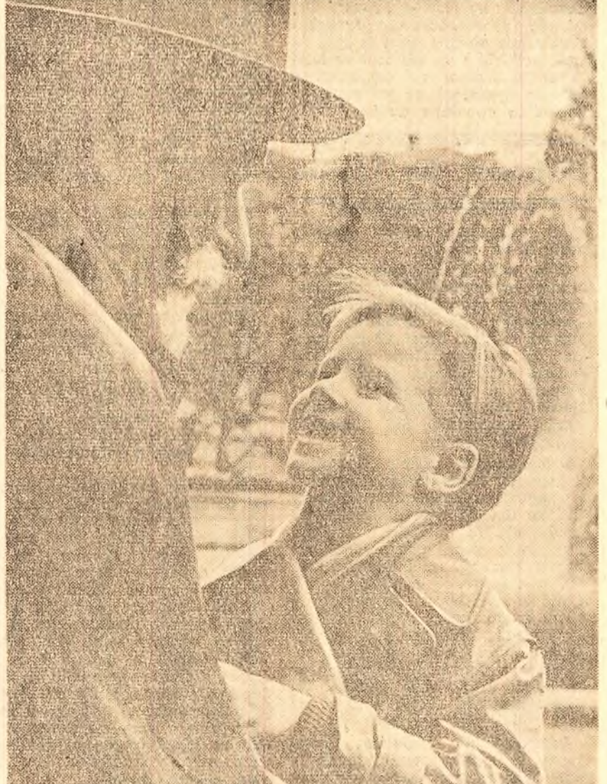
V. ȘUSTOV (Moscova) „Bunleul și nepoșelul” (Din expoziția de fotografii artistice „Septenul în acțiune”, de la Moscova).

„Oare militarii vor putea ajunge la înțelegere? — scrie în continuare ziarul. Ce loc le vor acorda ei civililor? Acestea sînt întrebările la dramele rezidă mai puțin în episodul în sine decît în situația generală pe care o scoate la lumină.”