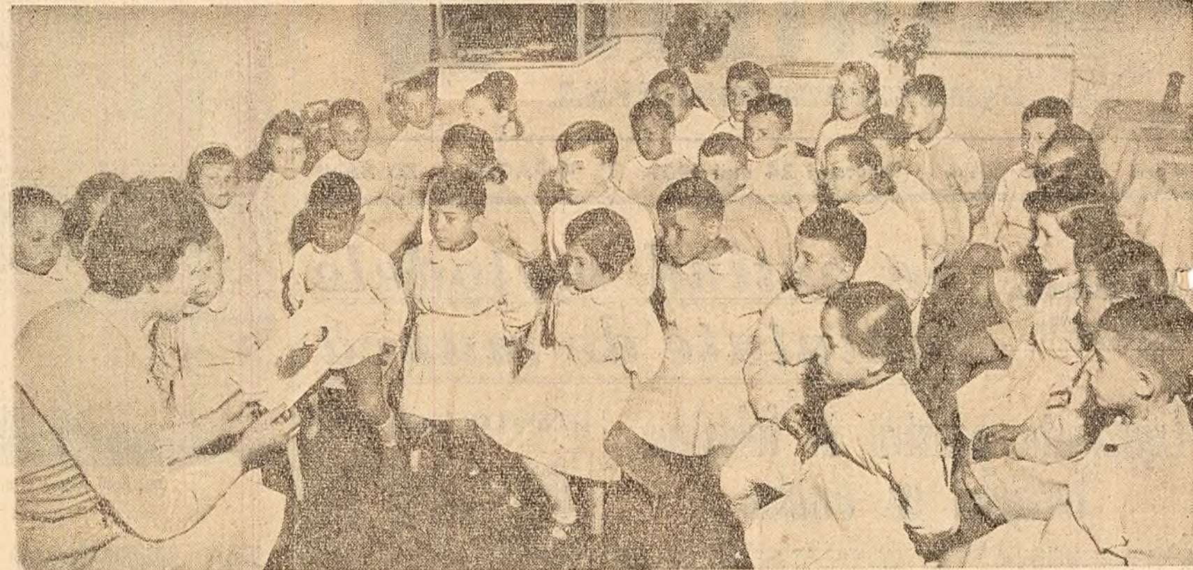
Liniește doplină, atenție încordată. Cum se va termina oare povestea? (O oră de povestiri la grădinița de copii a G.A.S.-Giarmata, raionul Timișoara).

CONSTANȚA — La 22 mai, la Comitetul regional de partid Dobrogea a avut loc o sesiune de birou, în care s-a analizat stadiul lucrărilor de întreținere a culturilor și pregătirile în vederea campaniei de recoltare. S-au luat măsuri ca răminerea în urmă de 6-7 zile la întrecerea culturilor (din cauza ploilor) să fie grabnic lichidată.