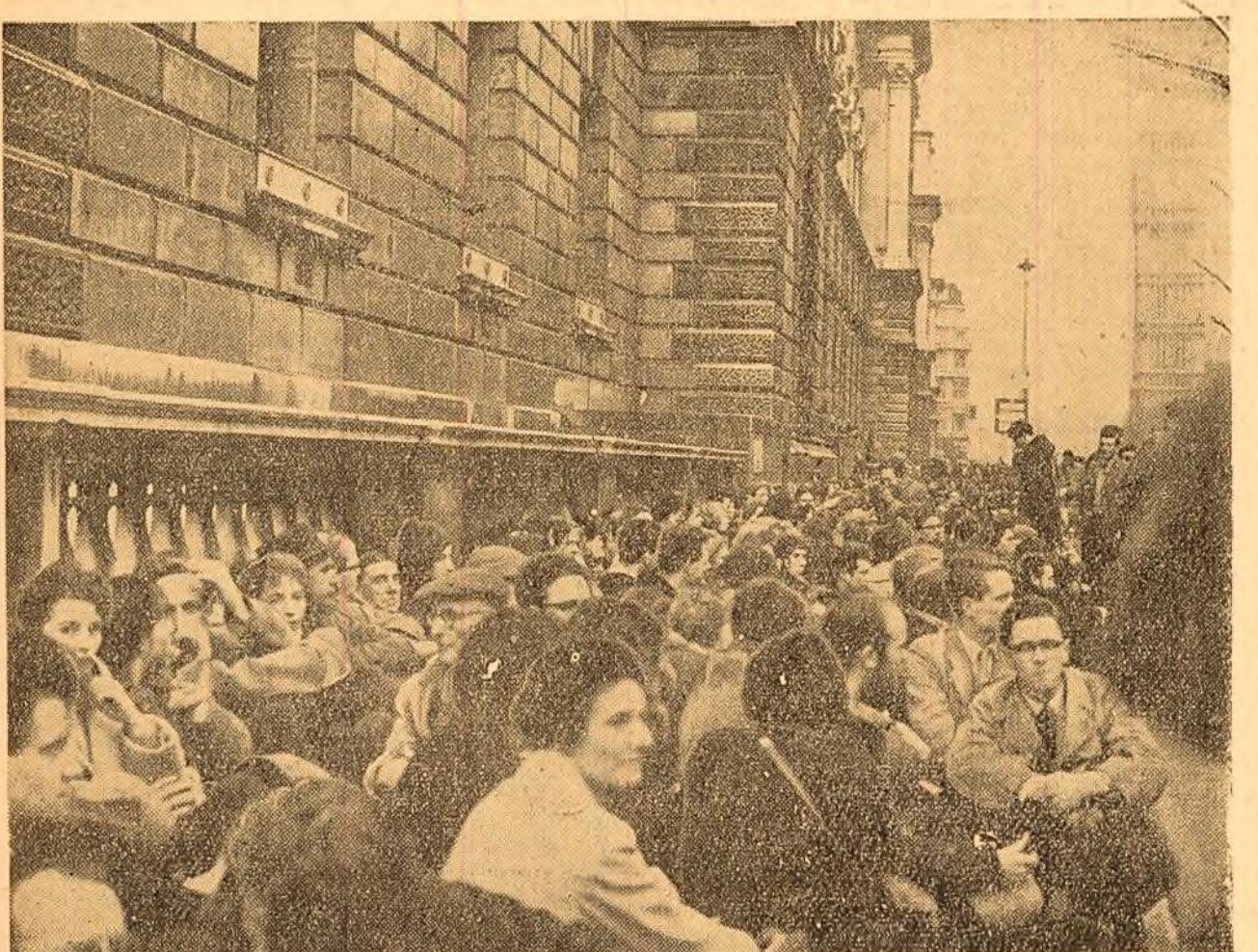
Una din marile demonstrații împotriva instalării bazei americane la Holy Loch. În clișeu: mii de cetățeni, așezați pe jos, la Londra, în fața Ministerului de Război blochează circulația.

porului congolez, sprijină cererea guvernului legal al acestei țări cu privire la convocarea Parlamentului congolez și consideră necesar ca reprezentanții O.N.U. și comandanții trupelor O.N.U. din Congo să ia măsuri eficiente pentru a asigura condițiile în vederea convocării ei mai grabnice la Parlamentul lui Kamina și să garanteze securitatea tuturor membrilor parlamentului în conformitate cu propunerea guvernului Republicii Congo. În răspunsurile la întrebările corespondenților, V. A. Zorin a subliniat că dacă se vor ivi piedici în ce privește asigurarea convocării Parlamentului la Kamina, Uniunea Sovietică va fi nevoită să ceară convocarea Consiliului de Securitate pentru a adopta o hotărîre corespunzătoare în această problemă. Referindu-se la situația din Angola, reprezentantul U.R.S.S. a declarat că întreaga omenire sprijină poporul Angolei în lupta sa de eliberare națională.