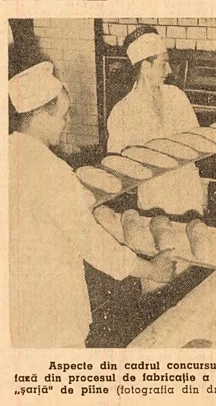
Aspecte din cadrul concursului de la întreprinderea de panificație „Pionierul”. Se execută ultima fază din procesul de fabricație a piinii — coacerea. (fotografia din stînga). Din cuplor a leșii o nouă „șarjă” de piine (fotografia din dreapta).

TURNU MĂGURELE (cosp. „Scinteia”). — În fiecare zi cu timp frumos membrii gospodăriei agricole colective „Flacăra” din comuna Lița, raionul T. Măgurele au muncit intens la întreținerea culturilor. Pe cele 220 ha. cultivate cu floarea-soarelui ei au început prășia treia. Totodată colectivității au prășit a doua oară suprafața de 60 ha. cultivată cu sfeclă de zahăr.