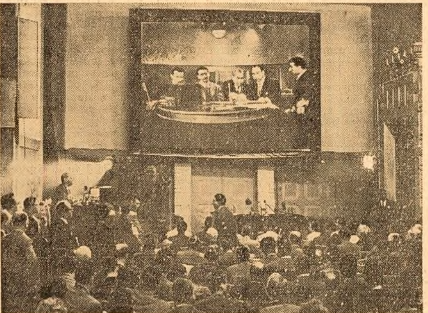
La Casa Presii din Geneva, ziariștii urmăresc conferința de presă televizată a delegației Republicii Algeria care se află la sediul ei din Bois d'Avault.