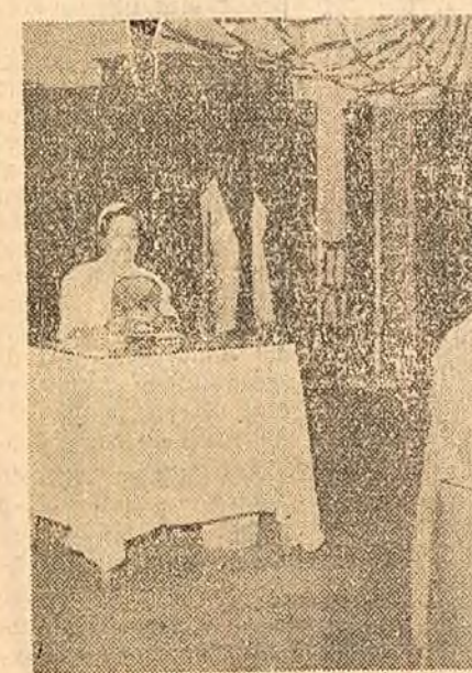
Concursul pentru îmbunătățirea calității pînii. În fotografie: o parte din membrii juriului. Citiți în pagina 5-a reportajul „De la fabrică... la jurii”.

Copii, tineretului, li se deschid larg toate porțile. Nici un om al muncii nu și mai pune astăzi îngrijorătoare problema de odinioară: ce va face copilul meu? va învăța carte sau nu? Așa cum a hotărât partidul, până în anii 1962-1963 nu va mai exista în țara noastră copil care să nu fi absolvit școala de 7 ani; și tot în această perioadă va începe trecerea treptată la învățământul general de 8 ani. Până în 1965 se vor mai construi 4.000 săli de clasă din orașe și centre muncitorești și circa 11.000 săli de clasă la sate.