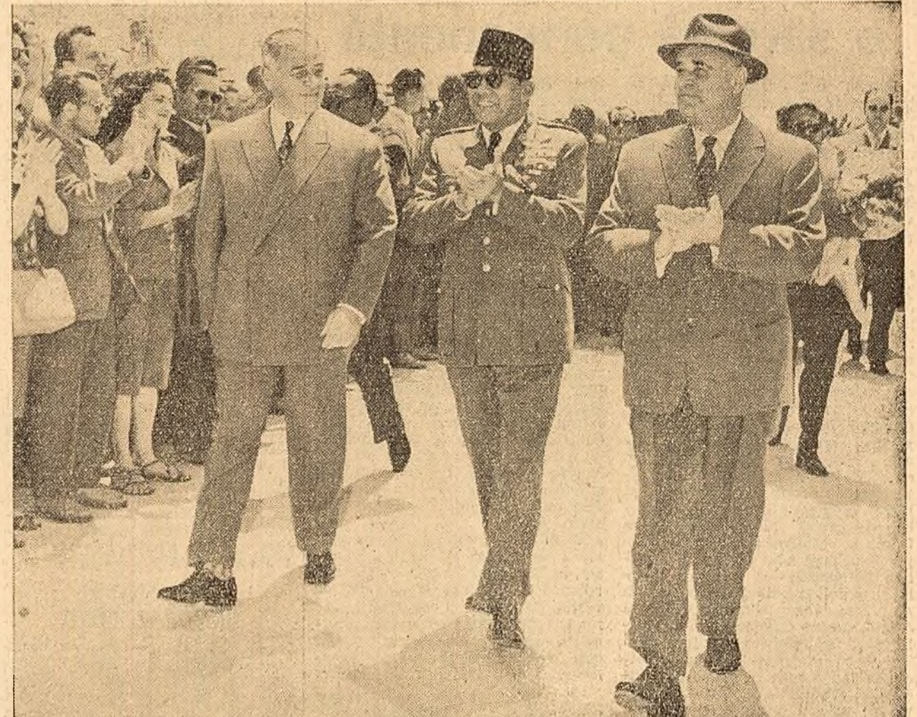
La sosire, pe aeroportul Otopeni