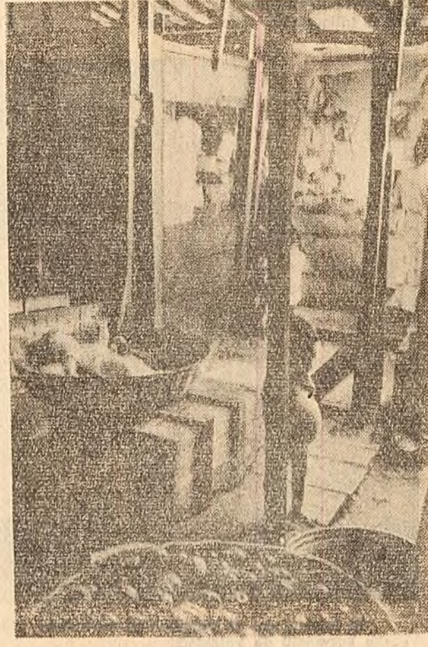
Într-o casă de țărani din Nicaragua

„Anul 1960 a fost un an greu pentru industria de automobile a țărilor vest-europene. Concedierea celor 3.000 de muncitori de la Uzina Renault - scrie ziarul elvețian „LA TRIBUNE DE GENEVE“ - nu a fost un caz izolat...“