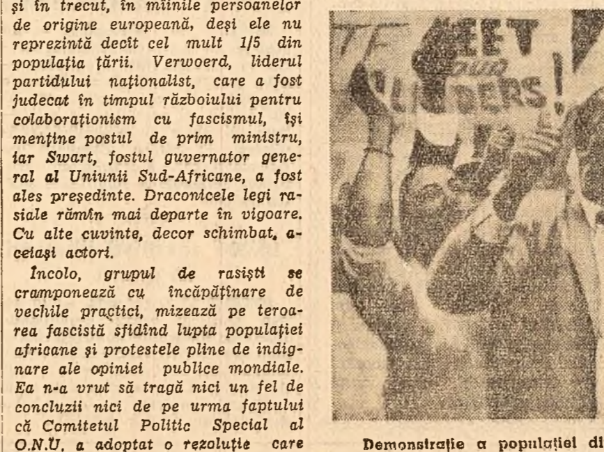
Demonstrație a populației din Pretoria (Uniunea Sud-Africană) împotriva guvernului rasist Verwoerd.