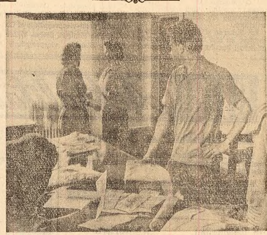
La fabrica de tricotate „Bela Brnelner” din Capitală. (Se face proba unor noi modele de tricotate, înalte ca acestea să fie introduse în producția de serie).