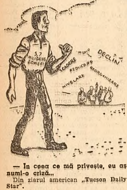
- În cea ce mă privește, eu am numai o criză... Din ziarul american „Tucson Daily Star“.