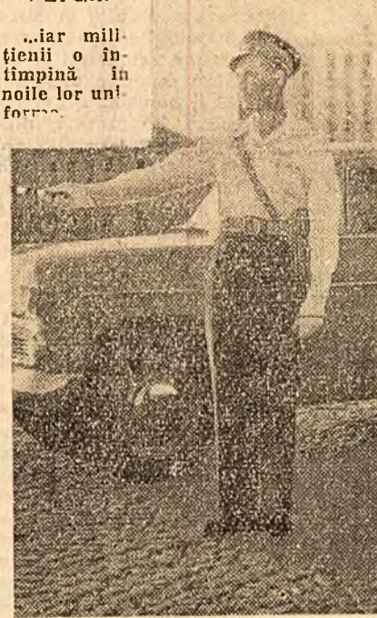
...iar mili-tienii o în-timpină în noile lor un-forme.