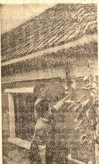
Comana Comana, raionul Negru Vodă, a fost de curind electrificată.

La fabrica de hirtie „1 Mai” din Petrești, regiunea Hunedoara, a avut loc recent adunarea generală a organizației de bază pentru darea de seamă pe perioada de la alegeri până în prezent.