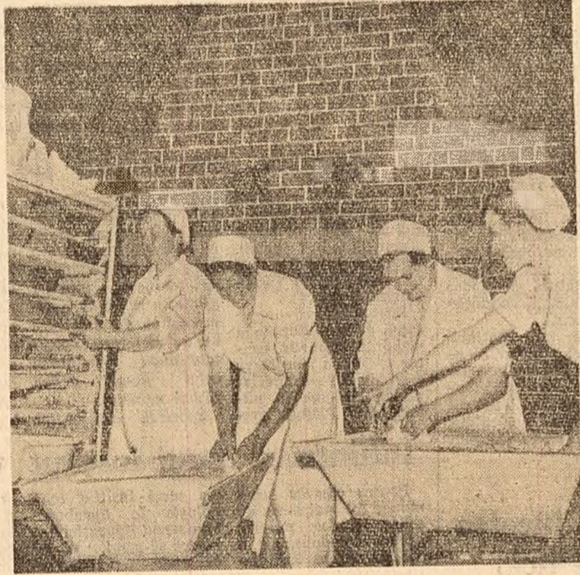
Una dintre echipele de gospodine, pregătind aluatul pentru pîine.