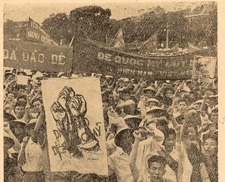
O mare demonstrație — la care au participat 300.000 de cetățeni — a avut loc recent la Hanoi, capitala R.D. Vietnam, împotriva polițiilor tero-riste și agresive a regimului lui Ngo Dinh Diem, marioneta polițiilor imperialiste din S.E.A.T.O.

Toți sînt uimiți de această situație, scrie ziarul „Le Monde”. Ziarul subliniază că participarea soldaților algerieni la ciocnirile cu poliția constituie „un moment complet nou”. Evenimentele din noaptea trecută și urmările lor, scrie ziarul „L’Humanité”, demonstrează încă o dată necesitatea de a se pune capăt războiului din Algeria pe calea discutației sincere a dreptului poporului algerian la autodeterminare.