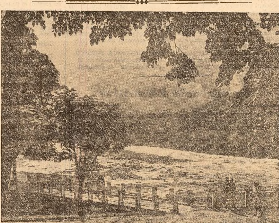
Frumusețile patriei: Oțelul la Căciulata.