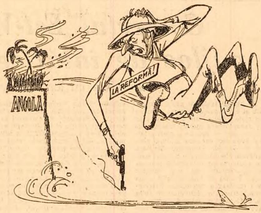
Poporul angolez luptă pentru o singură reformă. (Desen de EUGEN TARU)

Salazar promite ipocrit reforme angolezilor.