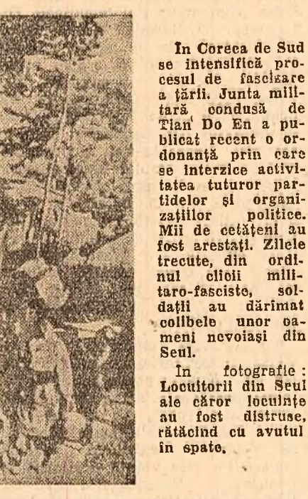
In Coreea de Sud se intensifică procesul de înlocuire a țării. Junta militară condusă de Tian Do En a publicat recent o ordonanță prin care se interzice activitatea tuturor partidelor și organizațiilor politice. Mii de cetățeni au fost arestați. Zilele trecute, din ordinul elului militar-fascist, soldații au dărâmat colibe sau oameni nevoiași din Seul.

Lordul Boyd Orr arată că o mare însemnătate pentru pace și implicat pentru dezvoltarea comerțului ar avea realizarea dezarmării generale și totale. „În prezent - spune el - se cheamă anular 40 miliarde lire sterline pentru înarmare. Dacă acești bani ar fi folosiți pentru a construi case, a ridica nivelul de trai, cred că s-ar putea face multe pentru ca în lume să nu mai existe sărăcie,