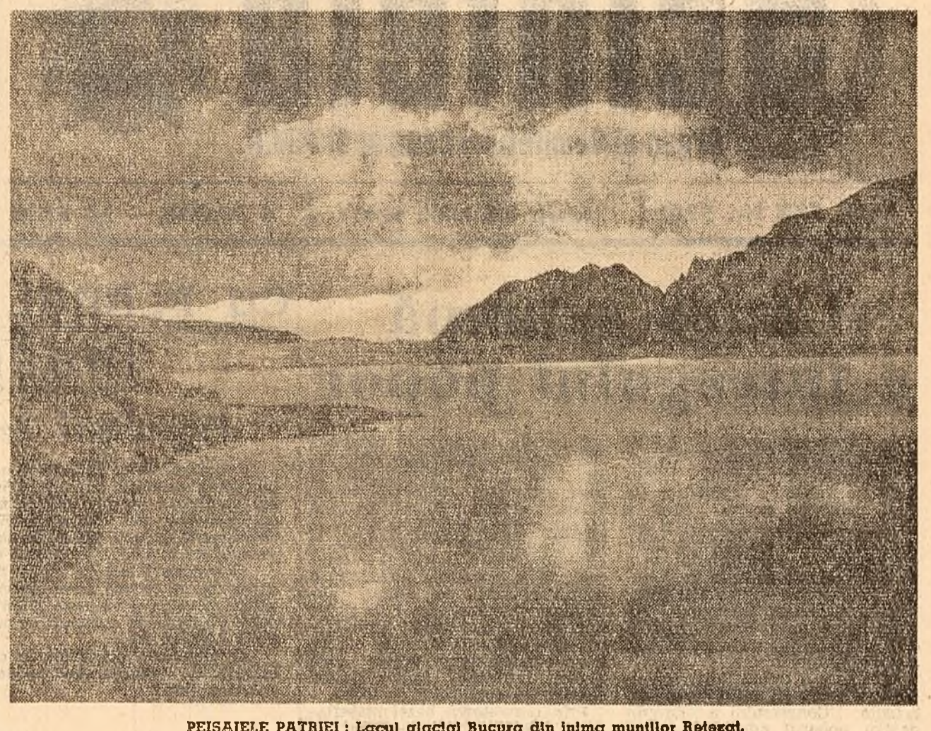
PEISAJELE PATRIEI: Lacul glacial Bucura din inima munților Retezat.

În primele patru luni ale anului, colectivele unităților din D.R.N.C. Dobrogea au realizat economii peste plan, la prețul de cost, în valoarea de 6.672.000 lei.