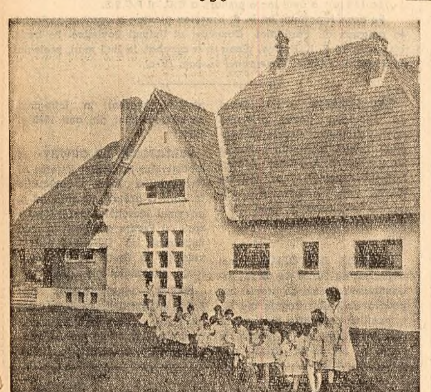
In curtea grădiniței de copii cu program săptămînală a gospodăriei agricole de stat Corcova, regiunea Oltenia.

După cum am mai spus, discuțiile n-au ocolit lipsurile. Darea de seamă, precum și numeroși vorbitori, au arătat că realizările nu sînt încă pe măsura posibilităților. Tovarășul Gheorghe Dobre și alții au arătat că nu toate organizațiile de bază s-au ocupat cu răspunderea cuvenită de problemele calității. Organizațiile de bază din cadrul secției a IV-a de mecanică, spre exemplu, pun pe seama unor cauze „obiective” calitatea slabă a unor reparații și nu văd că principala cauză o constituie lipsurile în organizarea muncii, nefolosirea integrală a timpului de lucru, munca politică slabă.