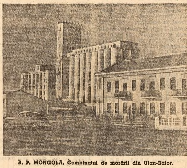
R. P. MONGOLA. Combinatul de morți din Ulan-Bator.