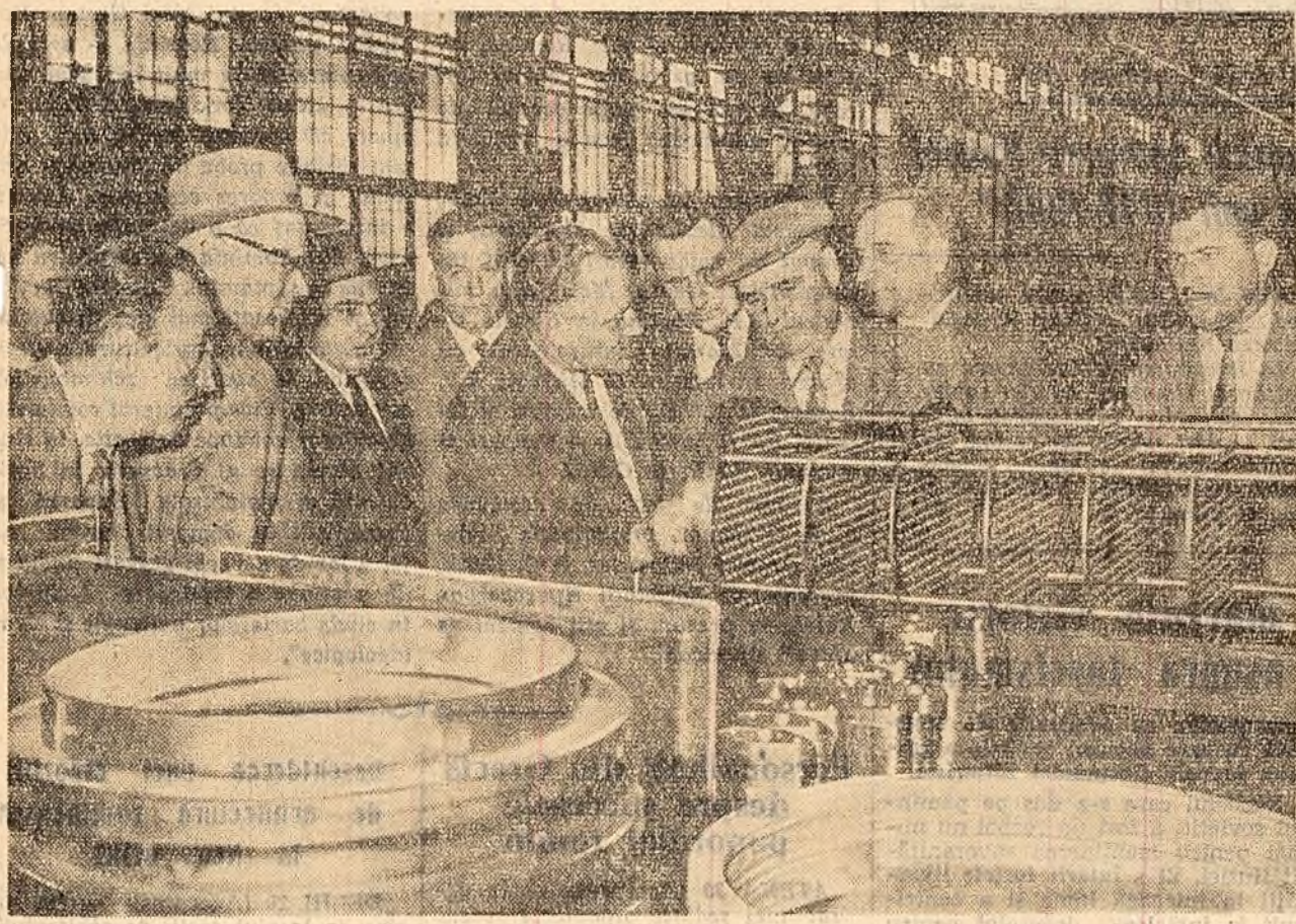
In hale fabricii de motoare pentru locomotive Diesel electrice