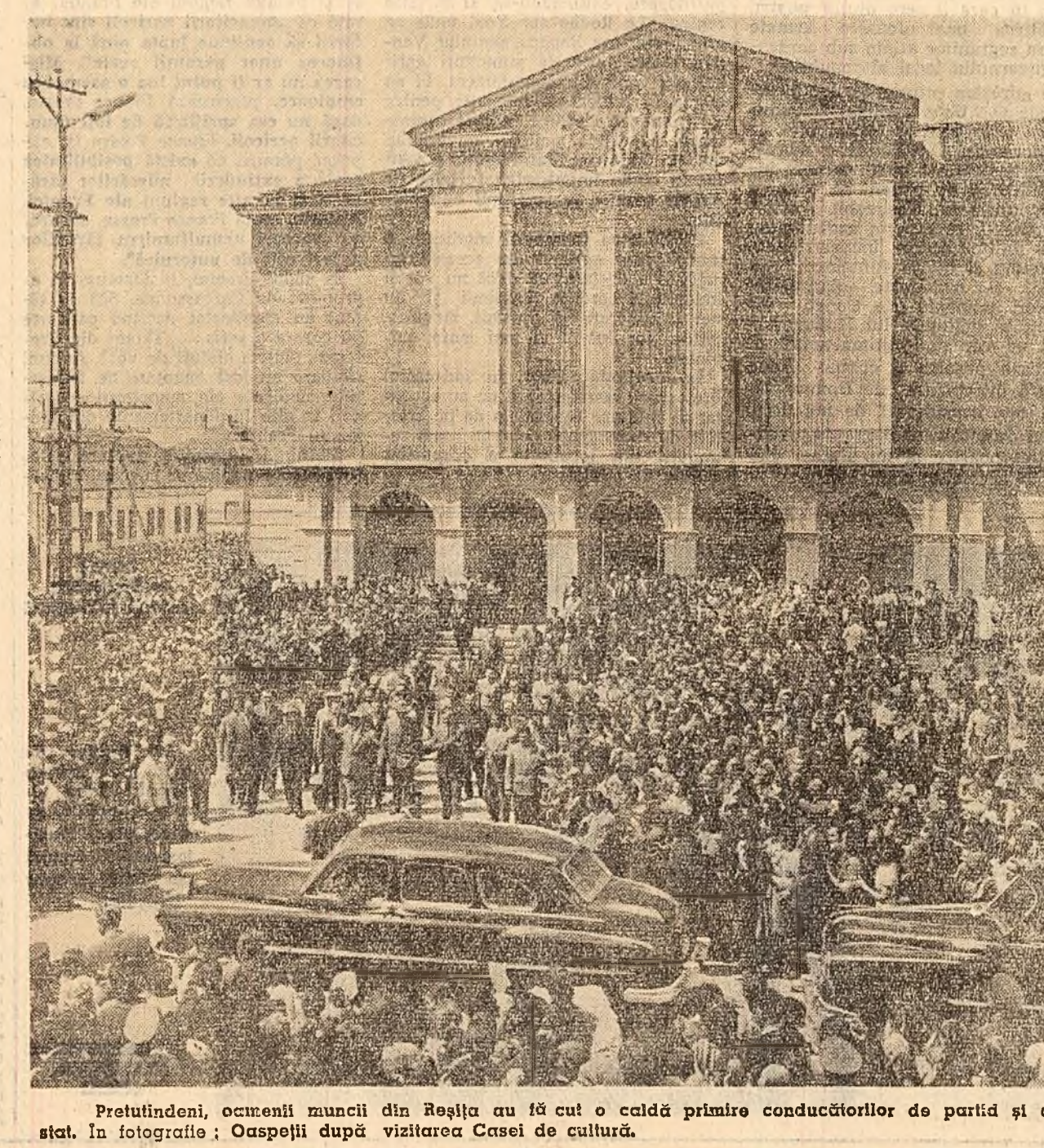
Prețutindeni, oamenii muncii din Reșița au făcut o caldă primire conducătorilor de partid și de stat. În fotografie: Oaspeții după vizitarea Casei de cultură.