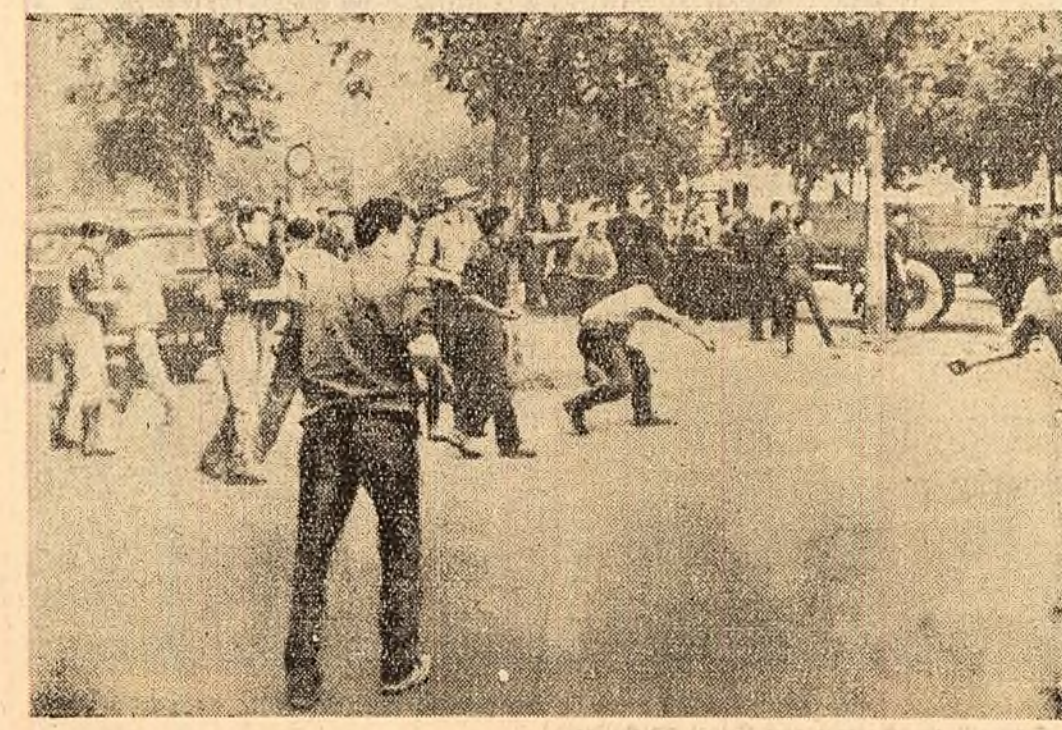
La Pontivy au avut loc violente ciocniri între țărani și poliție. În fotografie: Manifestanții aruncă cu pietre asupra poliștilor.

Kuweitul este un principat situat în peninsula Arabică pe coasta de nord-vest a golfului Persic. Pe un teritoriu de circa 21.000 de km. pătrați trăiește o populație de peste 170.000 de locuitori în majoritate arabi. În Kuweit se află unele din cele mai mari zăcăminturi de petrol din lumea cunoscută. Descoperite relativ recent, aceste zăcăminturi au fost explorate într-un ritm crescînd, cantitatea de petrol extrasă anul trecut ajungînd la 80 milioane de tone. Petrolul Kuweitului nu constituie însă bogăția poporului acestei țări. El este stăpînit de monopolurile petroliere americane și engleze.