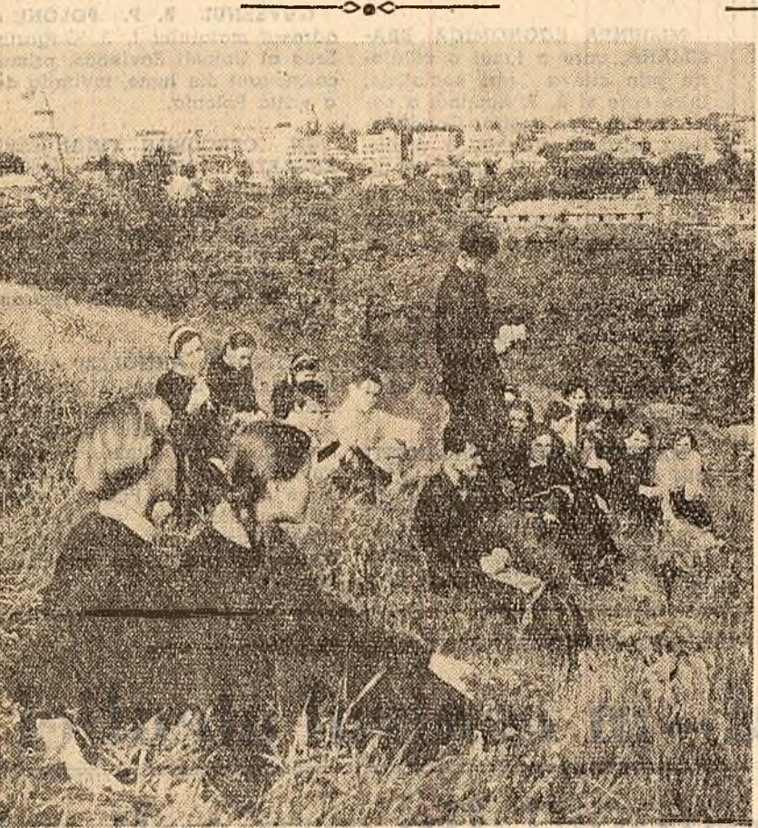
Zile de vacanță. Minunat prilej pentru elevii școlii medii „Ștefan cel Mare” din Suceava...