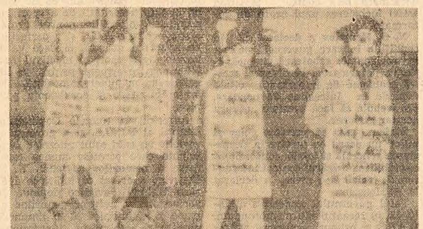
Aspect de la greva marinarilor din lăta comercială a S.U.A. Pichel format de membrii sindicatului național al marinarilor pe cheiul Brooklin din New York.

NEW YORK 21 (Agerpres). — Agenția Reuter anunță că la 21 iunie 25.000 de docheri din New York au început greva de 24 de ore în semn de solidaritate cu cei 85.000 de marinari care de la 16 iunie sînt în grevă. În urma grevei docherilor, potrivit declarațiilor autorităților portului New York, întreaga activitate, atât de pe navele americane cît și de pe cele străine, va înceta. Multe uzine și fabrici și-au încetat activitatea în urma faptului că muncitorii acestora s-au solidarizat cu greviștii, refuzînd să execute or-