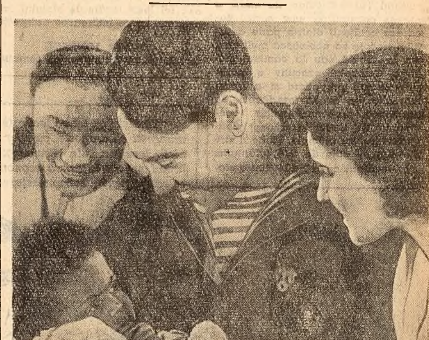
Răspunzînd cerințelor exprimate de iubitorii filmului de a revedeia marile opere clasice ale cinematografului sovietic, Direcția Reșetei Cinematografice și a Distribuției Filmelor a programat pe ecrane unele din aceste creații de nouă. Astfel, nu de mult am avut prilejul să vedem două dintre celebritățile muzicale ale marelui regizor sovietic Grigori Alexandrov: „Toată lumea rîde, cîntă și dansează” și „Volga, Volga”. În cadrul acestor două retrospectivă, începînd de mîine, la cinematograful „Magheru” și „Lumina” rulează o altă renumită comedie muzicală — „Cercul”, creată în 1936. Protagonistul filmului este și de data aceasta Liubov Orlova și muzica este compusă de I. Duncavski. În fotografie: o scenă din filmul „Cercul”.

Bienala de artă populară BRAȘOV (coresp. „Scinteia”). — Zilele acestea la Brașov, în sala Casei Armatei, s-a deschis cea de-a 11-a expoziție biennială de artă populară — faza regională. Expoziția cuprinde peste 500 de exponate de o rară frumusețe: cusături cu motive naționale, chimbre, pieptare, țoțe, cioplitori în lemn, lucrări de ceramice etc., selecționate din peste 6.000 de lucrări ale creatorilor de artă populară din regiune, care au fost expuse la cele 8 expoziții raionale. Vizitatorii expoziției — iubitori de artă — s-au înființat aci cu peste 150 de creatori din regiunea Brașov, invitați la un simpozion organizat de Casa regională a creației populare. A. Br.