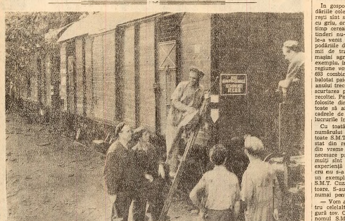
„Bun pentru cereale 1961”! Este cel de-al 108-lea vagon pentru transportul cerealelor realizat peste plan, anul acesta, de către colectivul Atelierelor C.F.B. „Constantin David” din București.