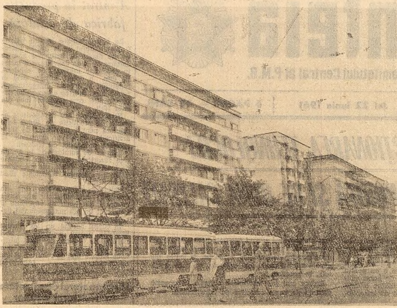
Din noul peisaj al Capitalei: blocurile de locuințe din bulevardul Ilie Pîntile nr. 23-27.

Pînă în prezent în regiunea Brașov au fost electrificate un număr de 278 sate și comune. Pînă la sfîrșitul acestui an numărul localităților rurale electrificate va ajunge la 300.