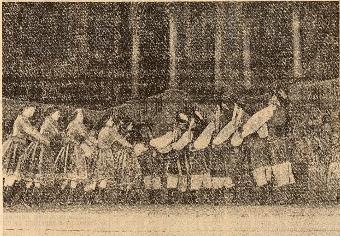
Scenă din spectacolul ansamblului polonez „Slask”

Pe șantierele combinatului de celuloză și hirtie și al combinatului