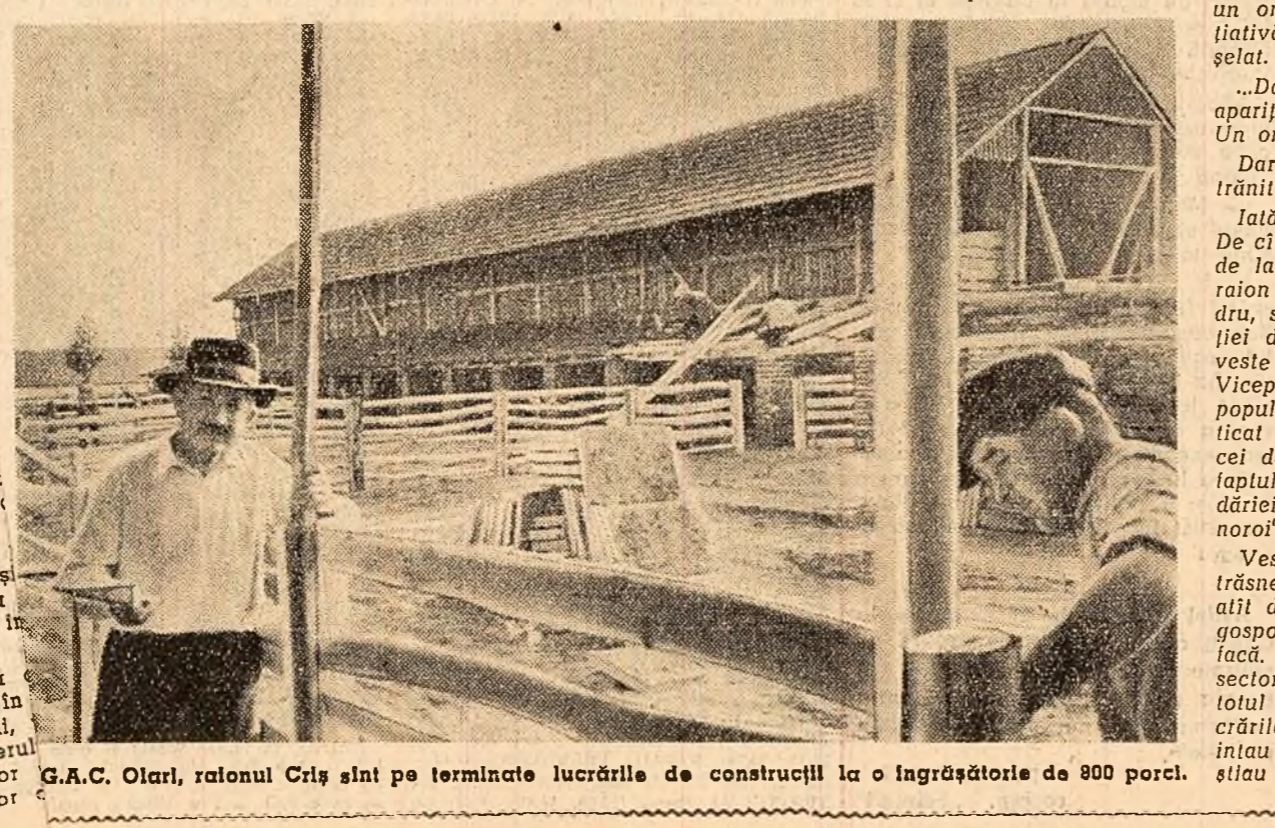
G.A.C. Olari, raionul Crîș sînt pe termînată lucrările de construcții la o îngrășătoare de 800 porci.

Asadar, colectivisti din Olari lucrează cu însușire pentru dezvoltarea sectorului zootehnic. Cît privește producția de lapte marlă, și-a produs ca și la producția de carne să-și ajungă vecinii. Asemenea realizări au făcut posibil ca din sectorul zootehnic să realizeze un venit bănesc de aproape un milion de lei. Cum rămîne totuși cu critica? — Să facem o scurtă vi-