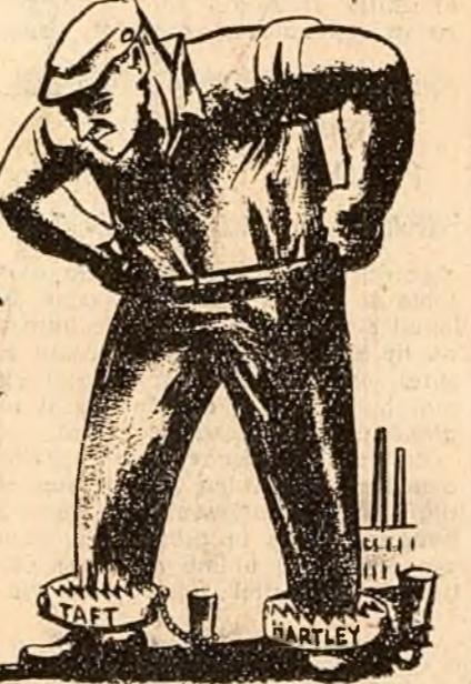
(Ilustrațiile din text sînt reproduse după broșura editată de P.C. din S.U.A.)