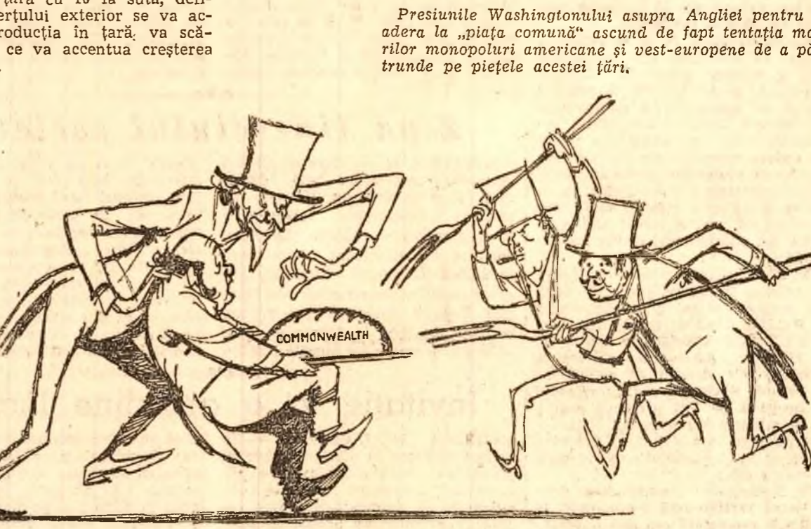
— Ințelege, dragă John, piața e comună! (Desen de EUGEN TARU)