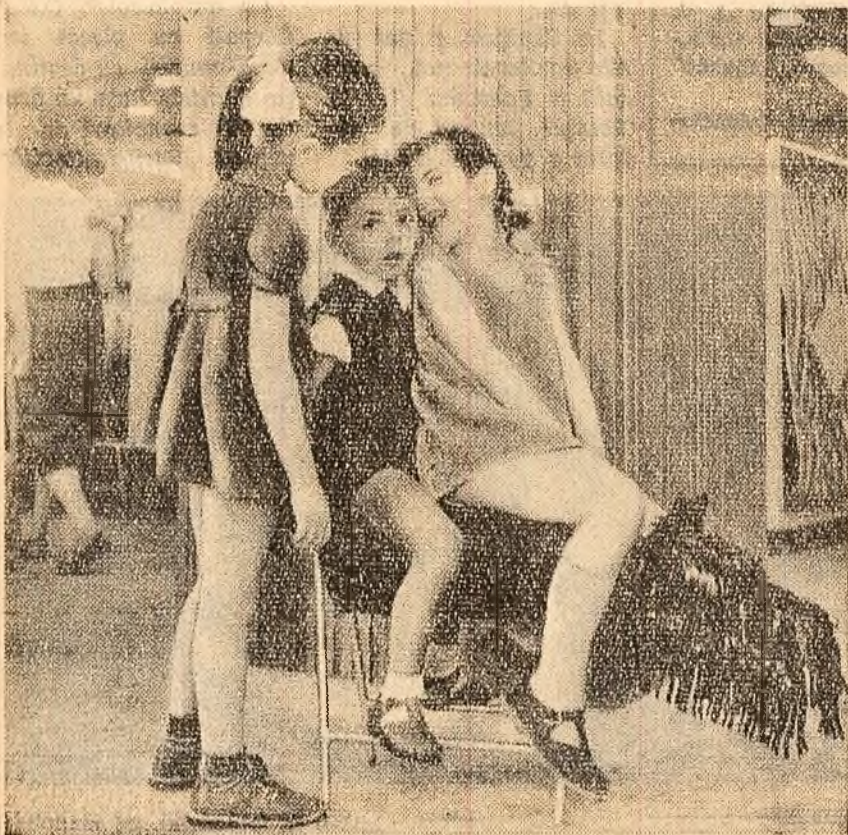
Un secret...

În această lucrare, autorii — P. Tomoroga, Gh. Tușa, I. Turca — prezintă pe scurt măsurile agroteh-