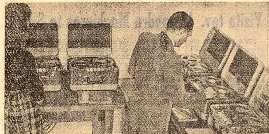
Secția muzicală a Bibliotecii Centrale de Stat posedă o bogată colecție de discuri și benzi de magnetofon. Dintr-un studio special (fotografia de sus) sînt transmise în sala de audii la cască lucrările muzicale cerute de ascultătorii (fotografia de jos).