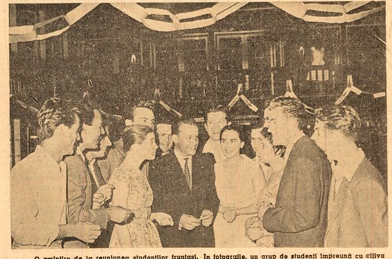
O amintire de la reuniunea studenților fruntași. În fotografie, un grup de studenți împreună cu cîțiva tineri muncitori invitați.