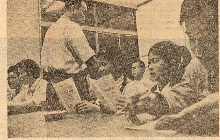
JAPONIA. Din ce în ce mai mulți japonezi sînt dornici să învețe limba rusă. În fotografie: La o școală de limba rusă din localitatea Tsuruga.