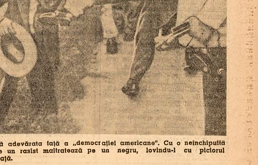
Ită adevărată față de „democrația americană”. Cu o neînchipuită cruzime un rasist maltratează pe un negru, lovindu-l cu piciorul peste față.