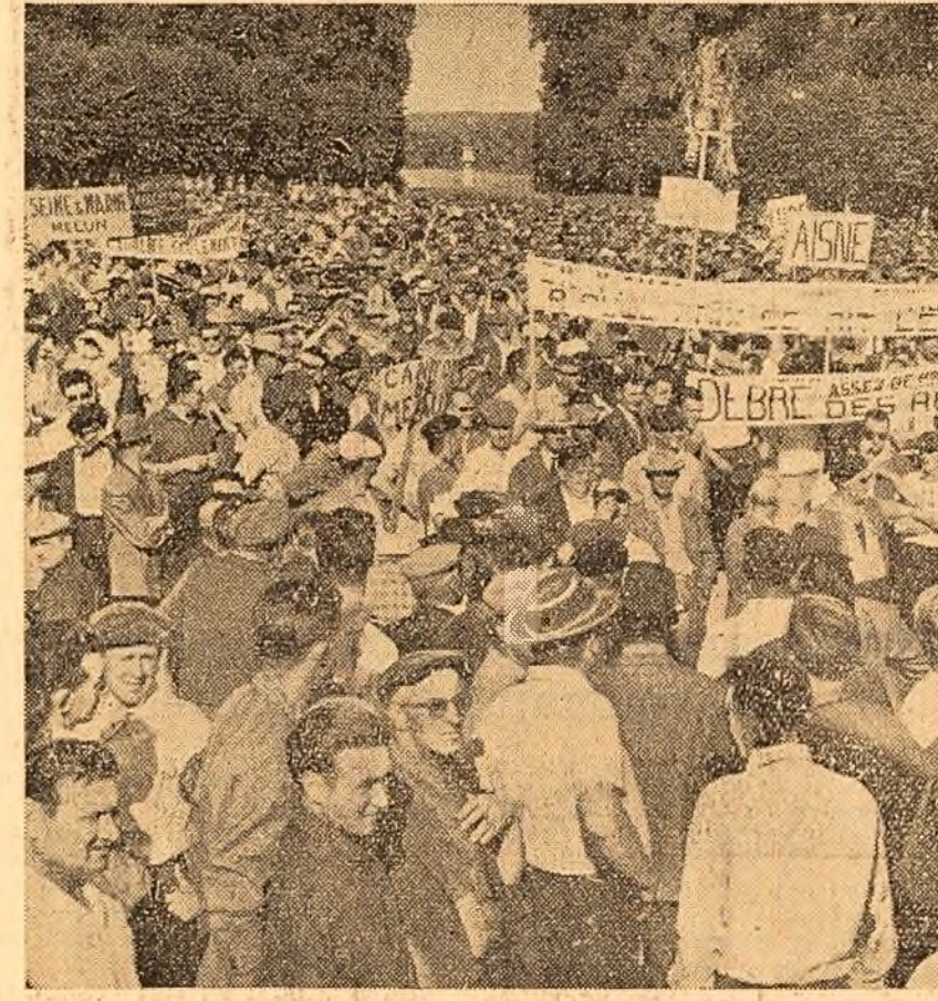
În aceste zile, în numeroase localități din Franța au loc mitinguri și manifestații ale țăranilor.

„U-2” zboară din nou” Dezvăluirile presei occidentale în legătură cu zborurile provocatoare ale avioanelor americane de spionaj