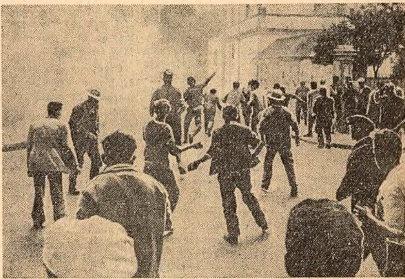
Răstosă a țăranilor la încercarea poliștilor de a-l împraștia cu aju- torul gazelor lacrimogene.

De 15 zile în fiecare dimineață ziarul aduc francezilor imaginea orașelor mai mari sau mai mici din diferite colțuri ale țării, cu străzile blocate de tractoare, iar pînă noaptea trîznii, radioul îi informează că manifestațiile țărănești cuprind alte și alte regiuni.