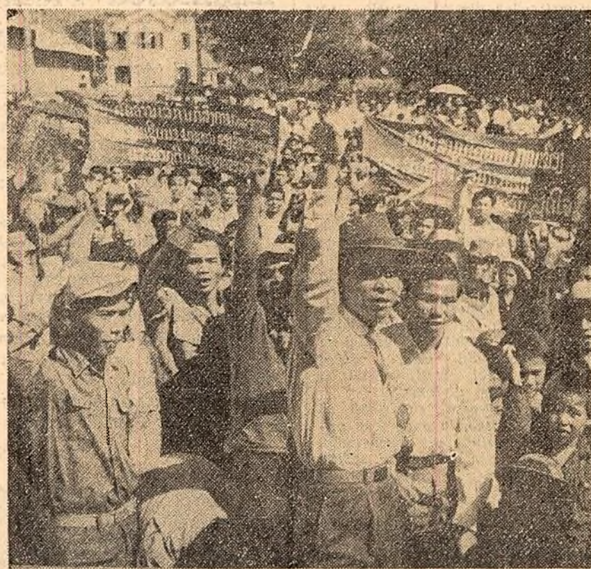
Mai mult de 3.500 persoane din Xieng Kuang și împrejurimii s-au adunat să protesteze împotriva uneltor imperialiste de sabotare a conferinței de la Geneva și a tratativelor de la Na Mon.

Într-una din ultimele mele cuvîntări — a subliniat Folsena — m-am referit la programul politic publicat la 8 mai la Xieng Kuang de către guvernul legal condus de prințul Savanna Fumma. Acest program este cuprins aproape în întregime în comunicatul comun al celor trei prinți. Acest fapt demonstrează clar că guvernul prințului Savanna Fumma este singurul guvern care corespunde năzuințelor și intereselor poporului laotian și că, de aceea, după cum