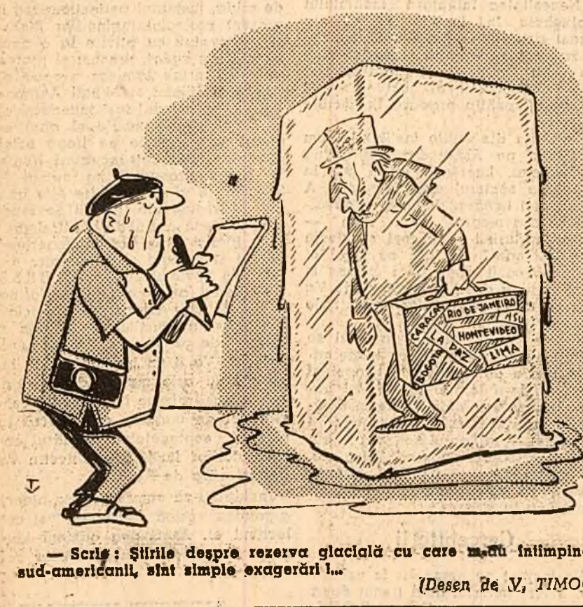
— Scriș: Știrile despre rezerva glacială cu care mădu înfîlmpinat sud-americanii, sînt simple exagerări!.. (Desen de V. TIMOC)