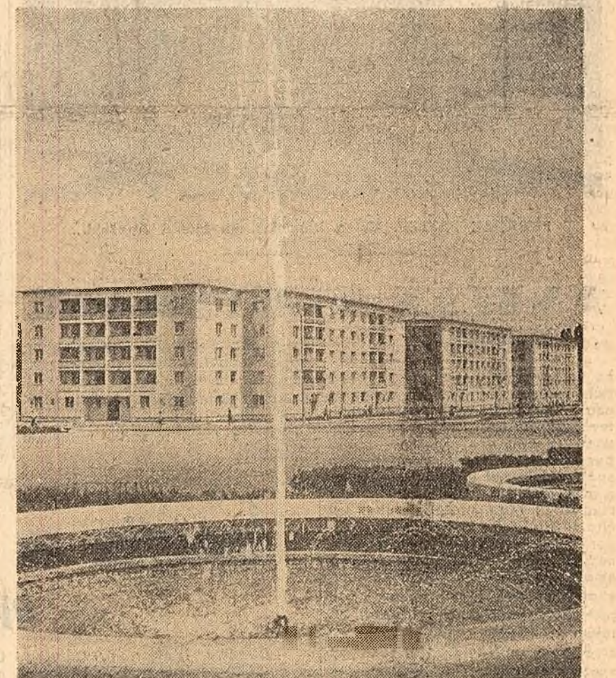
Pe bulevardul Suvorov din Capitală, în fața Academiei Militare.