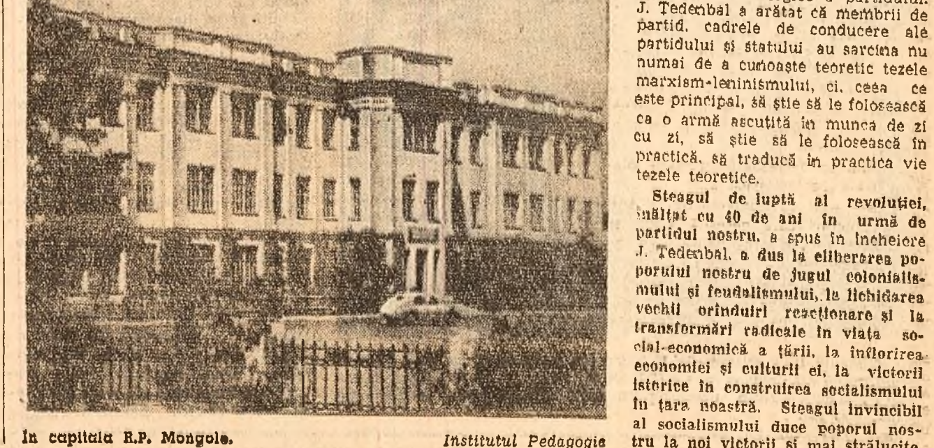
In capitala R.P. Mongole. Institutul Pedagogic