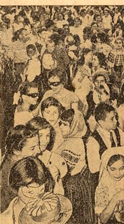
Aspect de la carnavalul pionierilor din Capitală

Spre seară a început carnavala pionierilor.