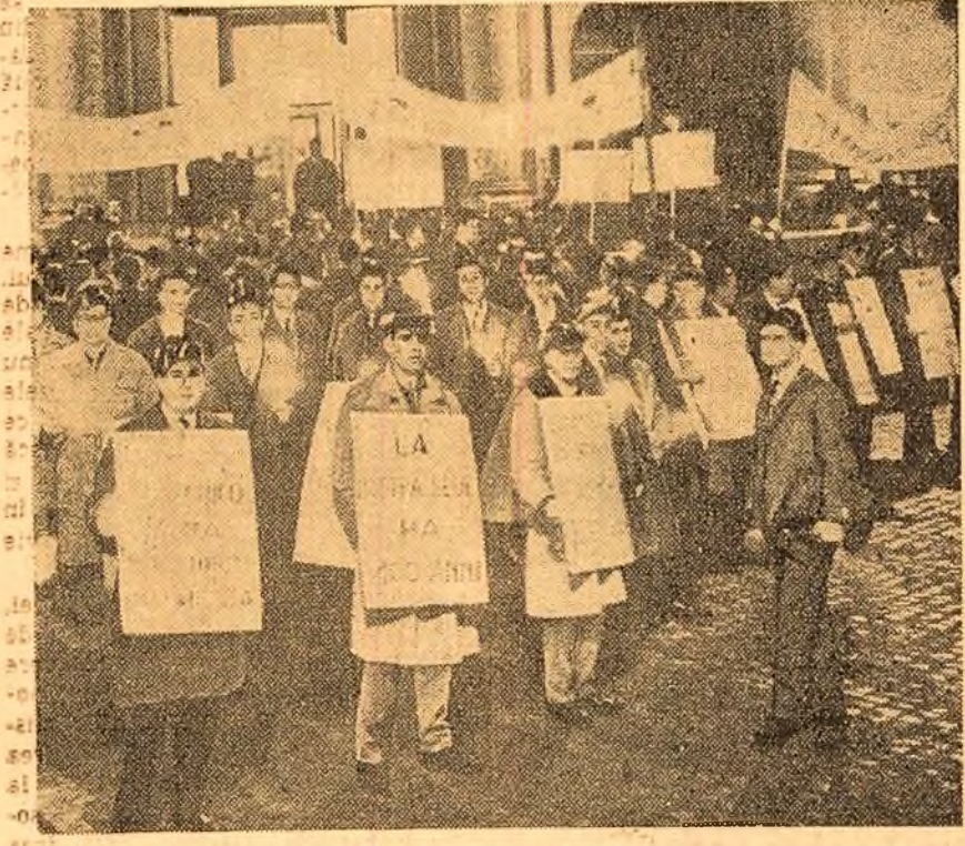
Studenții Universității din Palermo au făcut un drum lung pînă la Roma, unde au demonstrat pe străzile orașului, „Vrem o școală democratică“, „Statul italian acordă prea mică atenție școlii“ și scrie pe pancartele lor.