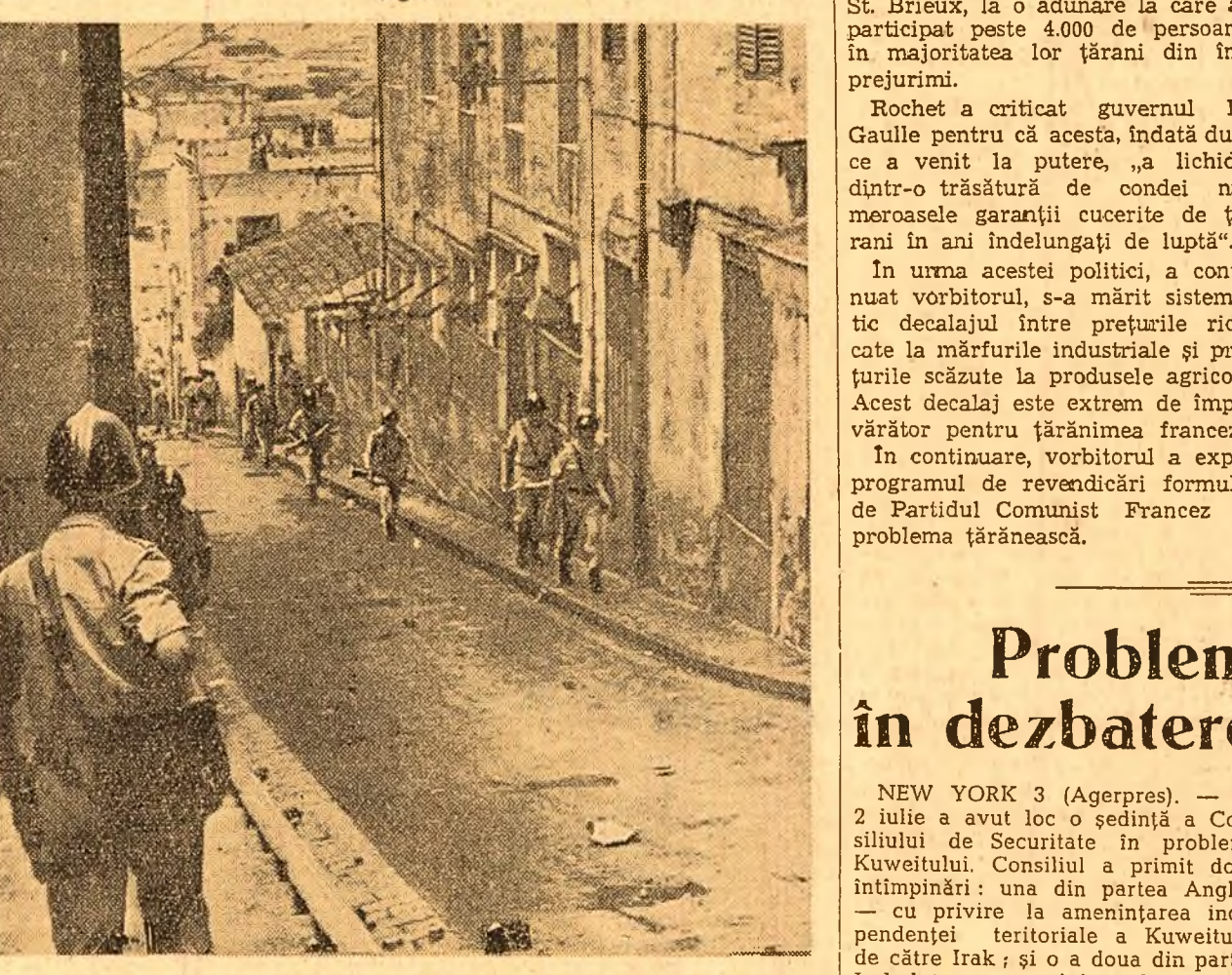
La Alger au avut loc zilele trecute numeroase ciocniri singeroase între populație și trupe franceze. În fotografie: polițiști și jandarmi francezi merg să atace pe demonstrații algerieni.

să se renunțe la planurile de staționare în Anglia a trupelor vest-germane, precum și la politica războiului rece și a cursei înarmării. În scrisoare se cere, de asemenea, începerea cit mai grabnică a tratatelor pașnice în toate problemele litigioase, inclusiv problema Berlinului occidental.