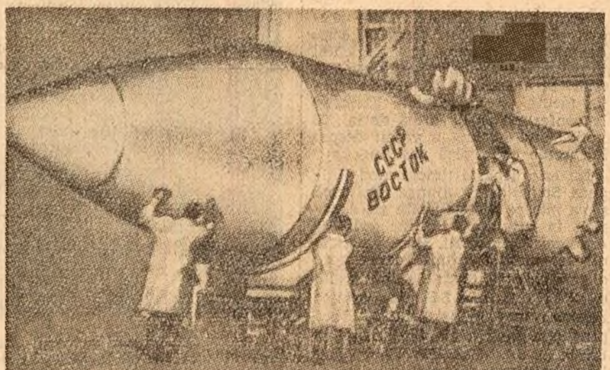
Scenă din filmul documentar „Primul raid către stele”, reprezentând asamblarea navei cosmice „Vostok” (Rășoritul).