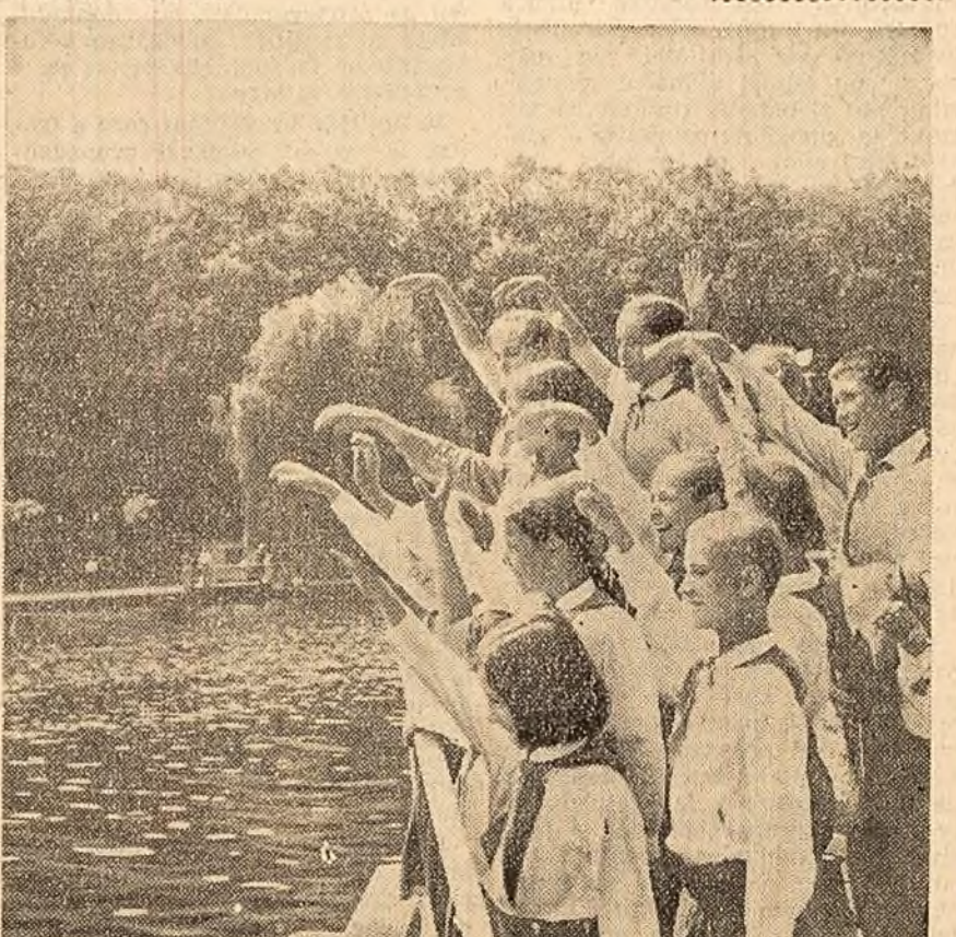
În timpul excursiei, o plimbare pe lac...