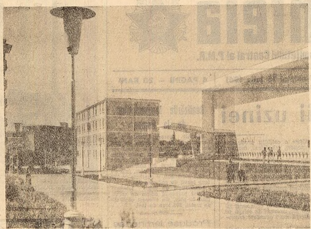
Aspect din Mangalia însoțită. În dreapta — clădirea casei de cultură.

În lumina experienței acumulate, apare limpede necesitatea ca în perioada actuală, cînd se iau măsuri de pregătire a noului an de învățămînt, să se acorde cea mai mare atenție nivelului de pregătire a propagandistilor, de acestia depinzînd în cea mai mare măsură calitatea învățămîntului. A asigura o înaltă calitate a învățămîntului este cu atît mai important cu cît complexitatea sarcinilor pe care le ridică dezvoltarea construcției socialiste, participarea tot mai activă a masei la activitatea obștească fac să sporască rolul și însemnătatea muncii ideologice. Viața a arătat că un propagandist poate fi numai acela care are solide cunoștințe în domeniul teoriei marxist-leniniste, are un nivel de pregătire corespunzător cercului sau cursului pe care este chemat să-l conducă. Propagandistului i se cer nu mu-