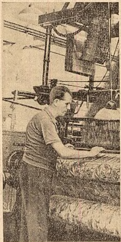
Întreprinderea textilă „Donca Sîmo” (unitatea II-a) din Capitală. Lucrind la o mașină de țesut stofă plugată de mobilă, muncitorii lile Bădescu realizează produse de calitate superioară.

PITEȘTI (coresp. „Știința”). — Muncitorii și tehnicienii de la Întreprinderea forestieră Sîlpeni au produs în primele 13 zile ale lunii iulie, peste plan, importante cantități de produse lemnoase: 2000 garnituri butoaie, 1000 bucăți traverse de țevă, 800 m.c. lemn de țevă pentru diferite produse. La obținerea acestor rezultate, o contribuție de seamă a dat colectivul sectorului de exploatare Șeșu și cel al sectorului de industrializare.