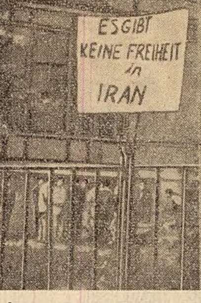
În fața ambasadei Iranului din Viena studenții iranieni demonstrează cu lozinci pe care se poate citi: „În Iran nu există libertate”.

Caracterul militarist, agresiv al acestei vizite a reieșit chiar dintr-o declarație a lui Strauss, care nu s-a jenant să declare corespondenților că a venit în S.U.A. spre a obține pentru Germania occidentală noi livrări de armament american în valoare de