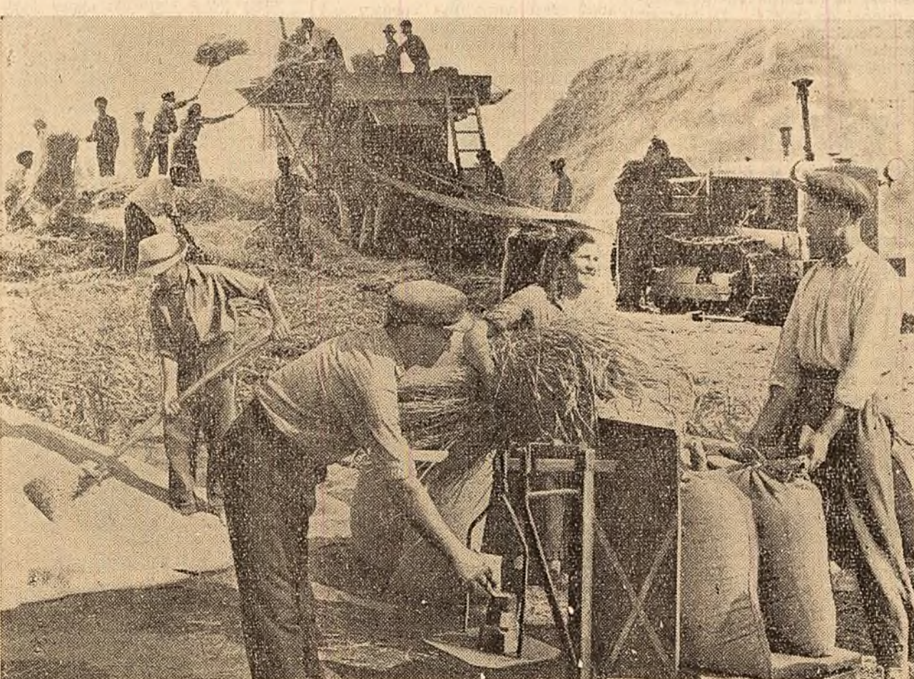
La gospodăria colectivă „Steagul Roșu” din Mojișel, raionul Calafat, treierîșul grîului de pe cele 540 ha. cultivate este în tolt. La cele patru arii din gospodărie se treieră zilnic cantități însemnate de grîu. În fotografie, aspect din timpul lucrului la arii nr. 1.

nu se poate face în ritm cu secerîșul. Amenajarea ariilor a întîrziat și din cauză că S.M.T.-Cimpia Turzii n-a reparat la vreme toate batozele și a tărgănat scoaterea la arii a celor reparate. Comitetul raional de partid și comitetul executiv al sfatului popular raional trebuie să ia măsuri pentru organizarea ariilor și buna desfășurare a treierîșului.