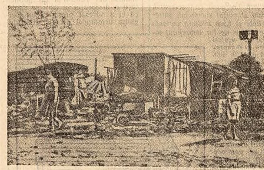
Centura muncitorească a capitalei Argentinei, Buenos Aires — un gir neîntrerupt de cocleaze...

HAVANA 21 (Agerpres). — Cuba se pregătește în vederea sărbătorii sale naționale — cea de-a 8-a aniversare a eroicului asalt al forțelor reșei Moncada, de la 26 iulie 1953. În țară domțește un puternic avînt în muncă. În fabrici și uzine, în cooperativele agricole și gospodăriile agricole de stat, în transporturi și pe șantierele de construcție se desfășoară întrecerea pentru îndeplinirea înainte de termen a angajamentelor luate în cinstea aniversării revoluției. Cei aproximativ 70.000 constructori cubani cărora le revine acum sarcina de cinste a a construi noi uzine, fabrici, școli, spitale, de a asigura populației locuințe bine amenajate, își îndeplinesc angajamentele. În 26 iulie vor da în exploatare peste 300 de noi construcții, printre care 12 spitale sătești, nouă poduri, aproximativ 200 școli, 1.500 de apartamente de locuit, drumuri și șosele. Pină la sfîrșitul anului, în orașe și satele Cubei vor fi construite 20 mari magazine, sute de instalații frigorifere, 7.000 apartamente etc. Anul acesta Ministerul Lucrărilor Publice investeste în construcții 180 milioane pesos, de două ori mai mult decît în anul trecut.