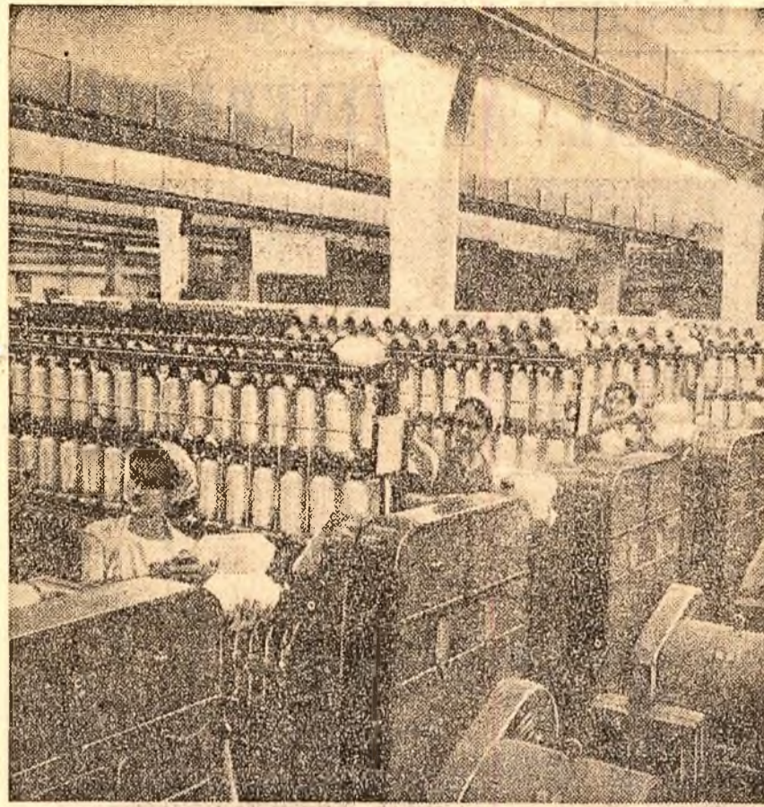
BUMBĂCĂRIA ROMINEASCĂ JILAVA. Aspect parțial al secției ring.