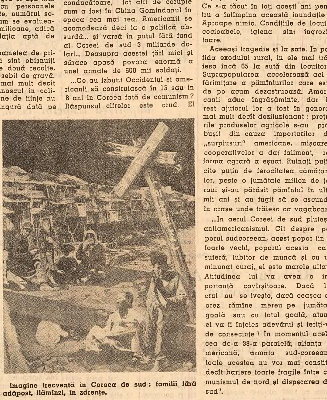
Imagine frecventă în Coreea de sud: familii fără adăpost, flămînzî, în zădărnice.

mai ales în imensa contrabandă de mături japoneze și „disparițiile” de necerut din magazinele armatei americane, fără a mai vorbi despre prostituiție, piața neagră și așa mai departe. Impreună cu persoanele fără lucru de la sate, numărul șomerilor este după cum se evaluează aproape de trei milioane, adică o treime din populația aptă de muncă. „Printre țărani, „foamea de primăvară” cu care ei sînt obișnuți în epoca dintre cele două recolte, este anul acesta deosebit de gravă. A mîncă orez este mai mult decit olandă un lux necunoscut în colibelee coreene. Milioane de ființe nu mîncă decit o singură dată pe zi, o supă mizeră din plante sălbatice și apăsac de orz. „Eu mă găsesc în Coreea în timpul războiului și am văzut semnele armististiului în 1953. Mai aud și acum lozinci plină de promisiuni pe care o proclamau americanii în numele „lumii libere”: „Vom face din această țară o țară democra, vitei”. Sudul „liber” va deveni aidoma unei prăvălii prospere în care rafturile abundente și bogate vor face de rușine nordul comunist. Coreea de sud trebuia să fie „testul”, exemplul și demonstrația a ceea ce pot îndeplini națiunile „libere” într-o țară pe care au apucat s-o salveze. După opt ani, faptele mă-