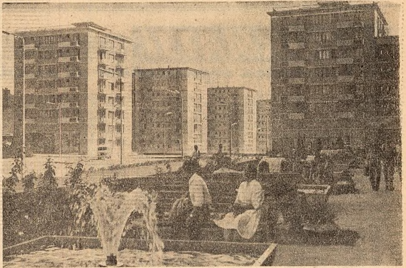
Galajul, azi. Nolle blocuri din centrul orașului.