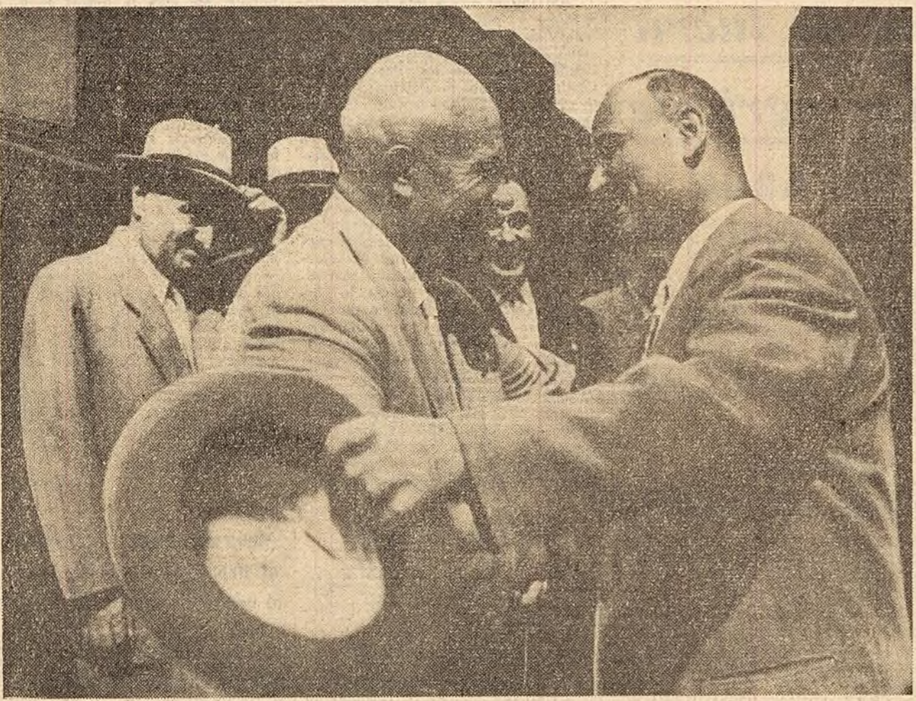
La sosire, în gara Kiev