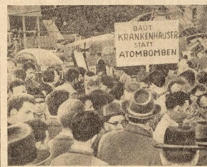
O demonstrație la München (R.F. Germană) în semn de protest împotriva politicilor agresive a cercurilor militariste care vor să înzestrez Bundeswehrul cu arma atomică. Demonstrația s-a desfășurat sub lozincă: „În loc să fabricăm bombe atomice, construim spitale!”

Deputatul Anthony Fell a calificat actuala decizie a guvernului drept „una din cele mai dezastruoase hotărîri adoptate de primul ministru”, calificîndu-l pe Macmillan însuși drept „un dezastru național”.