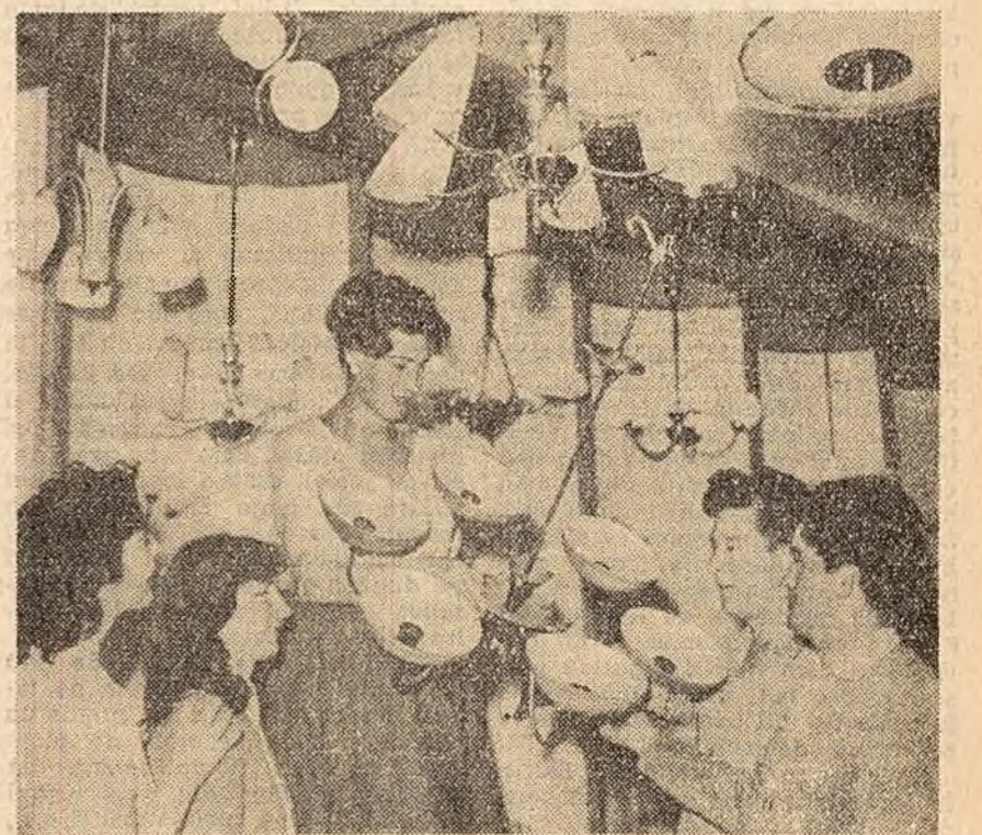
La magazinul „Electrotehnica” din Capitală.