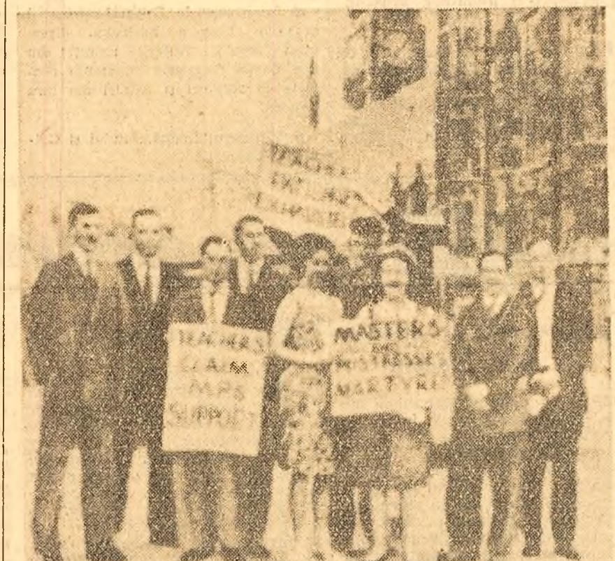
Profesorii englezi demonstrează în fața Camerei Comunelor, împotriva măsurilor de „austeritate” luate de guvern.

În încheiere, A. Novotny a încredințat pe președintele Ghanei că R. S. Cehoslovacă și întregul popor cehoslovac apreciază prietenia și colaborarea cu Republica Ghana și cu poporul ghanez și că Cehoslovacia va continua să ajute poporul ghanez în lupta pentru dezvoltarea economică a țării sale.