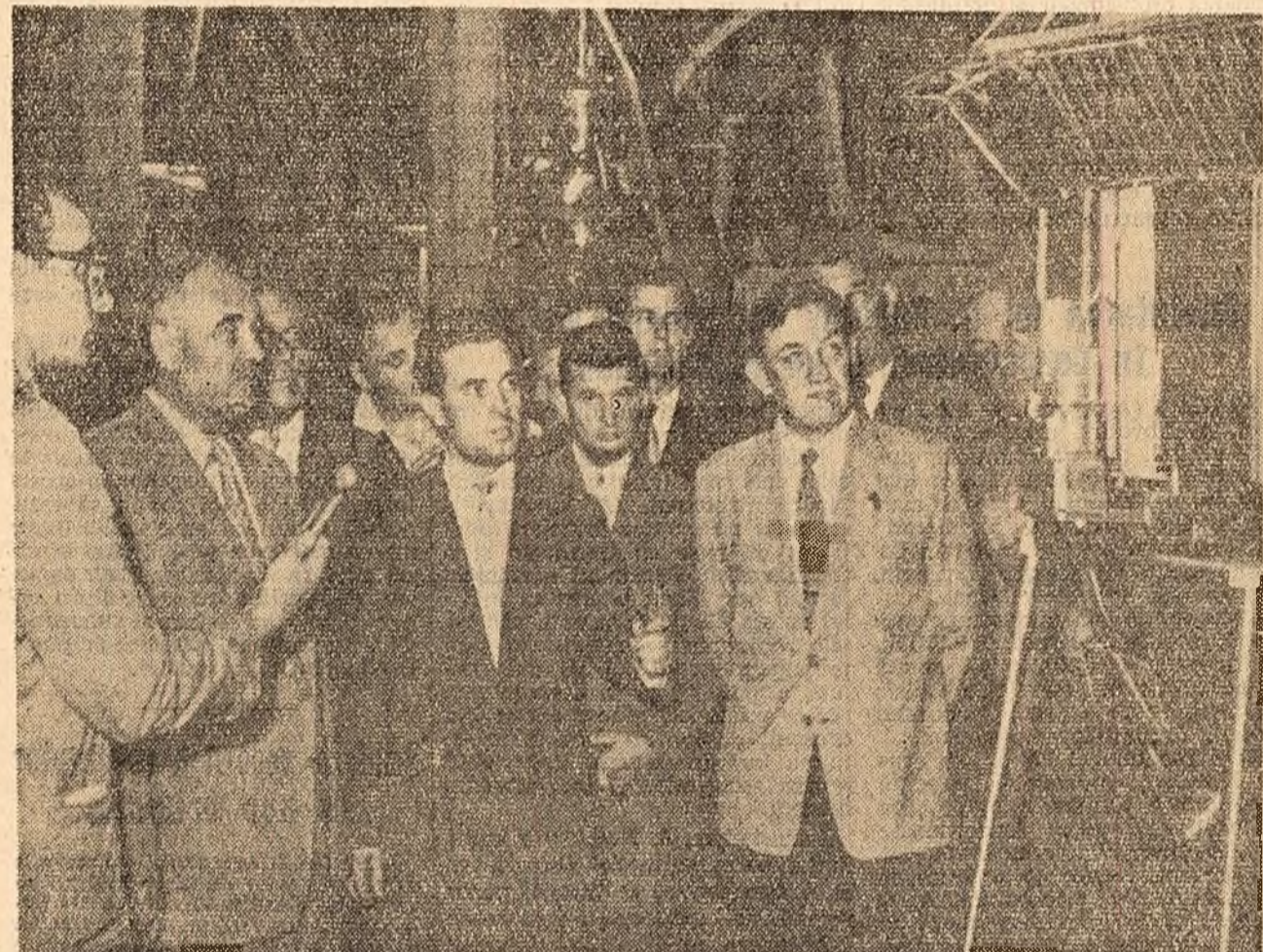
În pavilionul Academiei de Științe a U.R.S.S.

După cum relatează agenția Reuter, Adoula a arătat că în domeniul politicii externe nou guvern al Republicii va duce o politică de „neutralitate pozitivă”.