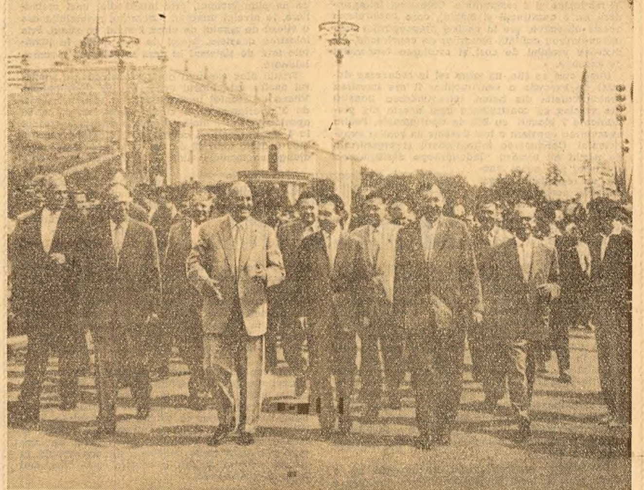
Pe una din aleile expoziției.