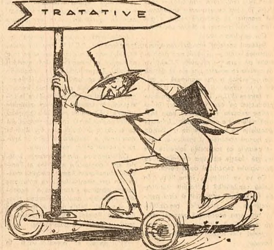
Diplomatul francez: — Noi vrem să ducem mai departe tratativele. (Desen de EUG. TARU)