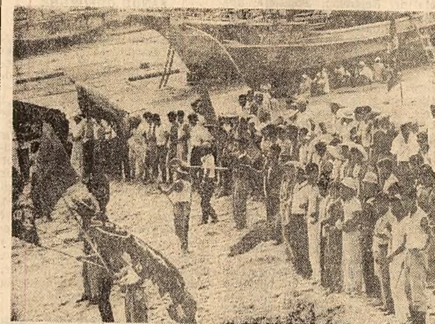
Aproximativ 400 muncitori și studenți japonezi s-au dus în insula Niijima pentru a protesta împreună cu populația locală împotriva bazelor militare americane.