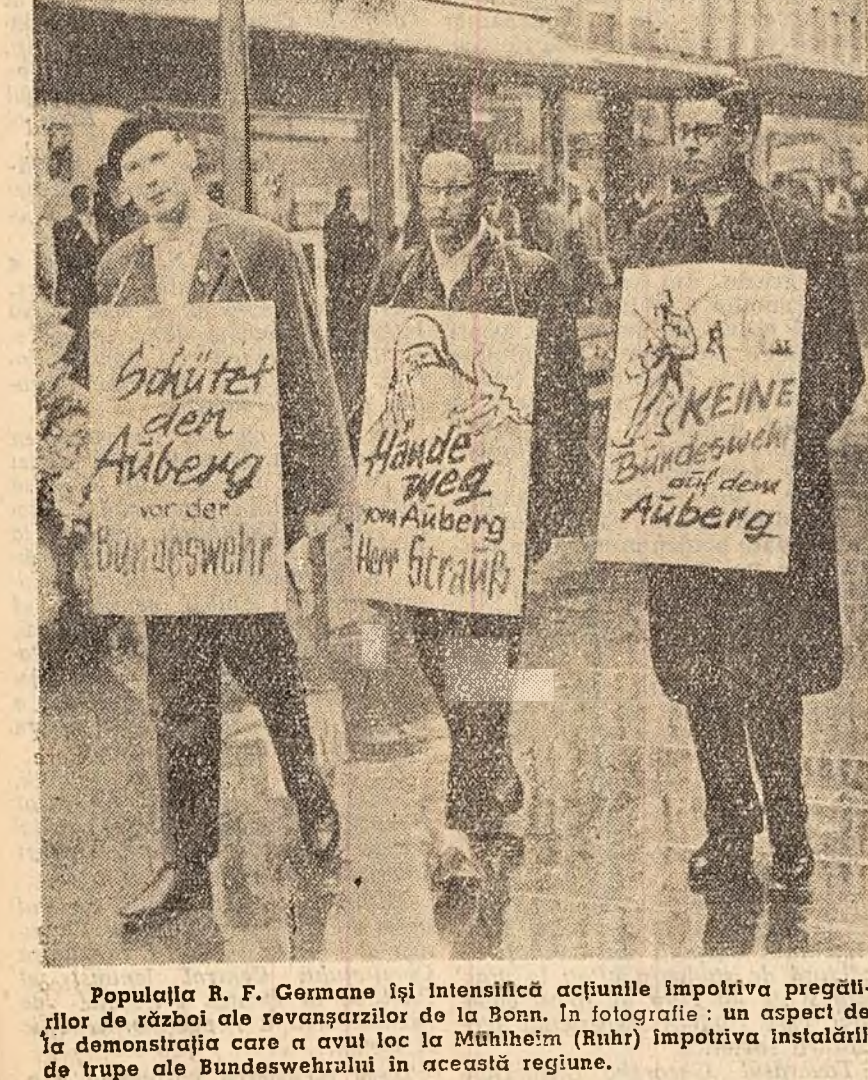
Populația R. F. Germane își intensifică acțiunile împotriva pregătirilor de război ale reșvanzarilor de la Bonn. La fotografie: un aspect de la demonstrația care a avut loc la Mülheim (Ruhr) împotriva instalării de trupe ale Bundeswehrului în această regiune.