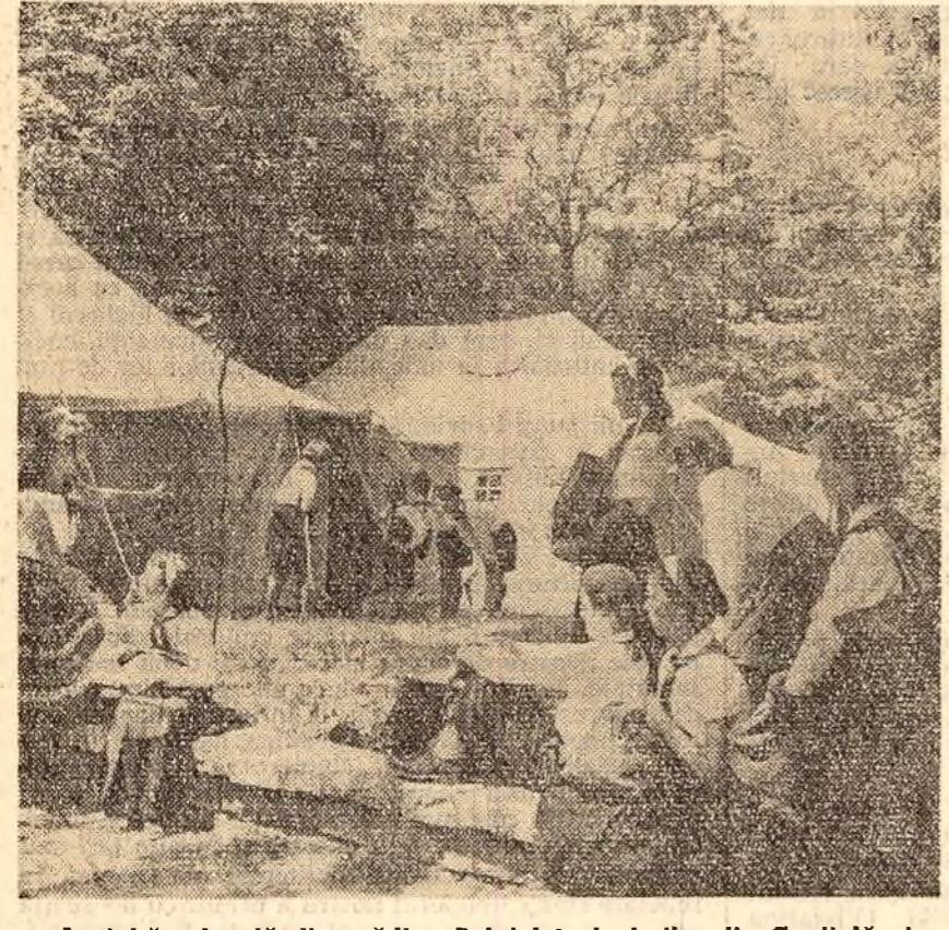
La tabăra locală din grădina Palatului pionierilor din Capitală au numeroși oaspeți. Zilele trecute au sosit aici pionierii din raionul Roșiori de Vede. Ei fac parte din mii de pionieri și școlari din orașele și satele patriei care vizitează zilele acestea Capitala.

Pe lângă prezentarea expunerii de către tovarășul Molnar Ion, secretar al comitetului regional P.M.R. Mureș-Autonomă Maghiară, un mare număr de participanți la adunarea activului din domeniul agriculturii s-au înscris la cuvânt.