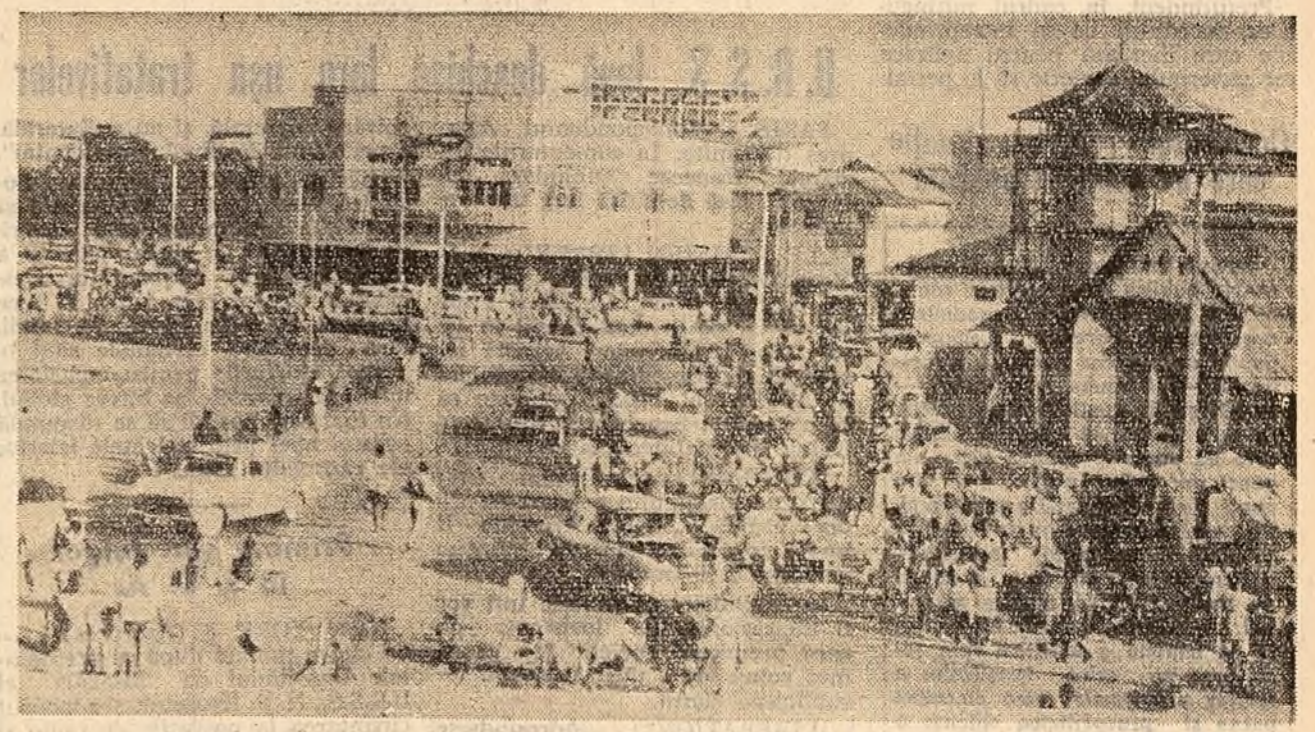
O vedere obișnuită pe una din străzile principale ale orașului Accra, capitala Republicii Ghana.

TOKIO 8 (Agerpres). — Sub presiunea maselor populare, tribunalul japonez care a judecat „procesul Matsukawa” a achitat pe toți patrioții implicați pe nedrept în această afacere murdară. Verdictul a fost pronunțat la 8 august de înalta curte de la Sendai. Mulțimea masată în fața clădirii tribunalului a primit cu puternice ovăși sentința. După cum se știe, cu 12 ani în urmă, cercurile reacționare din Japonia au pus la cale derajarea unui tren, aruncînd apoi vina asupra unui grup de patrioți cu scopul de a lovi în mișcarea muncitorească. Patru dintre acuzații fuseseră condamnați la moarte, iar ceilalți la închisoare pe diferite termene. Timp de 12 ani opinia publică japoneză a dus o luptă susținută pentru rejudecarea procesului și eliberarea celor nevinovați, luptă care se termină acum cu o victorie.