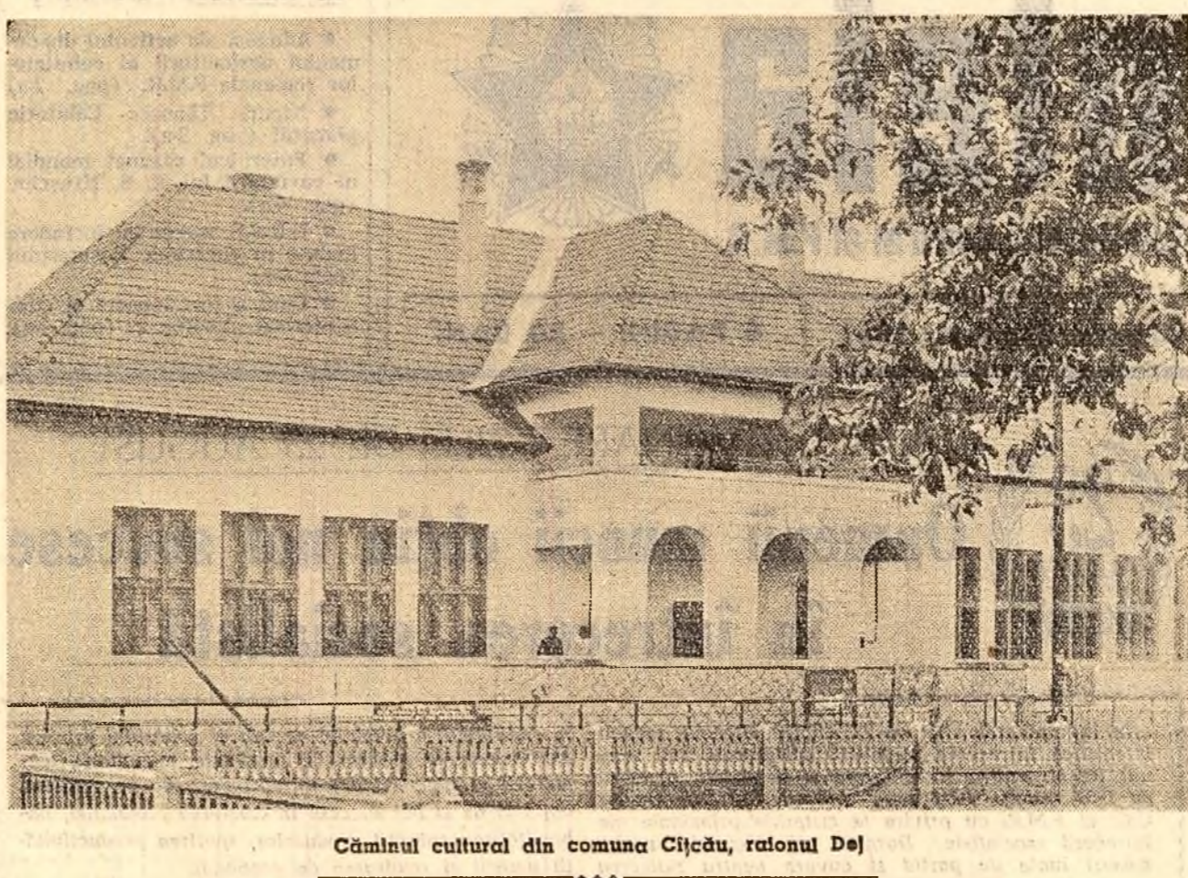
Căminul cultural din comuna Cișcău, raionul Dej