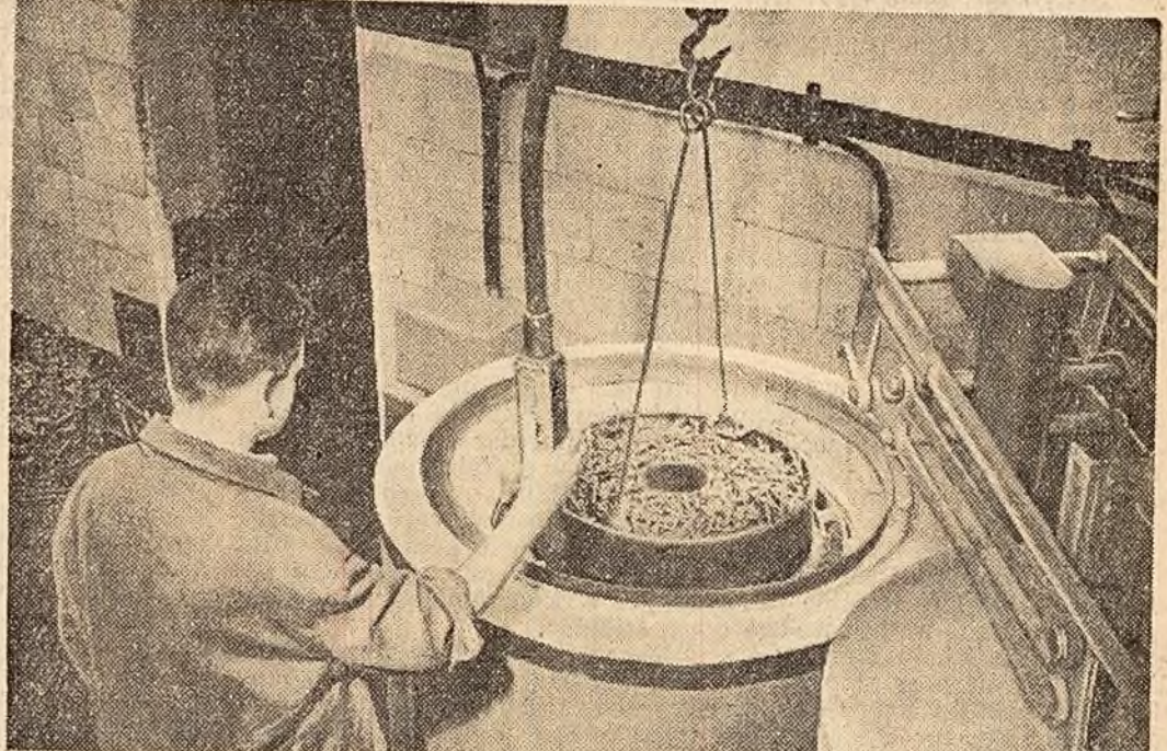
Fabrica de scule Rîșnov. Se introduc scule în mediu de aburi supraîncălzite...