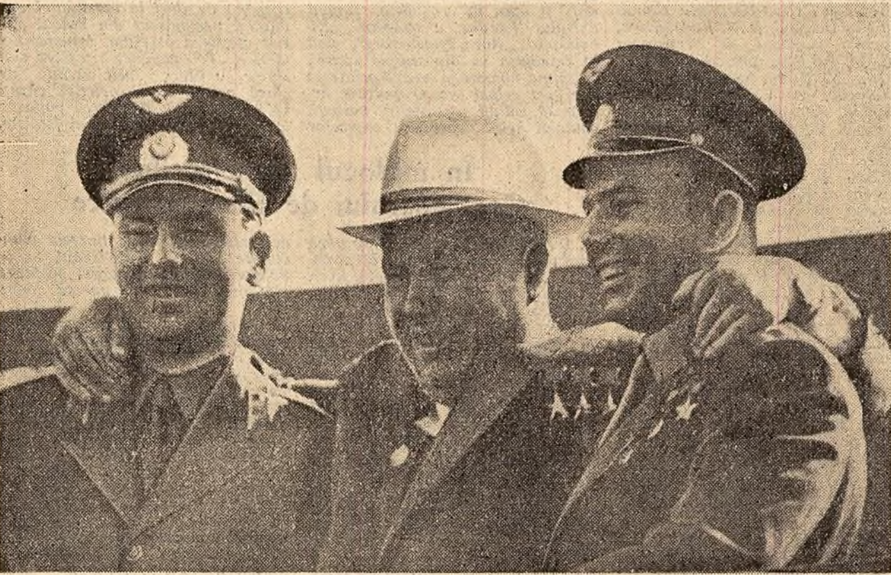
La mingul din Piața Roșie, N. S. Hrușciov îi îmbrățișează părintește pe Gherman Titov și Iuri Gagarin.