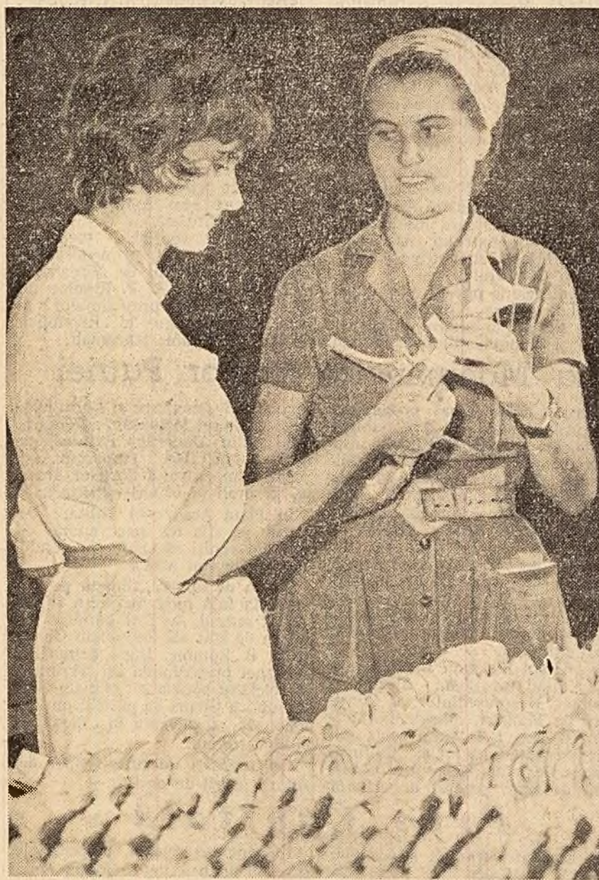
Furca pentru cutia de viteze a autocamionului este deosebită...