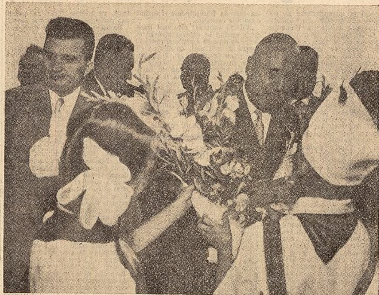
La sosirea în Kiev.