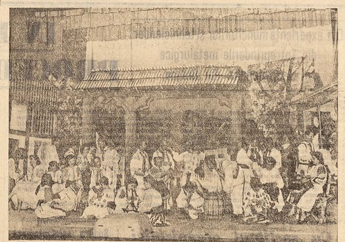
Scenă dintr-un spectacol prezentat de colectivul de operetă al Casei raionale de cultură Orăștie — calificat pentru liza finală a celui de-al VI-lea Concurs al formațiilor artistice de amatori.

În cursul vizitei făcute prin Capitală oaspeții au fost salutați călduros de numeroși bucureșteni.