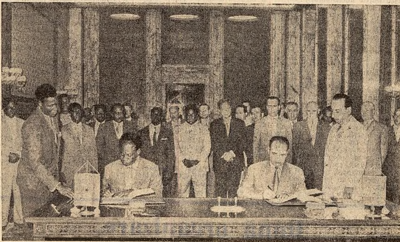
La Consiliul de Miniștri al Republicii Populare Romîne, în timpul semnării Declarației comune romîno-ghaneze.