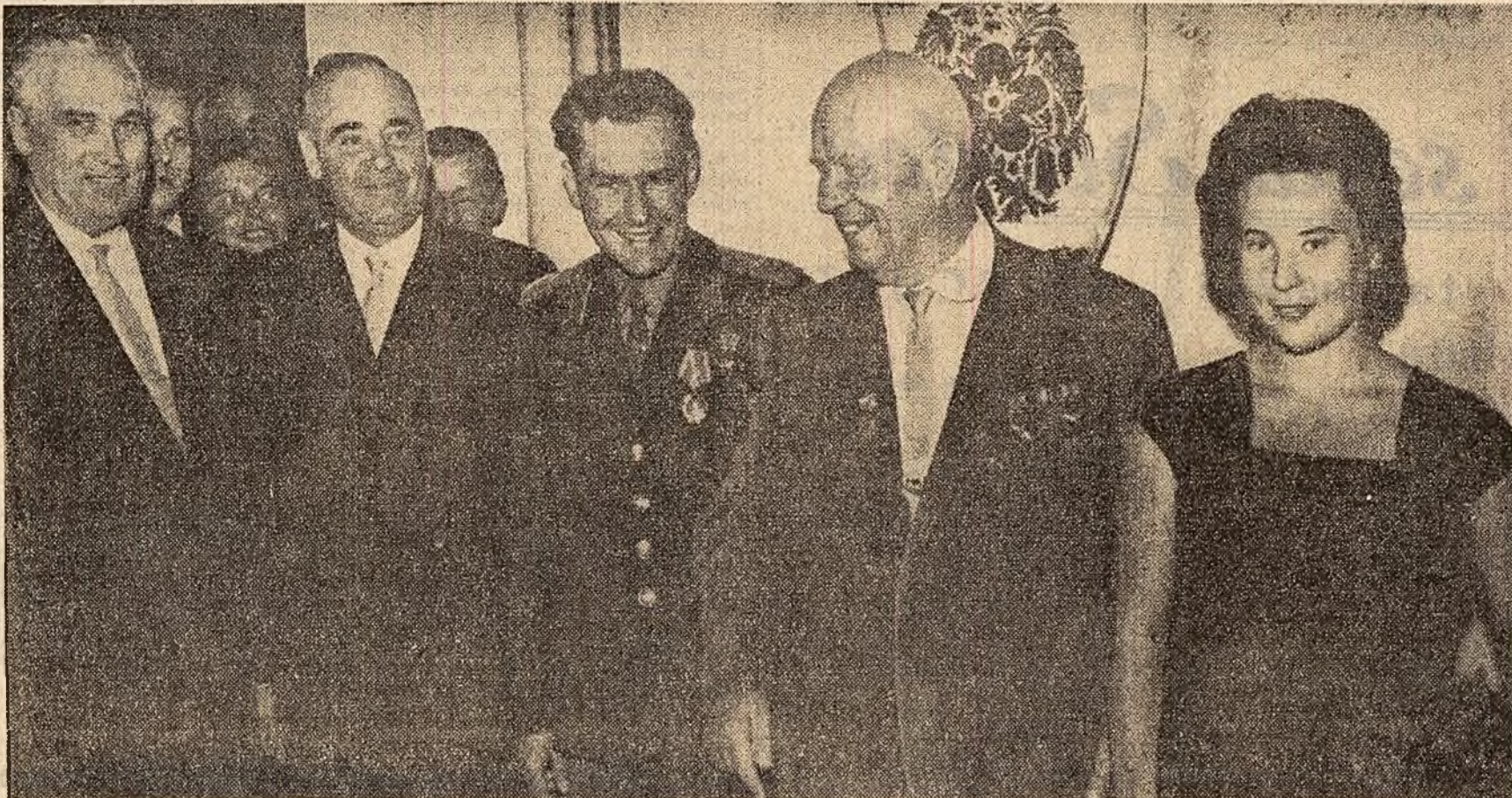
In timpul recepției