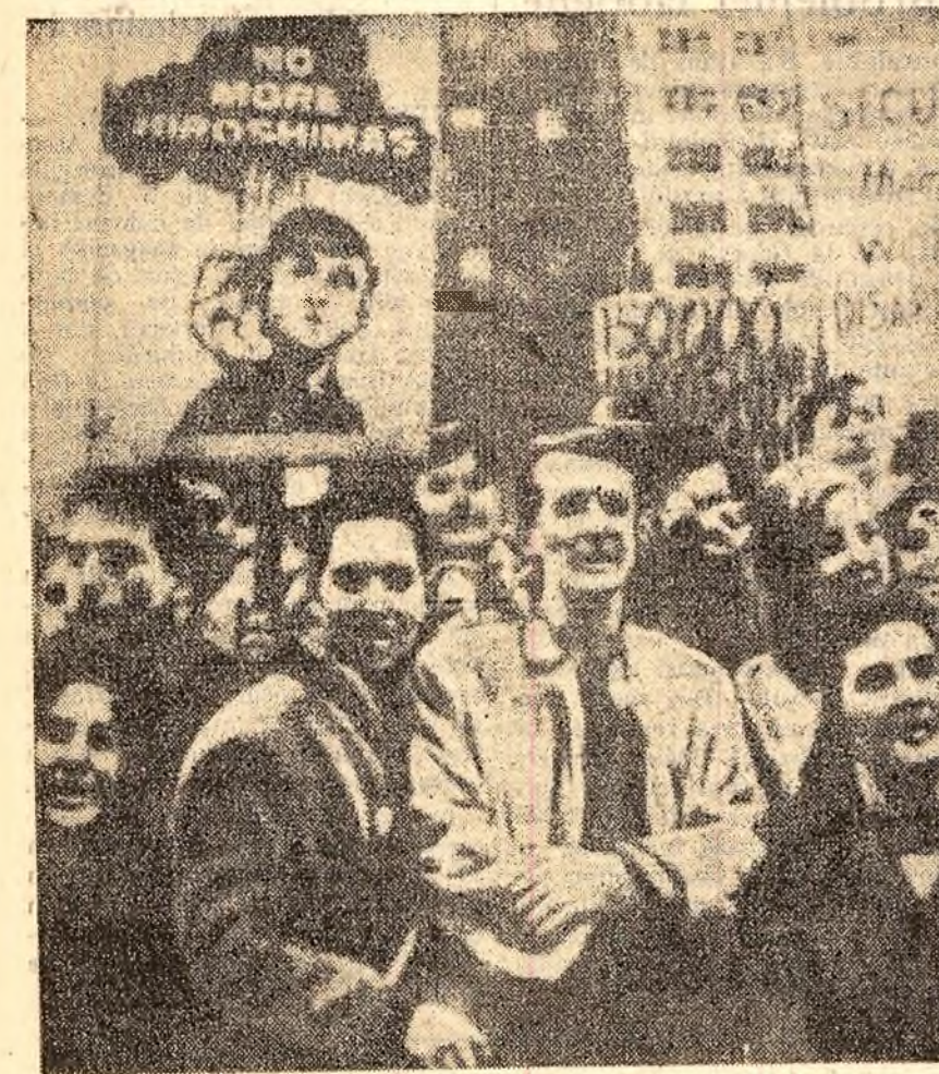
Demonstrație a studenților americani în fața sediului O.N.U., pentru dezarmare generală și totală.

NEW YORK 10 (Agerpres). — liste și de un număr de alte țări din Europa și America Latină. Numărul țărilor care au cerut convocarea sesiunii speciale a ajuns la 51.