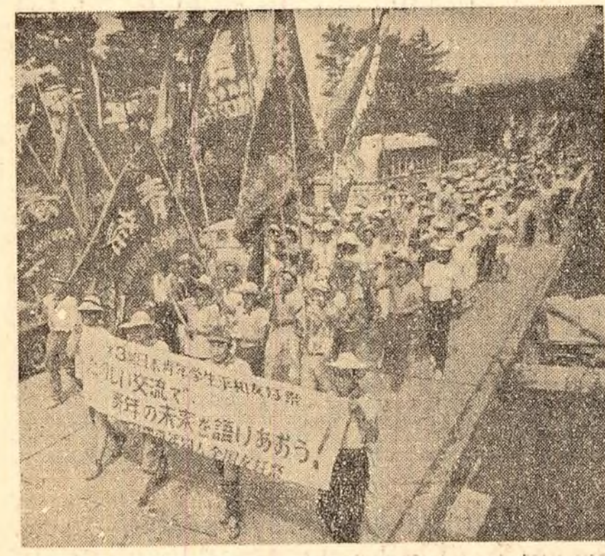
Recent, pe malul lacului Yamanka a avut loc o demonstrație a studenților japonezi pentru pace. În fotografie: un aspect de la demonstrația celor peste 6.500 studenți japonezi.

Pe aeroportul Vnukovo el a fost întâmpinat de L. I. Brejnev, președintele Prezidiului Sovietului Suprem al U.R.S.S., de I. A. Malik, locțiitor al ministrului Afacerilor Externe al U.R.S.S., și de alte persoane.