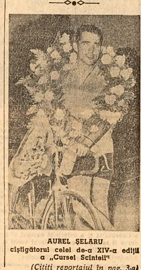
AUREL ȘELARU câștigătorul celei de-a XIV-a ediții a „Cursel Scintei” (Citiți reportajul în pag. 3-a)