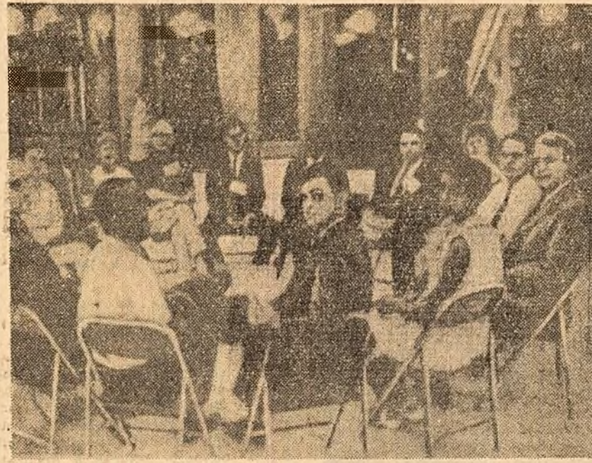
Neștri și albi participanți la o demonstrație „prin ședere” în hall-ul parlamentului din Madison, statul Wisconsin (S.U.A.). Ei au exprimat cererea ca parlamentul să adopte legi împotriva discriminării rasiale. (Din ziarul „New York Times”)

Presă tunisiană își exprimă indignarea față de acțiunile comandamentului francez care, după cum arată ziarul „As-Sahab”, vîndind că agresiunea din Bizerta nu a fost pedepsită extindere sfera operațiilor militare.