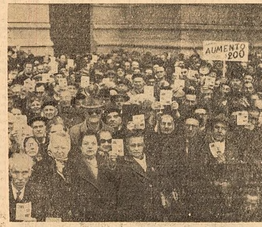
Pensionarii din Uruguay au demonstrat în fața parlamentului din Montevideo cerînd mărirea pensilor lor de mizerie și înțelnirea tratului.

Ca urmare a grevei minerilor, producția chiliană de minereu de cupru a încetat în proporție de 90 la sută. Instalațiile feroviare sînt pázite de trupe.