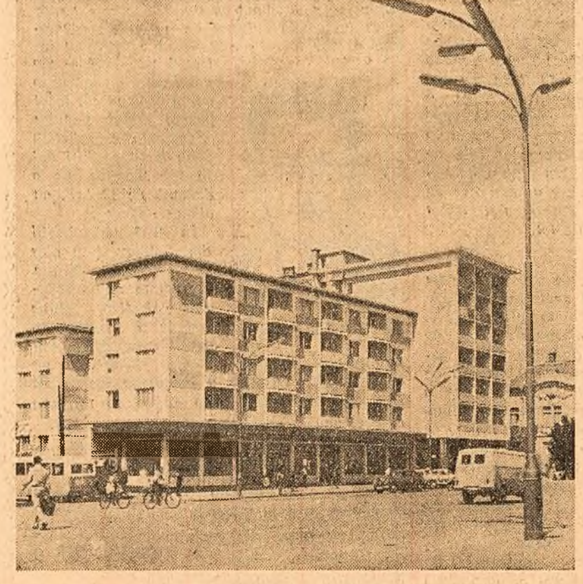
CLUJ. Blocuri noi în Piața Păcii.

ION GHEORGHE MAURER președintele Consiliului de Miniștri al Republicii Populare Romine