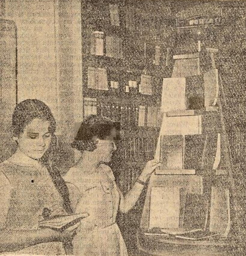
În fața standului cu manuale școlare, pentru clasele VIII—XI, de la Bibliotecă Noastră nr. 4 din Capitală.

Încheiere, oaspetele a subliniat rolul constructiv pe care îl au schimbările de delegații parlamentare. Aceste vizite — a spus el — nu pot decât să contribuie la promovarea prieteniei între popoare, la eliminarea unor din neînțelegerile care ar putea exista, la menținerea păcii mondiale.