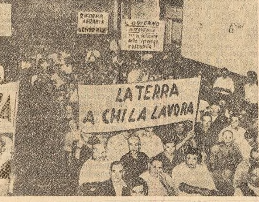
În orașul italian Pistoia a avut loc o puternică demonstrație a câșmașilor pentru înapoierea reformei agrare. În locuție: Demonstrații delicioase pe străzile orașului. Pe pancartele lor scrie: „Pămîntul — color ce-l muncesc”.

NEW YORK 15 (Agerpres). — Străduindu-se să înăbușe lupta patrioților din Vietnamul de sud, S.U.A. trimite arme de tipuri noi autorităților sud-vietnameze. Săptămînalul „NEWSWEEK” anunță că printre aceste arme figurează un gaz special care se propagă repede. „O nouă importanță, a declarat un expert militar, este că noi am hotărît să folosim pentru prima oară unele tipuri de arme ultramoderne și cel mai bun echipament acolo unde se desfășoară realmente operațiuni militare. Este vorba de locurile unde luptăm împotriva comunistilor, și