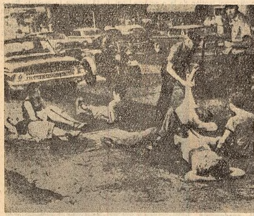
Aspect de la o demonstrație de protest la Greton (Connecticut, S.U.A.) în fața sediului conducerii unei uzine care produce rachete „Polaris”. Poliția brutalizează demonstrații care s-au așezat în mijlocul străzii, blocînd circulația.

Ziarul londonez „EVENING STANDARD” relevă că în momentul de față tratativele în problema Berlinului occidental au devenit și mai urgente. „Orice tergiversare în realizarea acordului cu privire la convocarea unei conferințe intensifică pericolul”, arată ziarul. „Evening Standard” critică elementele din Occident care au început să facă zăvălă propagandistică în legătură cu adoptarea unor „contramăsuri” împotriva R. D. Germane. „Această campanie, scrie ziarul, are la bază neînțelegerea situației create”. Ziarul „EVENING NEWS” compară situația din Berlinul occidental cu un „Filiți aprins”, care „trebuie să fie stins”. Chiar și ziarul „GUARDIAN”, care comentează în mod calmios măsurile guvernului R.D.G., avertizează că puterile occidentale trebuie să se gîndească bine înainte de a lua vreo contramăsură.