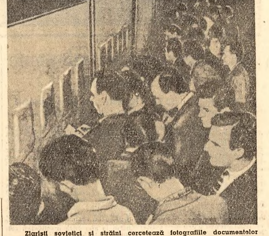
Zariștii sovietici și strălîn corcetează fotografiile documentelor secrete ale blocului militar agresiv C.E.N.T.O. (foștul Pact de la Bagdad).

Privire mi s-au oprit pe o hartă reprezentînd nordul Iranului, Afganistanului, Pakistanului și o parte din teritoriile de sud ale Uniunii Sovietice. În precizia limbii engleză documentul poartă titlul: „Loviturile nucleare ale forțelor C.E.N.T.O. pe teritoriile Iranului, Pakistanului și Afganistanului”. Pentru orice om cu mîntea întreagă sensul acestor cuvinte este