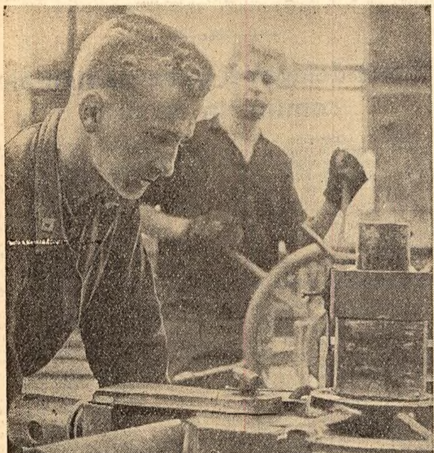
Oamenii muncii din R.D.G., își manifestă prin fapte patriotice voința de a întări puterea statului democrat-popular. În fotografie: Brigada de tineret „Sputnik” de la uzina „Bergmann-Borsig” se află în întrecere cu brigada „Otto Krahmann” de la fabrica de cabluri Ober Spree.