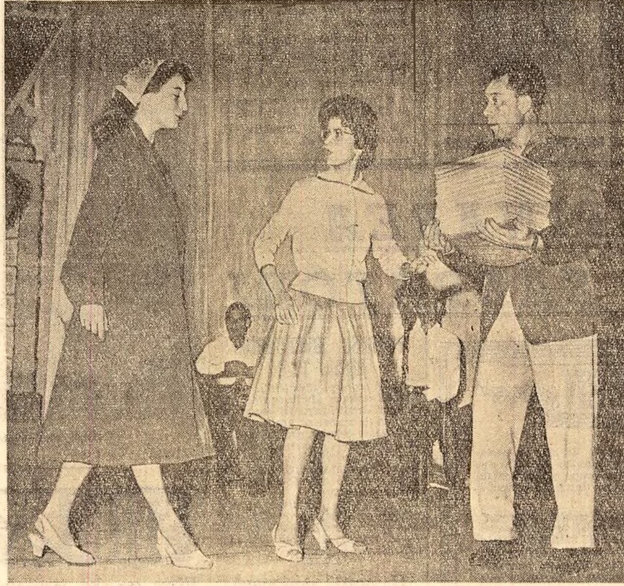
Finala concursului a luat sfârșit. 3 INSTANTANEE. Lecție de muzică.

In timp ce pionierii și școlarii se bucură de zilele frumoase de vacanță, la munte sau la mare, sfaturile populare, deputații, cadrele didactice se îngrijesc de pregătirea școlilor în vederea deschiderii noului an de învățământ. Nu mai este mult până în ziua când clopoțelul va suna începutul primei ore de curs. Pentru această zi totul trebuie să fie din timp minuios pregătit.