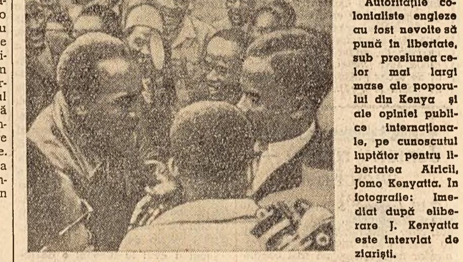
Autoritățile coloniale engleze au fost nevoite să pună în libertate, sub presiunea celor mai largi mase ale poporului din Kenya...