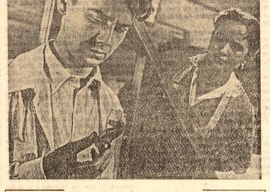
Pe ecranele unor cinematografe din Capitală răsădit filmul artistic sovietic "Oameni pe pod", creație a studioului "Mosfilm".

Un colectiv al teatrului "C. Notara" va susține la Giurgiu, în 31 august, un spectacol cu piesa "În căutarea extraordinarului" de I. D. Șerban.