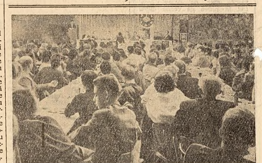
Recent, la Duseldorf (R.F.G.) a avut loc o intalnire a liderilor din oaraș. Tinerii au condamnat politica avventuristă și revanșardă a guvernului de la Bonn.