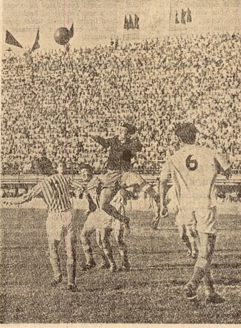
Fază din meciul Rapid - Minerul