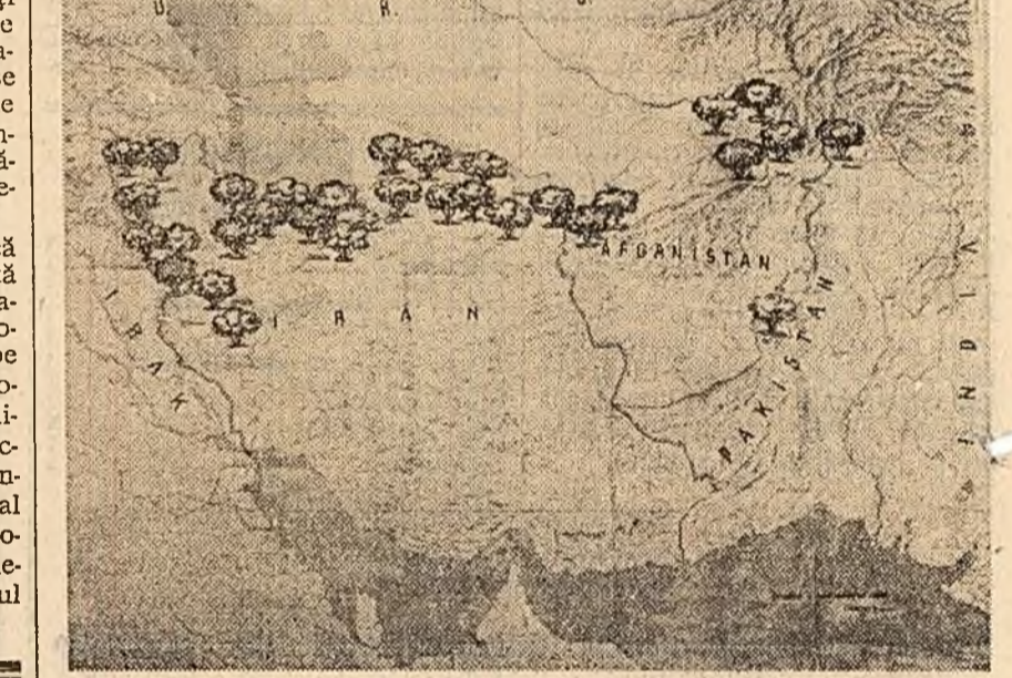
Pe această hartă, înlocuim pe baza documentelor C.E.N.T.O. sint însemnate cu „cluperci” atomice regiunile din Iran, Pakistan și Afganistan...