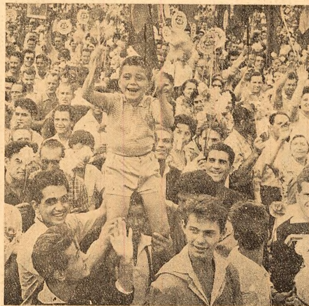
Sărbătorirea zilei de 23 August. Aspect de la demonstrația oamenilor muncii din Capitală (fotografia din stînga); mulțimea de spectatori în fața estradei amenajate în Piața Palatului R. P. Romîne (fotografia din dreapta).

ARHIPISCOPUL MAKARIOS președintele Republicii Cipru