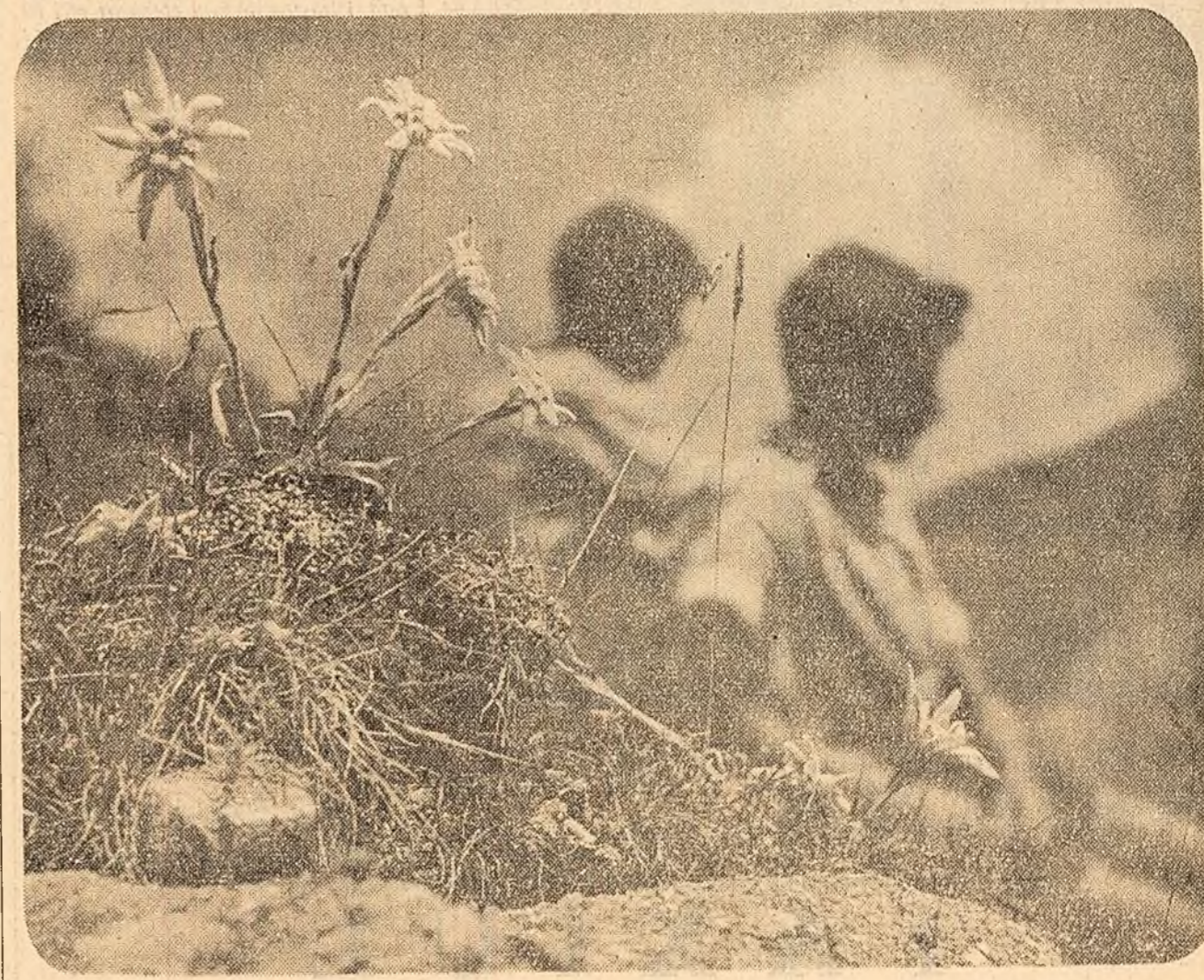
Rubrica „Cu ochii turistului” își propune să popularizeze frumusețile și obiectivele de interes turistic din țara noastră. Ea va cuprinde fotografiile însoțite de texte explicative: monumente și locuri istorice, frumuseți și curiozități ale naturii, faună și floră caracteristice, obiective și piese muzeistice, arhă populară, elemente etnografice etc. Invităm cititorii noștri să ne trimită fotografii și texte dintr-o parte sau alta a țării noastre.

Cineva o bate ușor pe umăr. Intocmai capul brusc și primește în față, ca o palmă, duhoarea respirației. Este citit de aproape în spatele ei, înclinat și parșă. Îl recunoaște imediat. Cum de a apărut așa pe neașteptate? Dăru cînd s-a urcat în tramvai și a uitat că grădă peste tot. În stație nu mai era nimeni. Oricum, a greșit, a greșit rău căcînd hotărîrea de a evita tramvaiul. Mai ales în timpul unei acțiuni. Dar, cîndă ea să se liniștească, aștepta de peste o jumătate de oră un taxi goal. Și așa, situația începe să devină periculoasă... Acest dialog inutil cu sine însăși îi trece fulgerător prin cap.