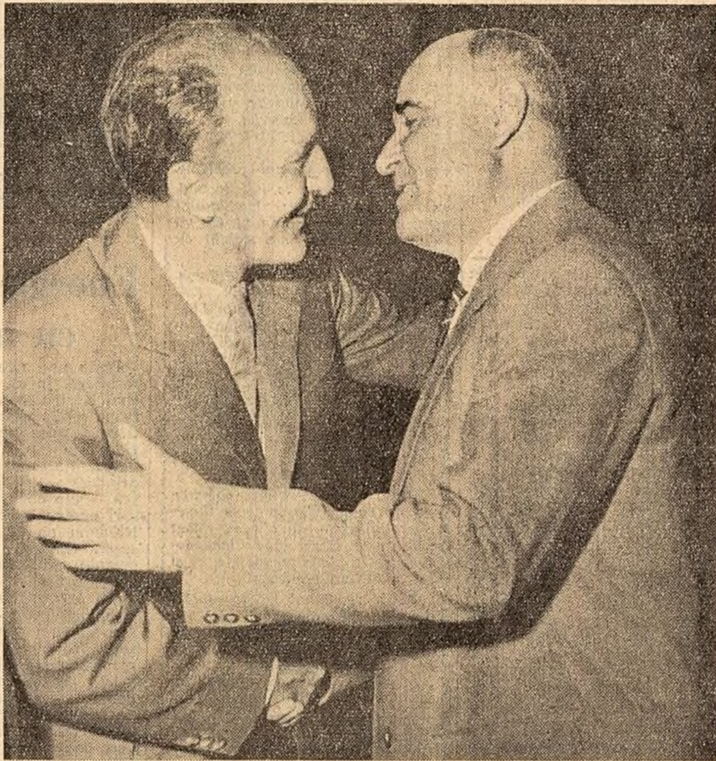
La sosire, în gara de vest din Budapesta