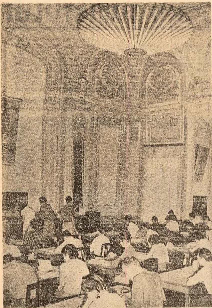
Biblioteca Centrală de Stat a R.P. Romine posedă peste 3.870.000 cărți politice, literare, științifice, reviste și diferite publicații, discuri și partituri muzicale etc. În primul semestru al acestui an, aproape 100.000 cititori au studiat lucrările sale. În fotografie: Un aspect obișnuit din sala de lectură a bibliotecii.