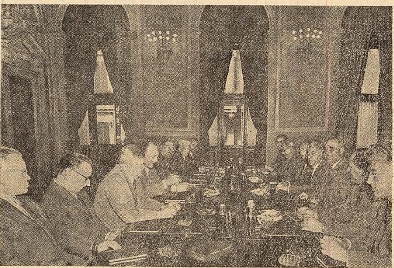
În timpul convorbirilor dintre delegațiile P.M.R. și P.M.S.U.