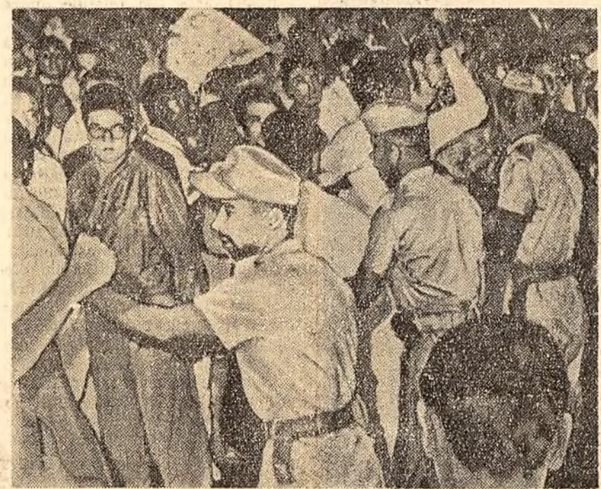
In orașele Braziliei au loc demonstrații și mitinguri de protest împotriva încercărilor reacțiunii de a-l împiedica pe vicepreședintele Joao Goulart de a ocupa, în conformitate cu prevederile constituției, postul de președinte al republicii. In fotografie: La Rio de Janeiro poliția împărăște pe manifestanți.

Moura de Andrade, a declarat că Joao Goulart va fi investit ca președinte luni 4 septembrie în fața parlamentului, pe baza articolului 79 al constituției braziliene. „La nevoie, a spus Andrade, voi pleca la Porto Alegre pentru a-l conduce personal pînă la Brasília”.