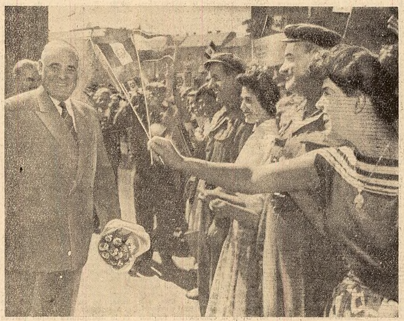
Oamenii muncii din capitala R. P. Ungare salută cu înaltaț pe tovarășul Gheorghe Gheorghiu-Dej și pe ceilalți membri ai delegației romine.