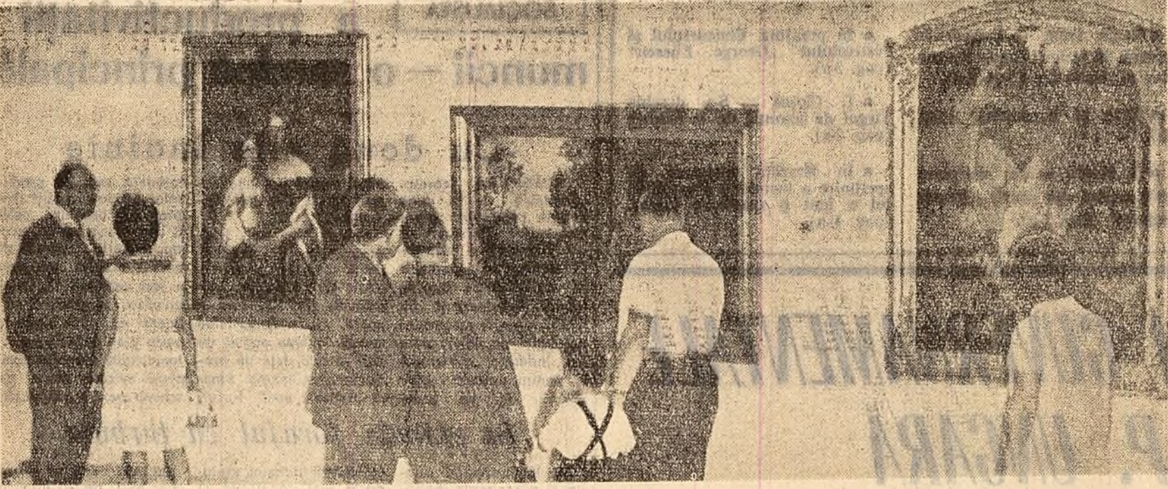
In noile săli ale Muzeului de artă al R. P. Romine a fost recent deschisă o expoziție de pictură a Galerilor de stat din Dresda (R. D. Germană). In fotografiile: Aspect de la expoziție.