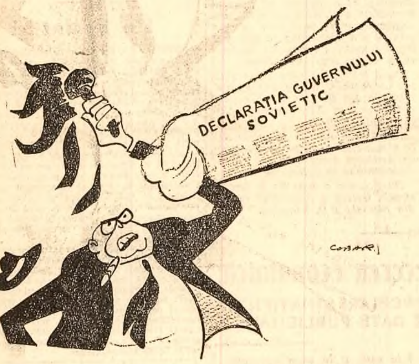
O măsură menită să lăte agresorul polta de a se juca cu focul! (Desen de NELL COBAR)

COMITETUL CENTRAL AL PARTIDULUI MUNCITORESC ROMIN