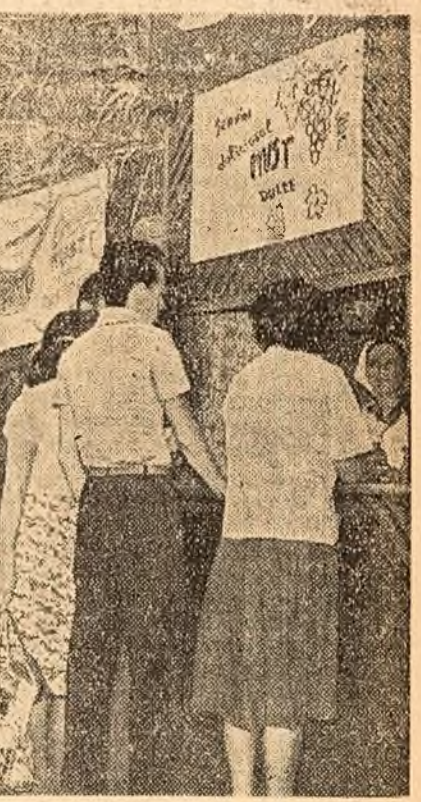
S-au deschis mustăriile.

Abundență de produse de calitate, o bună organizare și deservire, iată ce vor să găsească gospodinele în piață, acum cînd se pregătesc să întîmpine iarna.