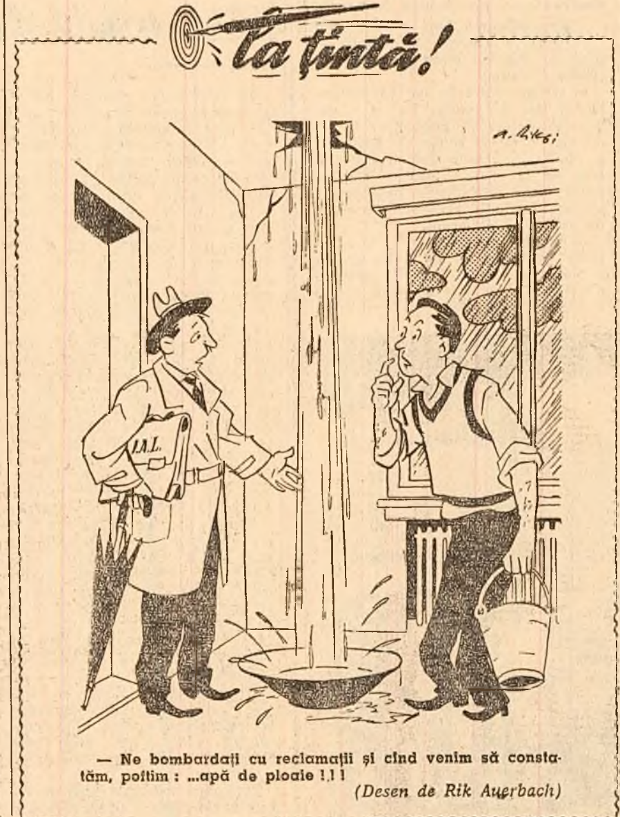
— Ne bombardei cu reclamații și cînd venim să constatăm, politim: „apă de ploaie!!!” (Desen de Rik Auğrbach)