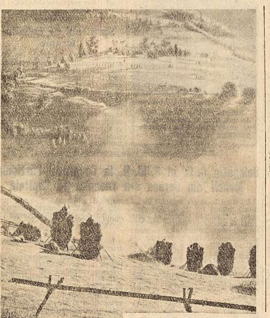
Toamna în Țara Moșilor