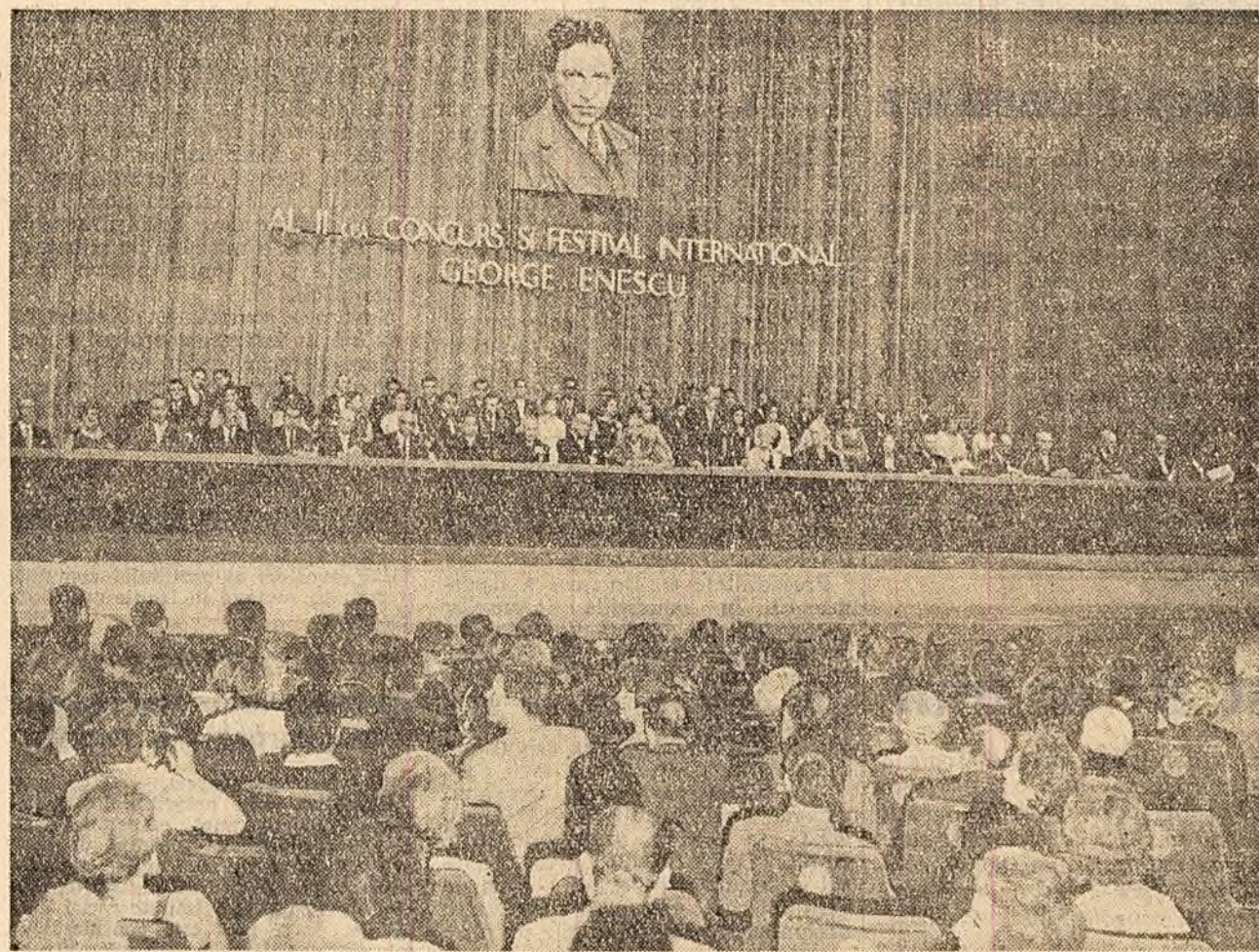
Aspect de la festivitatea închiderii celui de-al doilea Concurs și Festival internațional „George Enescu”.