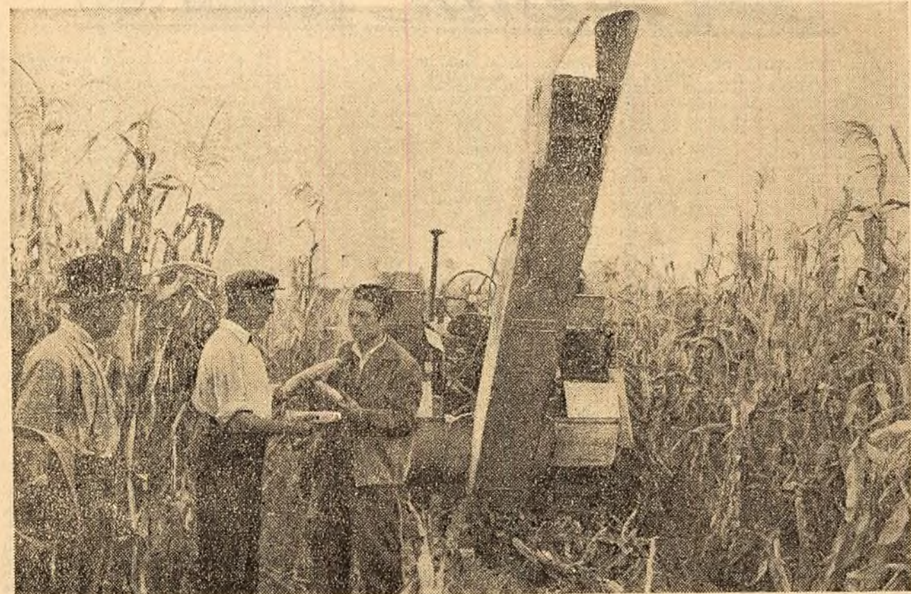
La G.A.C. „Victoria socialismului” din satul Tătaru, regiunea Galați, a început recoltatul porumbului. Colectivii sint mulțumii de recolta obținută.

mea — extinsă la toate sondele din regiunea noastră la care se forează cu turbina.”