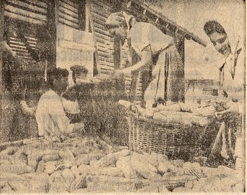
— Sămânța bună, semănată la vreme, în teren bine pregătit, telele gospodăriei colective „Victoria Socialismului” din Ponerii Vuiașii, Colectivului Iurează la recolta porumbului, pe care-l depozitează în pălătele construite în cursul...