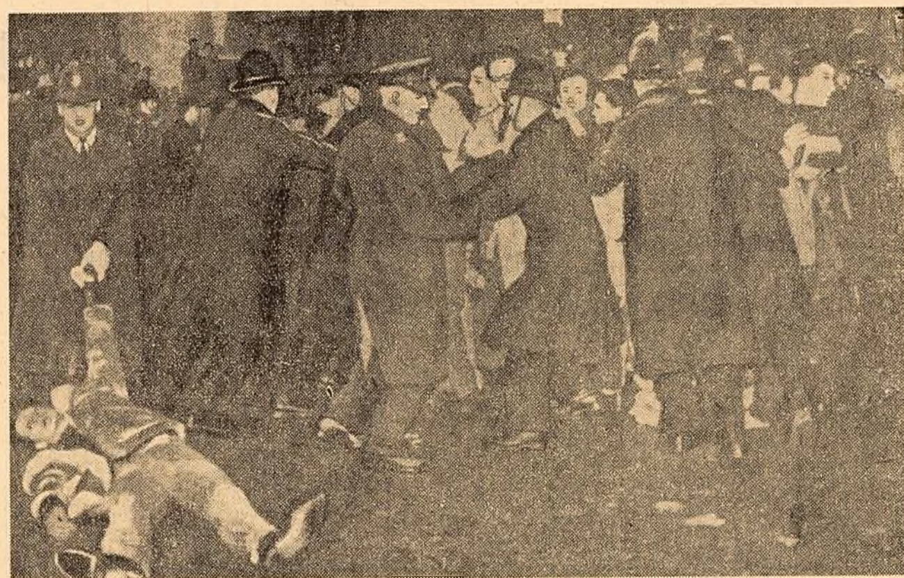
În Anglia s-au desfășurat zilele trecute puternice demonstrații de masă sub lozincile: „NU VREM RĂZBOI DIN CAUZA BERLINULUI” și „NU I — BAZELE AMERICANE DE SUBMARINE, INZESTRATE CU RACHETE „POLARIS”. Manifestația care a avut loc în piața Trafalgar din Londra a continuat fără întrerupere peste 12 ore. În cursul demonstrațiilor de la Londra și din Scoția, autoritățile au arestat peste 1.600 de persoane, printre care multe personalități din domeniul culturii și artelor. În fotografia de sus: în piața Trafalgar din Londra poliția se rătuiește cu demonstrații.