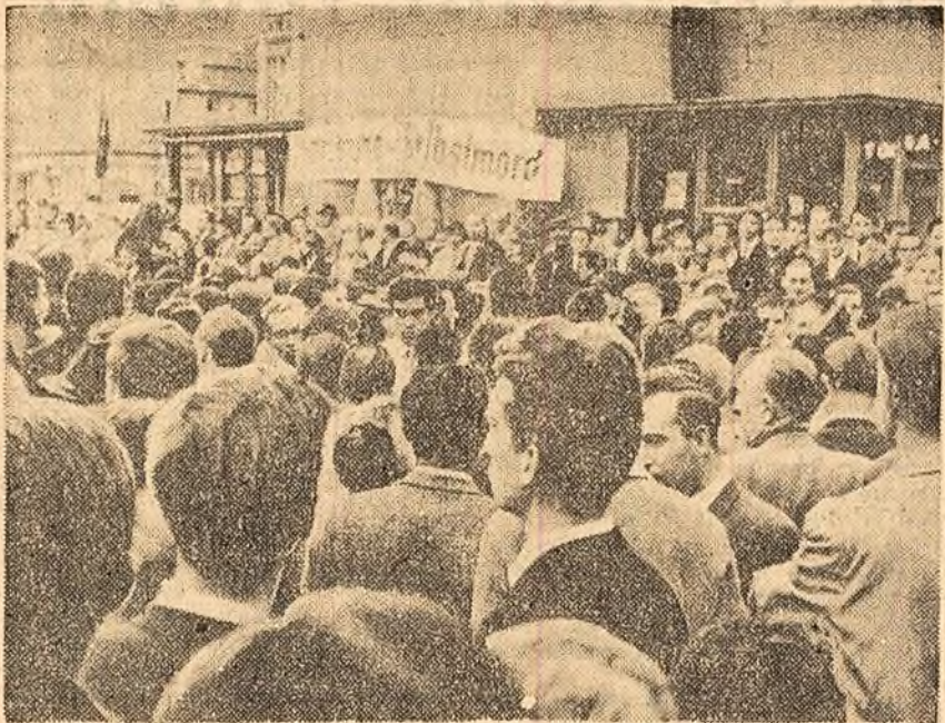
Aspect de la un mare miting desfășurat la Düsseldorf (R. F. G.). Participanții s-au pronunțat împotriva înarmării Germaniei occidentale. Pe pancartele lor se pot citi cuvintele: „Inarmarea înseamnă sinucidere”.