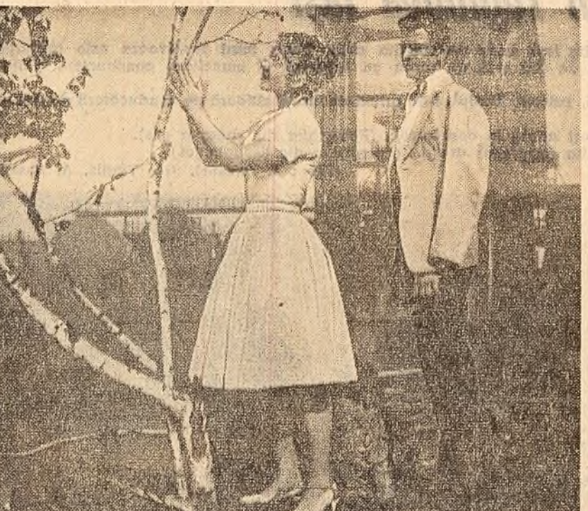
Scenă din filmul românesc „Aproape de soare”

Vă prezentăm, pe scurt, „Masfilm” — este realizat după un scenariu de Viktor Rozov — cunoscut dramaturg, scenarist al filmului „Zboară cocoril!” Noul film înălțărează o serie de înfîptiri care se petrec, în cursul unei singure zile, în viața unei familii moscovite. Prilej pentru cinești de a dezvălui conflictele vii, de a pune în dezbateri importante probleme de educație, de etică socială.