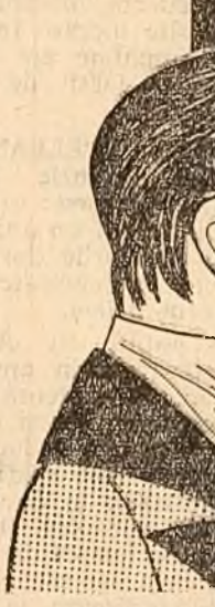
JEAN VILAR în „Mercadet”