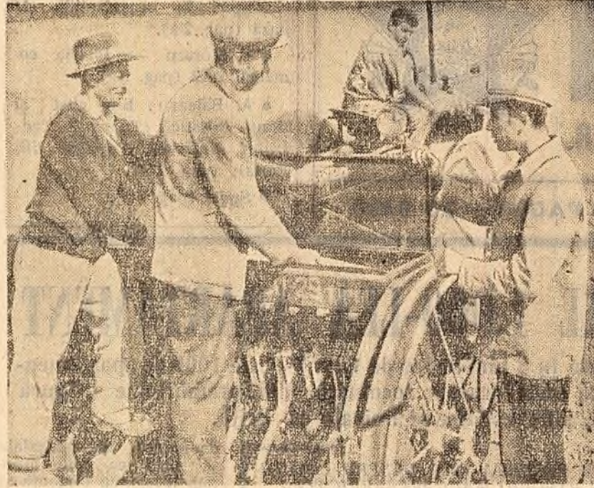
— Sămânța bună, semănată la vreme, în teren bine pregătit, telele gospodăriei colective „Victoria Socialismului” din Ponerii Vuiașii, Colectivului Iurează la recolta porumbului, pe care-l depozitează în pălătele construite în cursul...

Administrative diferite măsuri, a fost îmbunătățită munca politică în acest sector. În cuvântul său, tov. Năstase Farmazon a arătat că datorită activității membrilor de partid din sectorul poștal — sector în care vin și pleacă zilnic peste 4.000 scrisori și telegrame — aici nu există reclamații. Abonamentele la ziare și reviste se distribuie în oraș la timp.