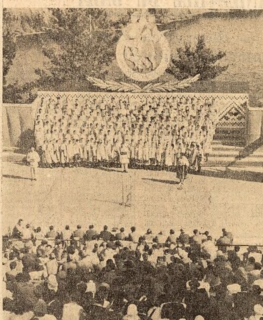
Pe scenă, corul cîminului cultural din comuna Furculești

Tei și stejari bătrîni înconjoară un luminis ce coboară în pantă spre o scenă vastă. Scena pare suspendată deasupra apelor lacului care formează fundul. Același cadru în care s-a desfășurat ieri toată ziua lăza regională a jocului și portului popular din regiunea Buceurești. Locul serbării — pădurea Pustnicul, din apropierea Capitalei. Adăugați la cele spuse cîteva pavilioane de expoziții, în care au fost prezentate principalele realizări din regiune, peste 50.000 spectatori sosiți aici dis de dimineață, și... bineînțeles artiștii. Peste 4000 de artiști amatori, cei mai buni, veniți