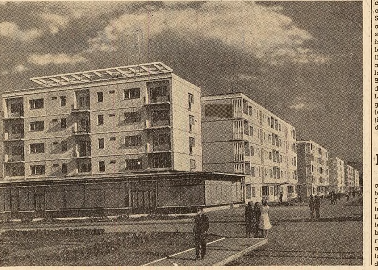
Un colț din lașul de azi: Blocuri noi construite în cartierul „C. I. Parhon”; aici s-au dat în folosință peste 200 apartamente iar altele sînt în construcție.

Am vizitat nu de mult muzeul închinat marelui nostru muzician, George Enescu. Există aici și violă de două palme care a vibrat în minile copilului de cinci ani, și manuscrisele ultimelor lucrări; există alife, fotografii, scrisori și o hartă. Harta turneelor lui George Enescu. Alături, mărțurisirea: „Doresc să servesc de îndrumător, ducînd muzica în cartierele mîrginase, în provincie, la țară, prin săburi, șezători, societăți corale și instrumentale”.