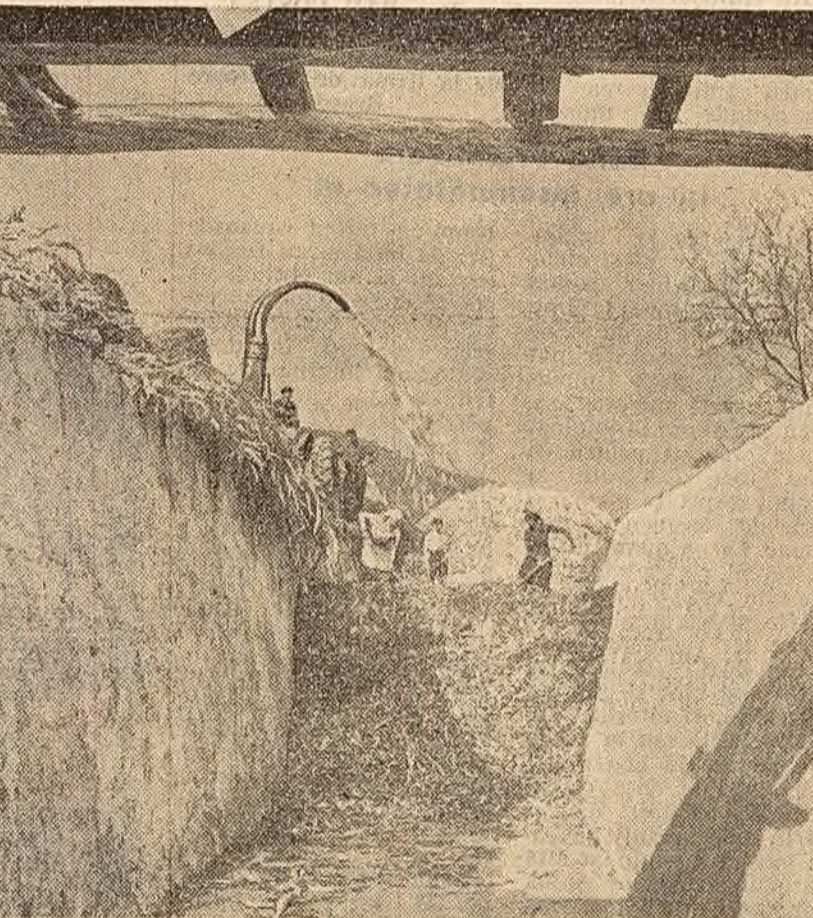
În gospodăriile de stat și gospodăriile colective continuă acțiunea de însolozare a furajelor. Pentru a asigura animalelor în timpul iernii întregul necesar de nutrețuri suculente, se folosesc la însolozare furajele provenite din culturile duble, coletele și frunzele de sîclic, borhoturi etc. În fotografie: însolozarea furajelor la G.A.C. „23 August” din Cîmpulung — raionul Muscel.

Cînd merg la gară, țărani din Căldărași trec prin Pogorăști. Numai dacă ar fi legați la ochi n-ar vedea numeroasele case pe care și le-au construit colectivștii de aici. Vorbeau cu ei și căutau să afle cît mai multe. Iată de ce au pornit cu încredere pe calea gospodăriei colective. La inaugurarea gospodăriei din Căldărași, membrii ei au adus în afară de cele 800 hectare teren, și 30 cai, 60 căruțe, 80 pluguri și altele. O dată cu acestea — după spusele lor — au adus și hotărîrea de a obține recolte bogate, de a deveni în scurt timp fruntași.