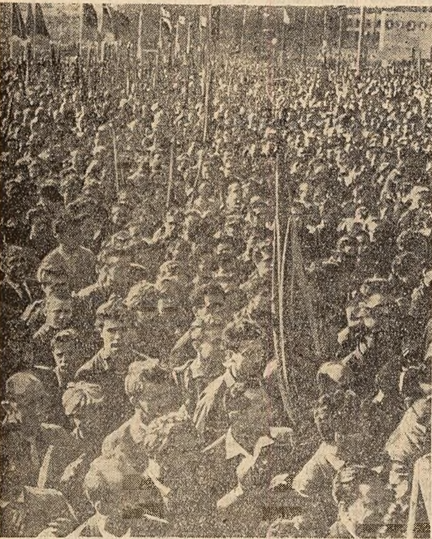
Un aspect din timpul mitingului de la Berlin.

E zi de sărbătoare în întreaga Republică Democrată Germană. Drapele roșii și tricolore flutură mândre în orașele și satele țării. La 7 octombrie milioane de oameni ai muncii au cinsit cu entuziasm cea de-a 12-a aniversare a republicii lor.