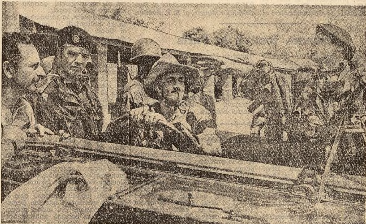
KATANGA. Un grup de mercenari în timpul unui exercițiu.

Pierre Vincent demască în continuare substratul complotului dintre Chombe și președintele Republicii Congo cu capitala la Brazzaville, Youlou. „Youlou, se spune în articol, are totul de pierdut în cazul dispariției lui Chombe. El a rupt toate punțile, cerîndu-se din cauza lui Chombe cu vîrul său, președintele Kasavubu, și cu marșalul conducătorilor naționali katanghezi. Dacă secesseanța katangheză reușește, Youlou va avea toți banii pe care îi dorește pentru că Chombe i-a promis că va finanța construirea barajului de la Kouilou-Niari. De aceea, Youlou, vasal al Franței, a făcut act de supunerii față de Chombe. Colaborarea sa este activă. Brazzaville-ul este locul prin care spionii katanghezi pătrund la Leopoldville și tot acolo sînt recrutajii uni dintre mercenarii francezi și consilierii ca celebrul Delarue (Delarue a fost adjunctul ex-pretectului de poliție Baylot care as-tăzi este deputat la Paris și preșidează „Asociația de prietenie franco-katangheză”). Tot prin capitala lui Youlou trase materialul de război de fabricație franceză, debarcat mai mult sau mai puțin clandestin la Pointe-Noire (port la Oceanul Atlantic în Republica Congo cu capitala la Brazzaville). Armamentul n-a înecat nici o clipă să se înmagazineze în Katanga. O.N.U. n-a reușit pentru că n-a vrut — n.r.) niciodată să controleze cu adevărat aerodromul de la Kolwezi de pe teritoriul Katangăi, actualmente baza de pornire a avioanelor de vînzătoare cu