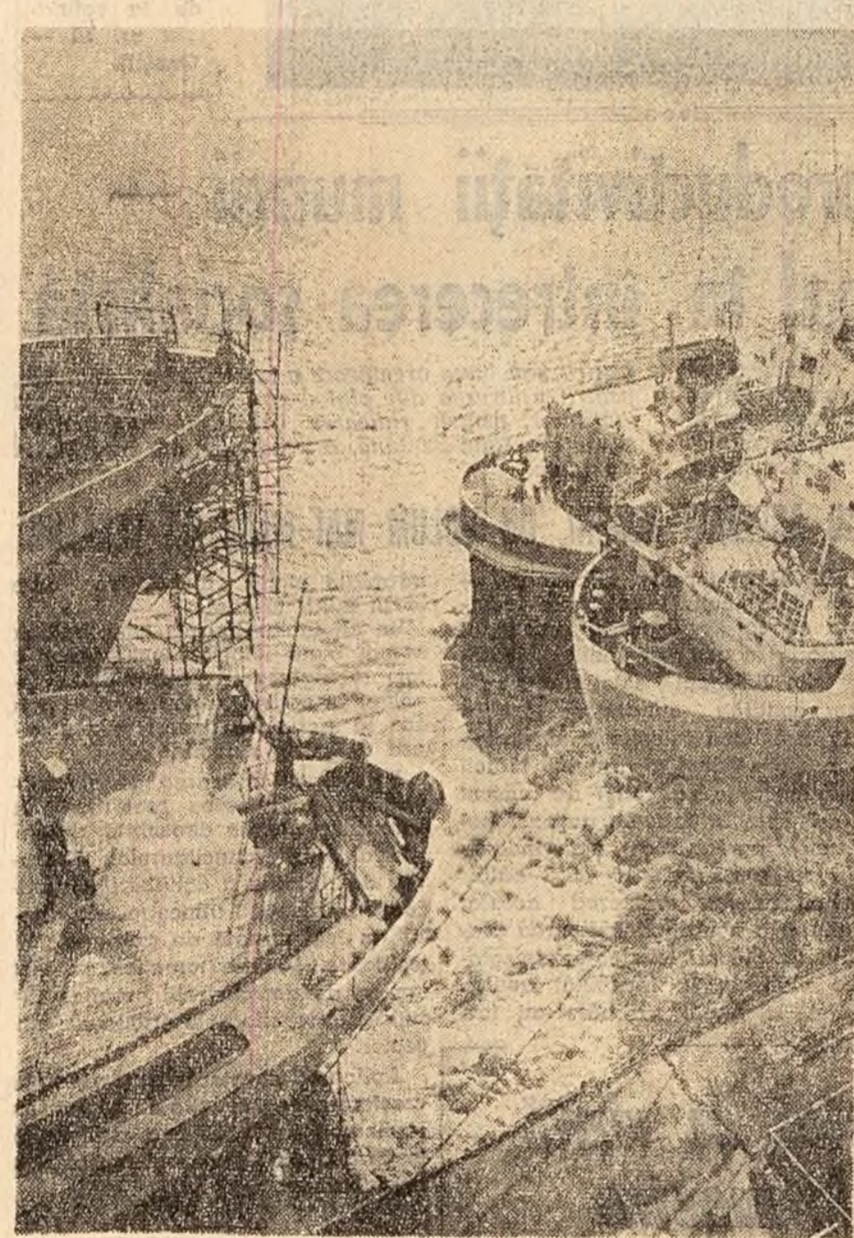
Galați: Nave ancorate în port.

O atenție deosebită a fost acordată de către organizațiile de bază organizării constituirilor de producție lunare. Îndrumarea organizației sindicale de către comitetul de partid nu s-a limitat însă nu-