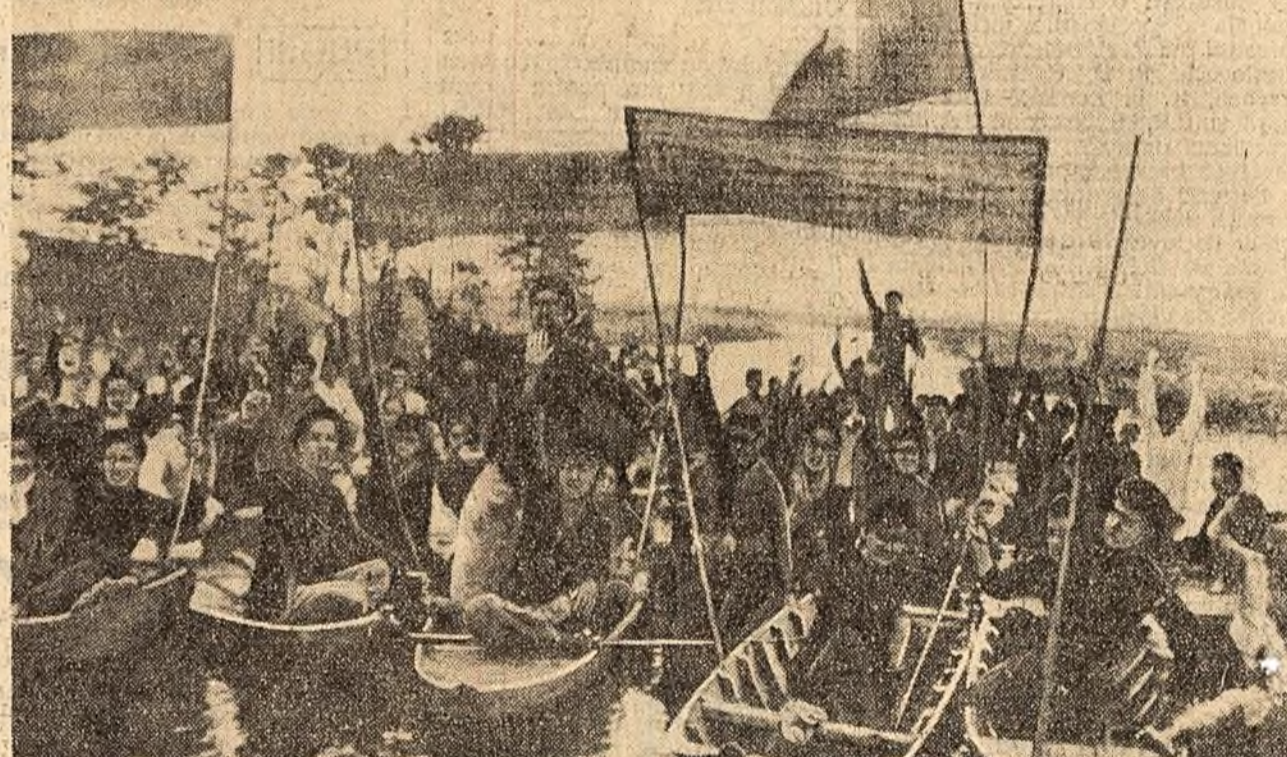
Aspect de la o mare demonstrație a populației din provincia sud-vietnameză Kien-phong împotriva dictaturii proamericane a lui Ngo Dinh Diem.

BERLIN 9 (Agerpres). — Guvernul Republicii Democratice Germane a hotărât să recunoască Republica Arabă Siria și 1-a impunitic pe