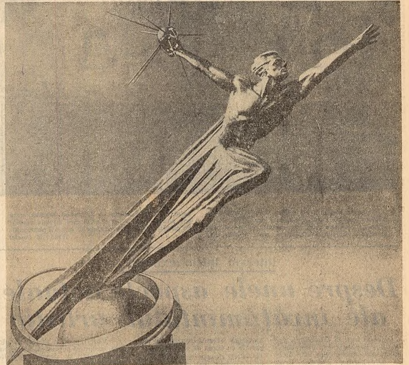
„Spre Cosmos” — o nouă compoziție a sculptorului G. N. Postnikov, închinată Congresului al XXII-lea al P.C.U.S.