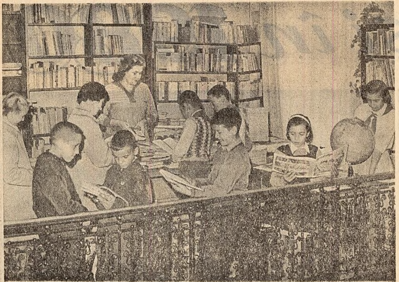
In centrul orașului Tg. Mureș funcționează o bibliotecă pentru copii. Biblioteca are 9.000 de volume și aproape 2.000 de cititori. Printre ei sînt și cititori vîrstnici. Biblioteca ne-a arătat fișa