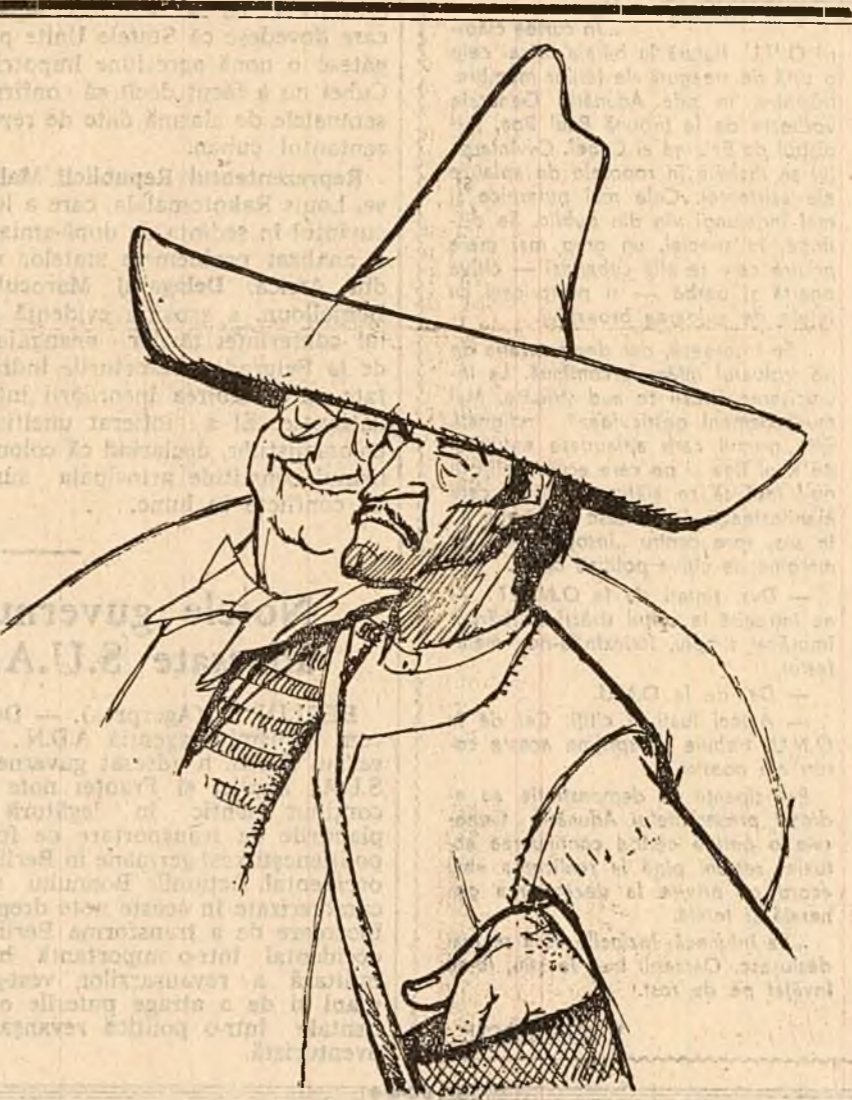
„ALIANȚA PENTRU PROGRES”. Căldășeanul Americii Latine: — Incep să înțeleg: propul să împărțim tot... tot ce e al meu!