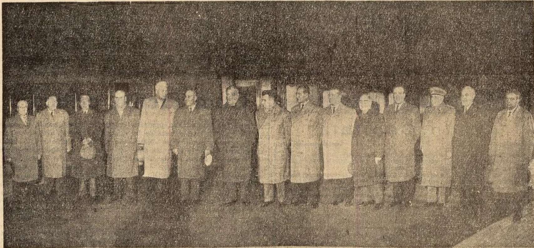
La plecare, în gara Băneasa