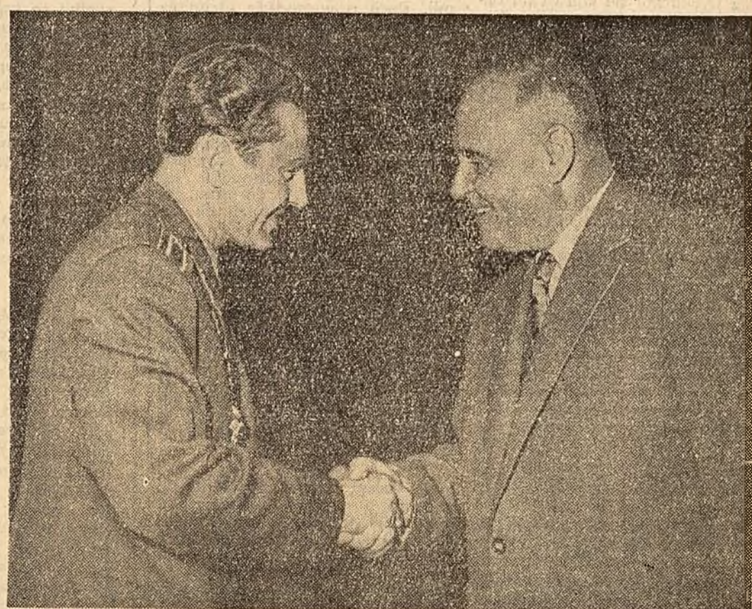
După înmînarea decorației, tovarășul Gheorghe Gheorghiu-Dej îl felicită pe cosmonautul G. S. Titov.