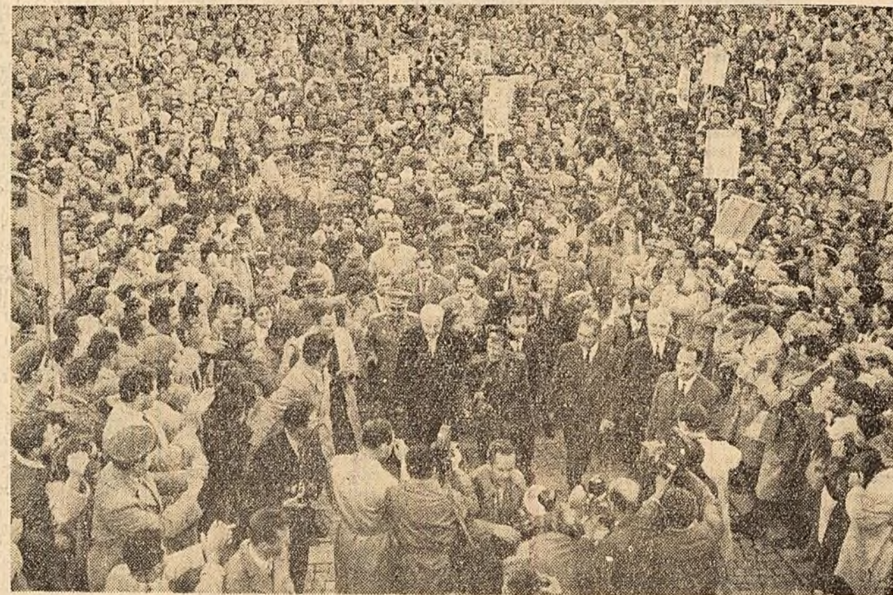
În marea de oameni, cosmonautul își croșește drum cu greș. Răsună urale, mil de oameni îl aclamă pe solul sovietic.