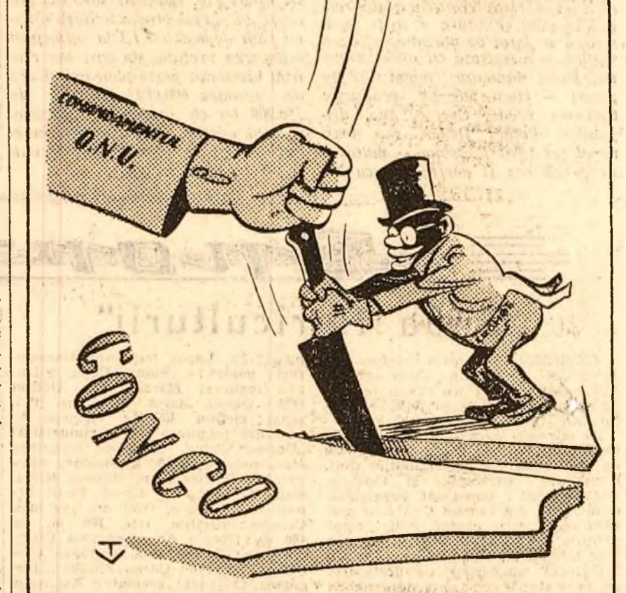
Cum înțelege comandamentul O.N.U. să lovească în separatismul katanghez.

HANOI 17 (Agerpres). — La 17 octombrie la Hanoi a avut loc o conferință de presă la care s-a dat citire scrisorii ministrului Afacerilor Externe al R. D. Vietnam, Ung Van Khien, adresată copreședinților Conferinței de la Geneva din 1954 cu privire la Indochina.