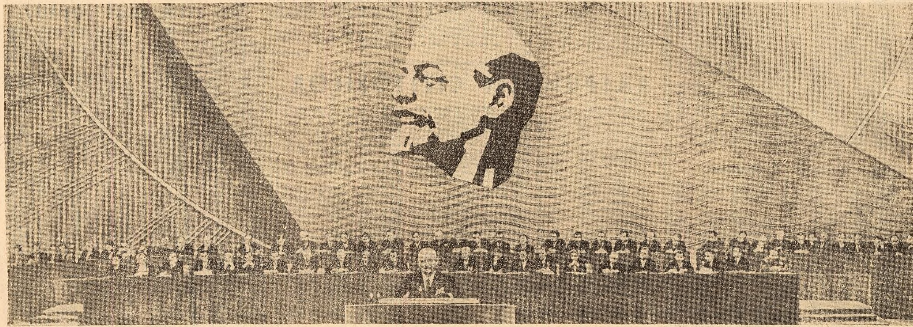
Prezidiul Congresului al XXII-lea al Partidului Comunist al Uniunii Sovietice. La tribună — tovarășul N. S. Hrușciov, prim-secretar al C.C. al P.C.U.S.