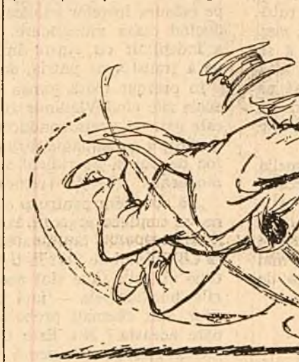
„Dacă n-ai izbutil să te ții de coadă, n-o să izbutești să te ții nici de coadă!“ (Desen de EUGEN TARU)

MOSCOVA 18 (Agerpres). — În Sala centrală de expoziții din Moscova s-a deschis expoziția unională de pictură, sculptură, grafică și artă decorativă teatrală. La expoziție sint prezentate aproximativ 3.000 de lucrări create în ultimii patru ani de cei mai de seamă artiști plastici din toate republicile unionale. Fiecare republică unională și-a organizat sectorul la expoziție potrivit tradițiilor artei sale naționale plastice și aplicate. Tema principală a majorității lucrărilor este viața de toate zilele a constructorilor comunismului. Cîmpul lucrătorului sovietic simplu a inspirat pe mulți reprezentanți de seamă ai artei plastice sovietice. Unele lucrări au fost realizate chiar în secțiile uzinelor și pe cîmpurile colhoznice.