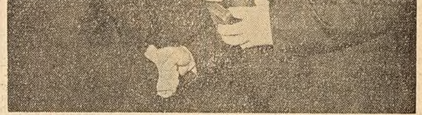
La Consiliul de Stat, după înmînarea înaltei distincții tovarășului Alexandru Moghioroș.

Tovarășul Alexandru Moghioroș a fost apoi felicitat de conducătorii de partid și de stat și de toți cei prezenți la solemnitate. (Agerpres)