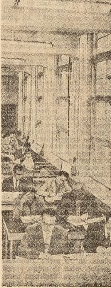
La biblioteca Academiei R. P. Române.