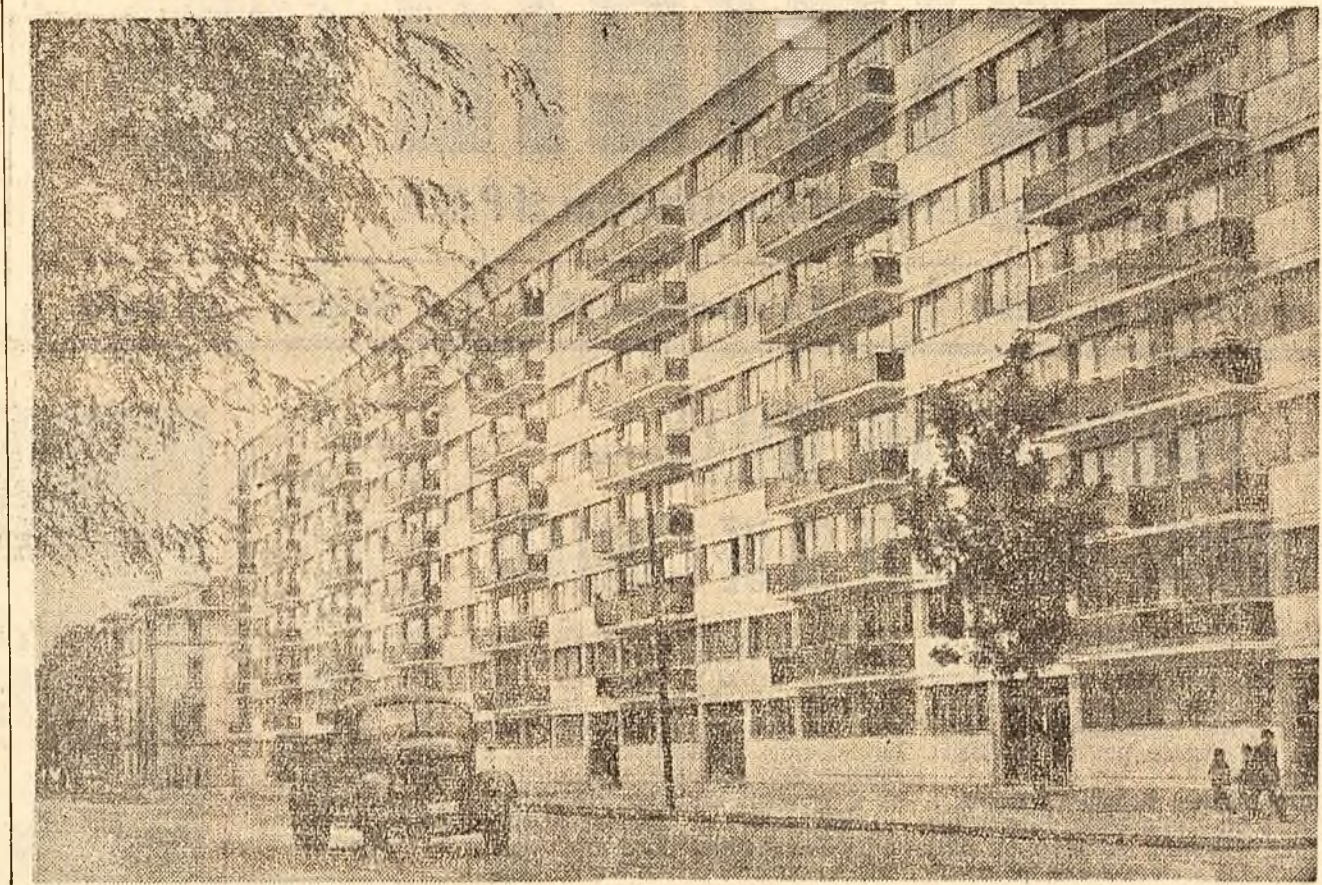
Blocuri noi în cartierul Plepănari din Capitală

Pentru a se asigura un număr de cadre ingineresci cu înaltă calificare, care să cunoască în profunzime problemele economice, tehnice, de organizare și conducere a producției întreprinderilor socialiste, hotărîrea Consiliului de Miniștri stabilește că pregătirea inginerilor economiști în învățămîntul postuniversitar se va