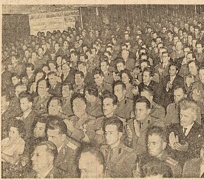
Aspect din timpul adunării festive

În continuare, tovarășul Leonțin Sălăjan a spus: Asupra militarilor romîni au avut o influență deosebită eroismul și vitejia cu care au acționat în timpul insurecției armate formările de luptă patriotice, create și conduse nemijlocit de partid, precum și sprijinul neprecupețit acordat armatei de întregul popor pentru ducerea războiului antihitlerist.