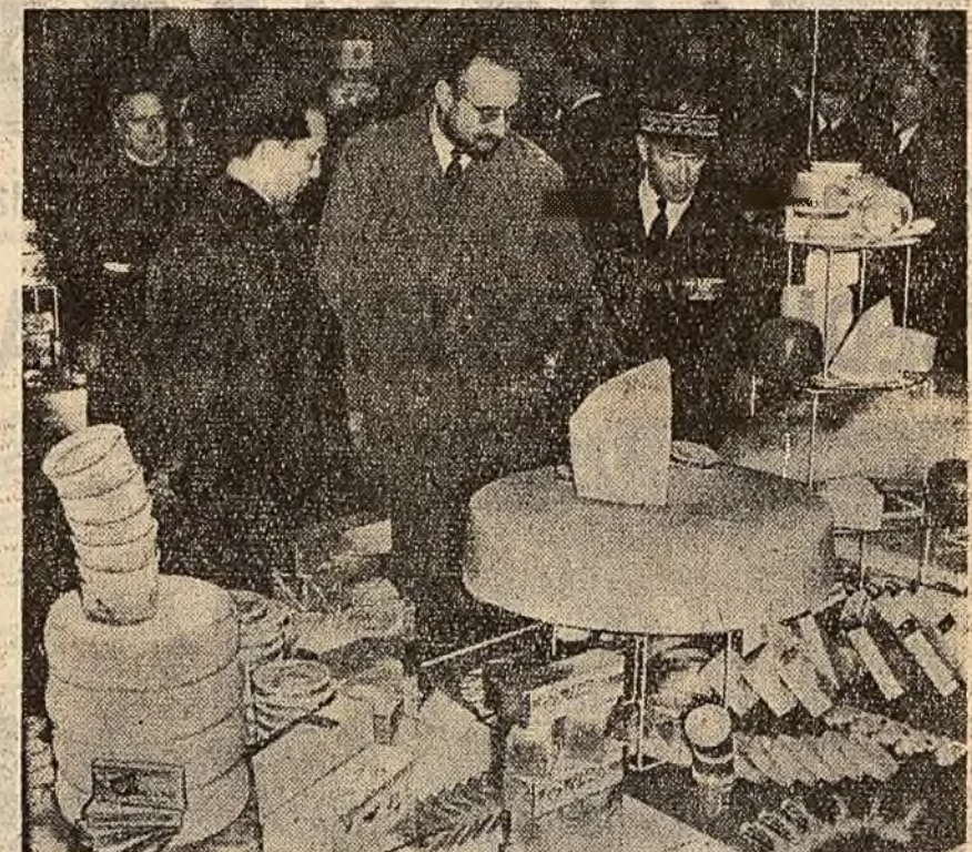
Ziarele din Dijon publică aprecieri elogioase despre standul R. P. Romine la cel de-al 32-lea Targ alimantar international...