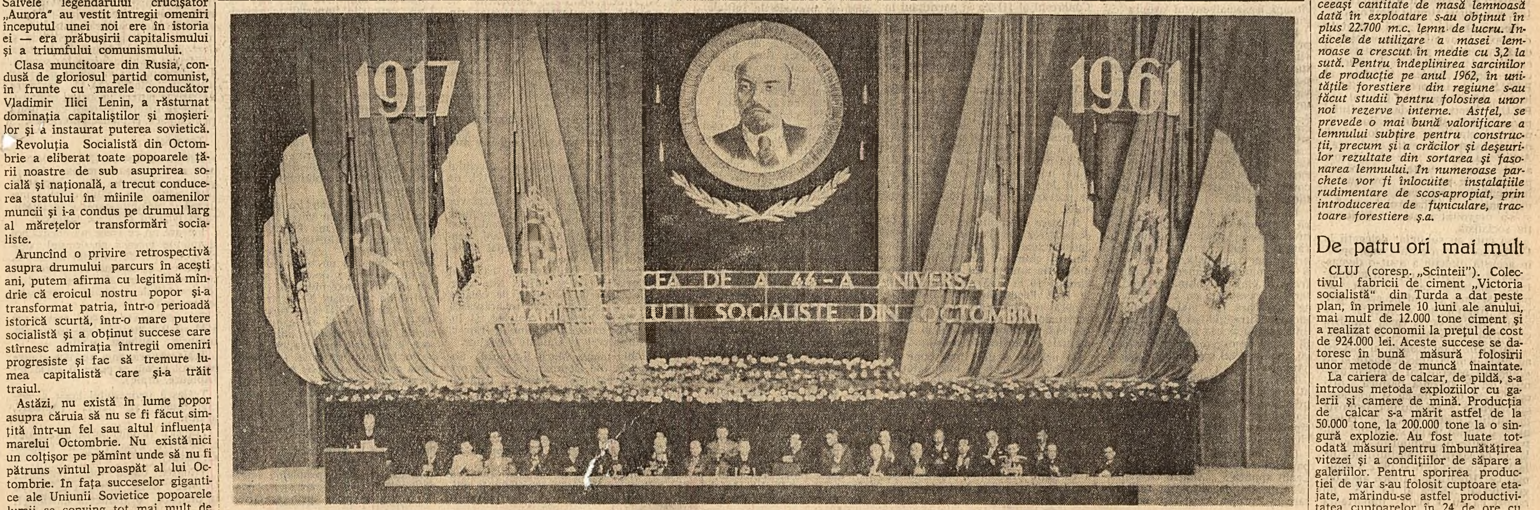
Prezidiul adunării festive din sala Palatului R. P. Romine.