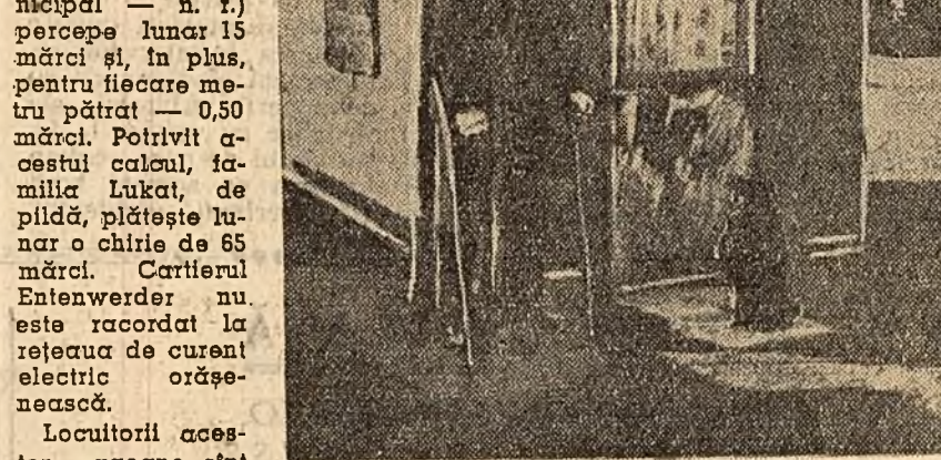
Itată cum arată „locuința” unui invalid din cartierul Entenwerder.

Locuitorii acestor va- gome sînt considerați oam- eni de catego-