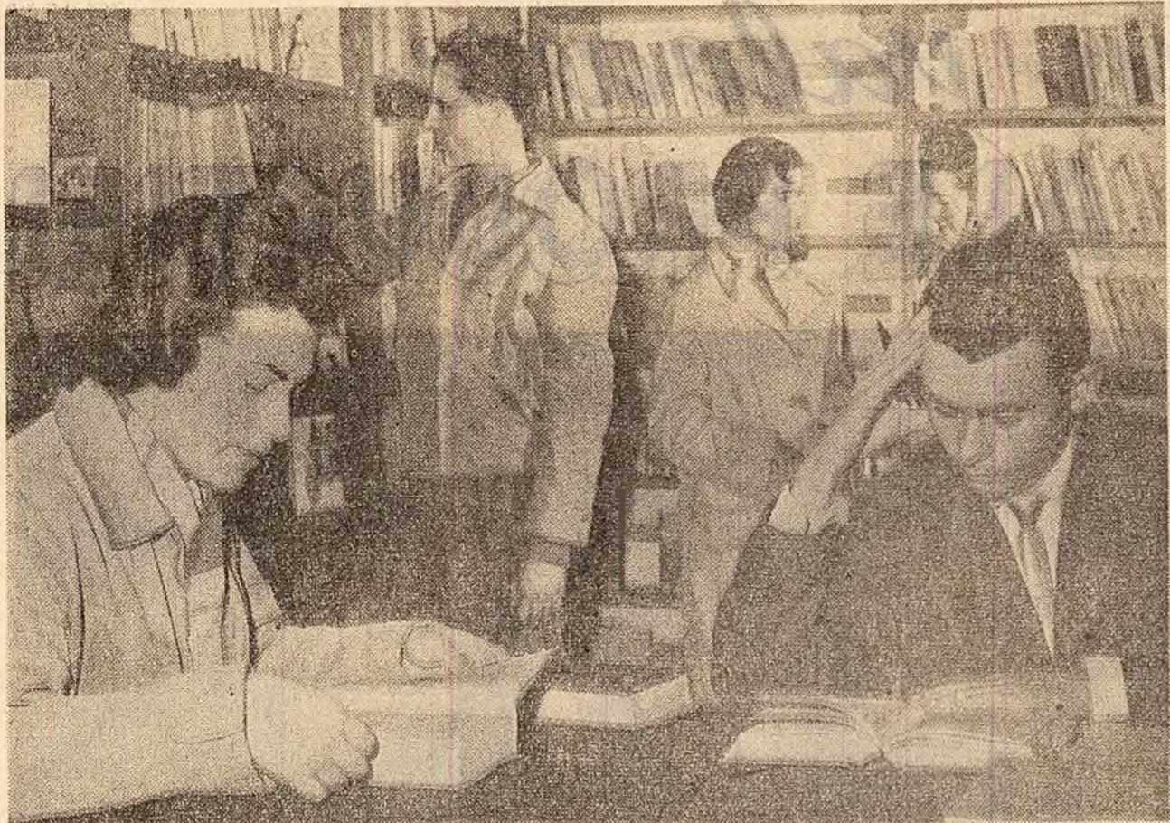
Biblioteca raională din Bistria are peste 67.000 volume și este frecventată de numeroși cititori. În fotografie: un aspect din secția imprumut cu rafturi libere.