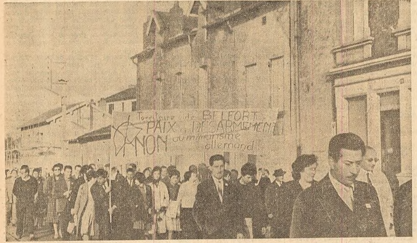
Peste 10.000 de locuitori din orașul francez Auboué au manifestat împotriva militarismului vest-german și pentru rezolvarea problemelor germane prin încheierea Tratatului de pace. Pe pancartele scrie: „Pace și dezarmare”, „Nu — militarismului german!”.

PARIS 8 (Agerpres). — Luni, organizația Ajutorul popular francez și Asociația studenților în medicină au organizat în sala „Mutualité” din Paris o adunare publică la care au luat cuvîntul numeroși medici, suferitori precum și studenți de la facultatea de medicină.