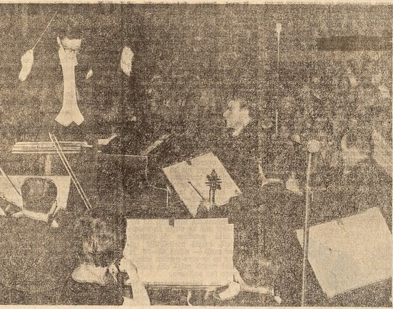
Dialog cu prietena din vitrina...