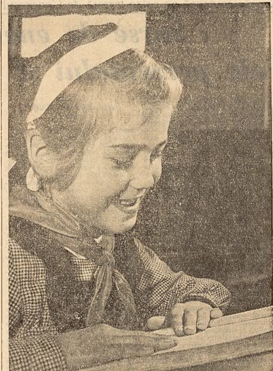
Foarte interesantă carte...

În cadrul ciclului „Muzica de-a lungul veacurilor”, început în seajuna trecută, Filarmonica