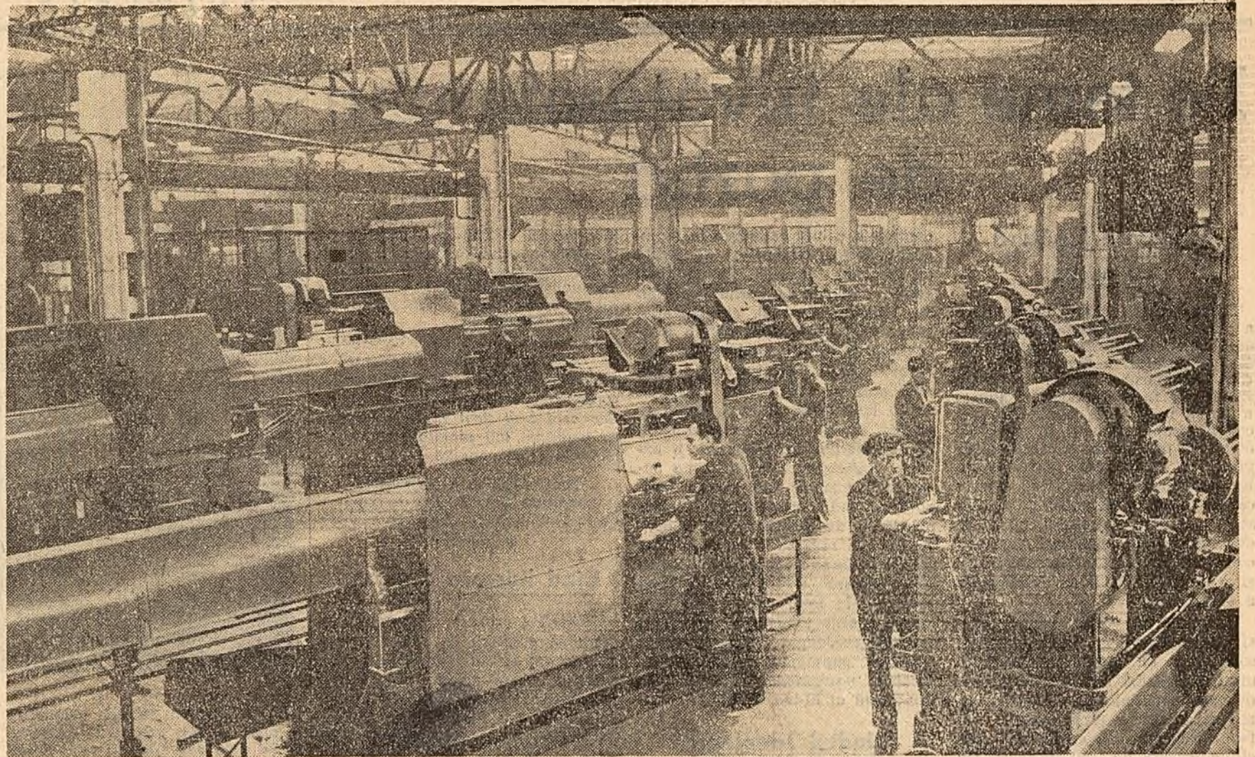
Anul acesta, fabrica de rulmenți din Birlad a fost înzestrată cu noi mașini și utilaje moderne. S-au montat peste 20 de mașini — printre care mașini de rectificat, strunguri automate cu patru axe, ciocan la forță etc. În fotografie: un aspect din atelierul de strungărie.