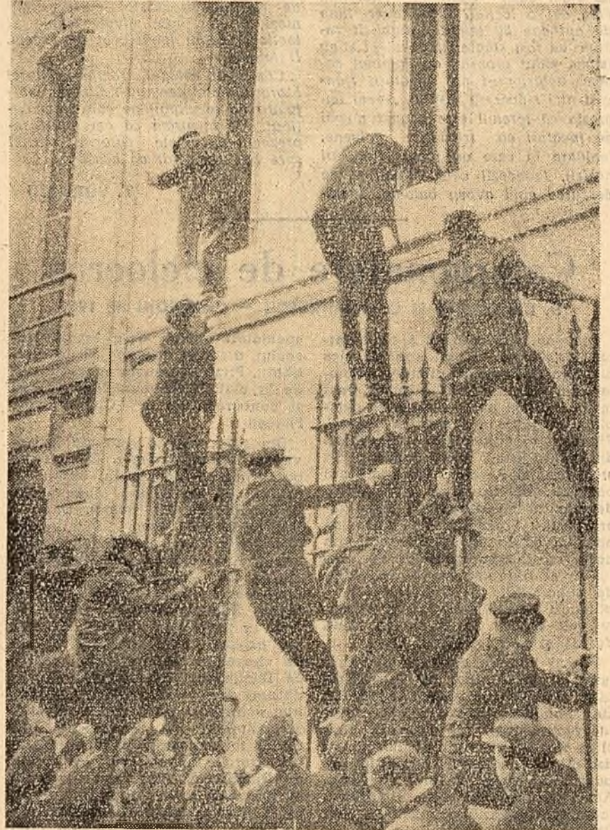
Muncitorii întreprinderilor de transport în comun din Marsilia și cei din alte numeroase orașe franceze, au declarat grevă. La Marsilia o delegație a fost trimisă de grsvigli la sediul direcției, dar n-a fost primită. Pentru a-și face cunoscuta totuși revendicările, cișiva greviști au escaladat zidurile întreprinderii, pătrunzînd în clădire.