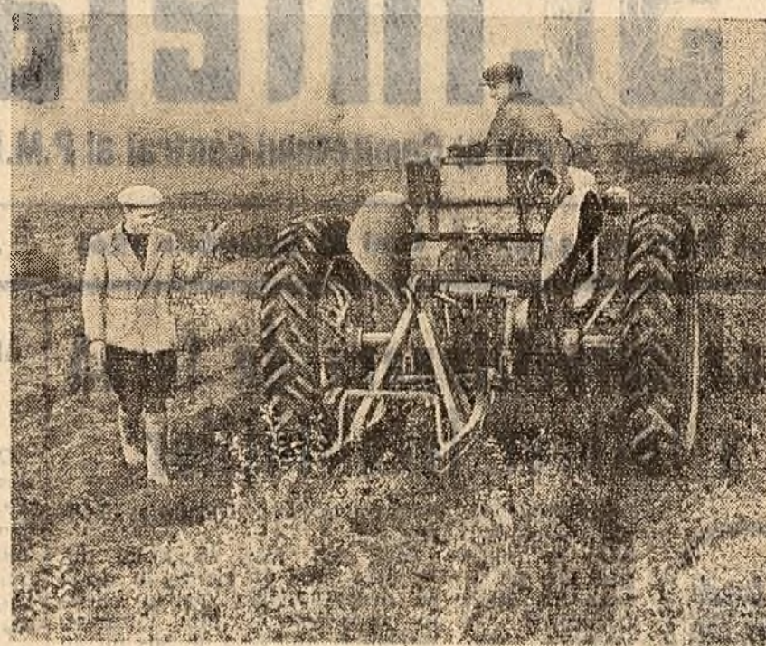
Trandafirii se soot în mod mecanizat. Tehnicianul Gh. Cirlig dă indicații asupra aștinții la care trebuie scoși trandafirii