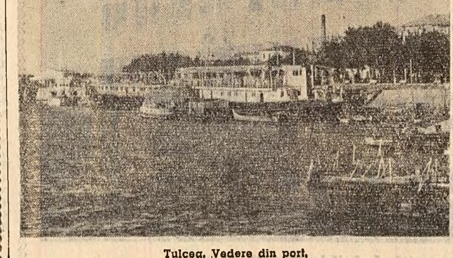
Tulcea, Vedere din port.

CUM VA FI VREMEA Timpul probabil pentru zilele de 14, 15 și 16 noiembrie: Vremea continuă să se răcească, cer variabil mai mult acoperit. Ploaie intermitentă vor continua să cadă mai ales în Cîmpia Dunării. În regiunea muntelui și în partea de nord-est a țării — lapoviță și ninsoare; vînt puternic, temporar cu intensificări pînă la tînc. În est și nord-est. Mînci-mor, vor fi cuprinse între plus 5 și plus 8 grade, mai ridicate în Banat și Oltenia, iar maximele între 2 și 12 grade.