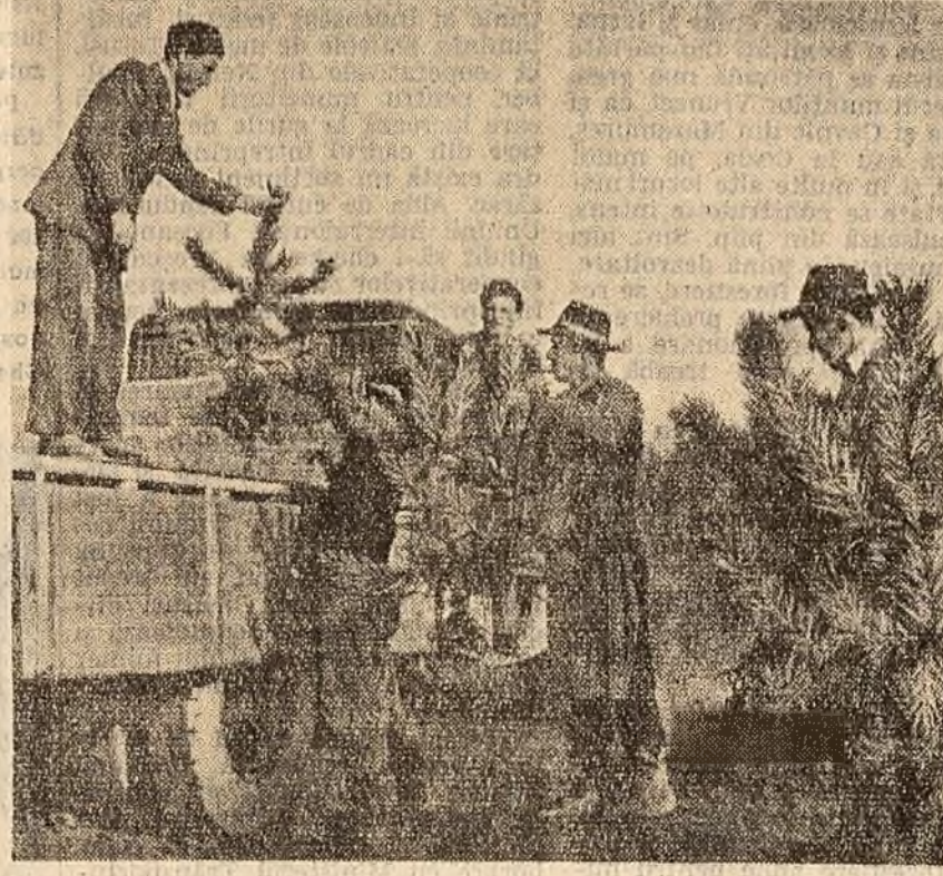
Au sosit beneficiarii. Se încarcă în camion duglas, larice, pin, tuia