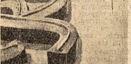
Aspect din secția de firme luminoase a fabricii „Electrolux” din Capitală.

IAȘI (coresp. „Scinteia”). — Colectivul fabricii „Teșlău”-Iași a obținut în acest an succese deosebite. În primele 10 luni ale anului s-au produs peste plan 33.700 kg. fier de bumbac și 146.200 m.p. țesături. În trei trimestre au fost realizate 257.000 lei economii prin reducerea prețului de cost și 112.000 lei beneficii peste plan. La baza obținerii acestor succese a stat preocuparea colectivului pentru folosirea rezervelor interne. În preparația țesăturii, spre exemplu,