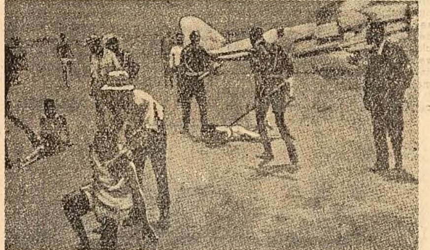
Se răresc rîndurile trupelor marionetel Chombe. Soldații care au dezertat, prinși la frontiera regiunii Katanga, sînt maltratați pe aeroportul Kamina.