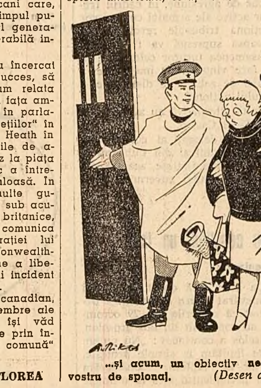
„și acum, un obiectiv neprevăzut în planul vostru de spionaj.” (Desen de RIK AUERBACH)